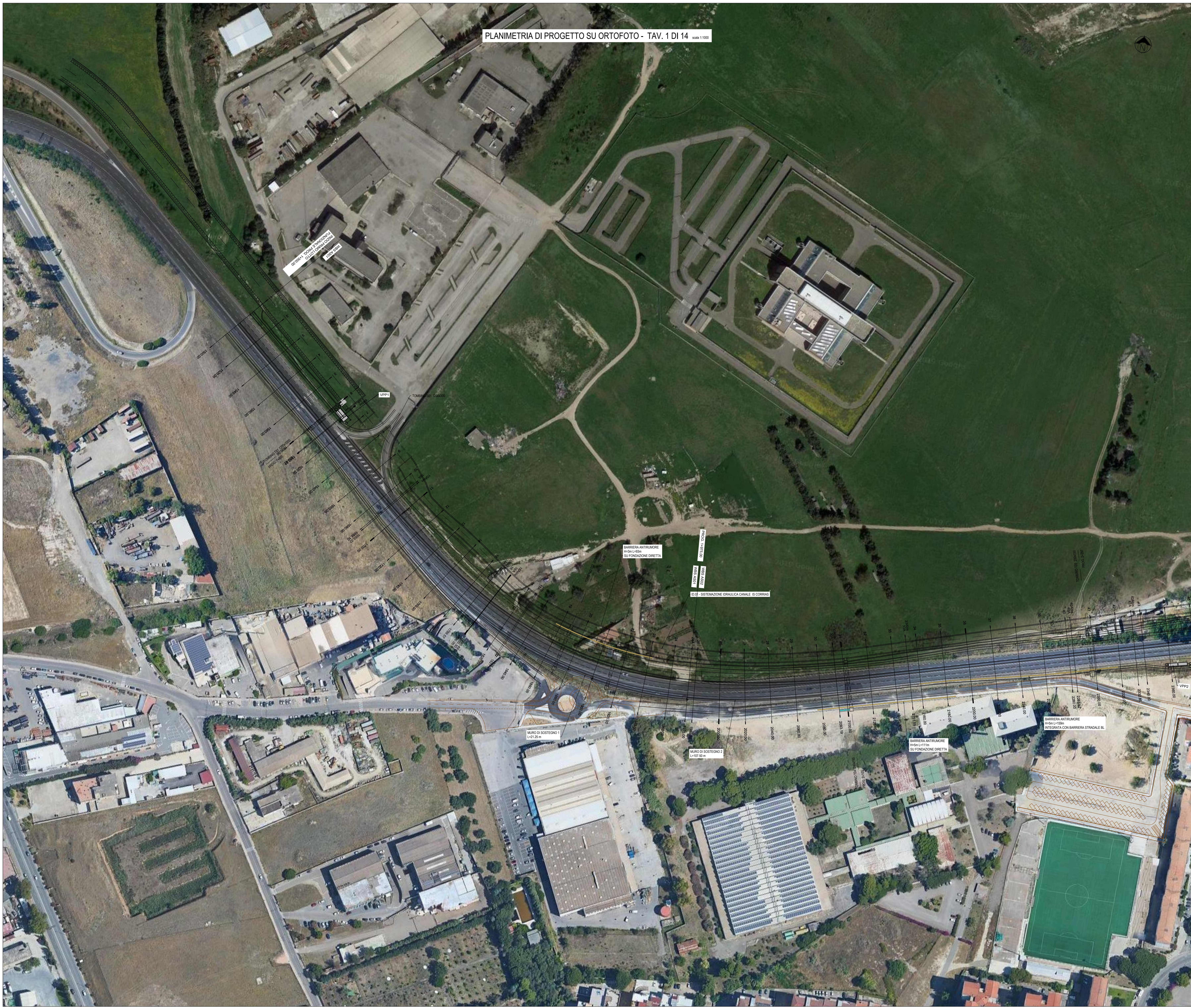
PLANIMETRIA DI PROGETTO SU ORTOFOTO - TAV. 1 DI 14 scala 1:1000