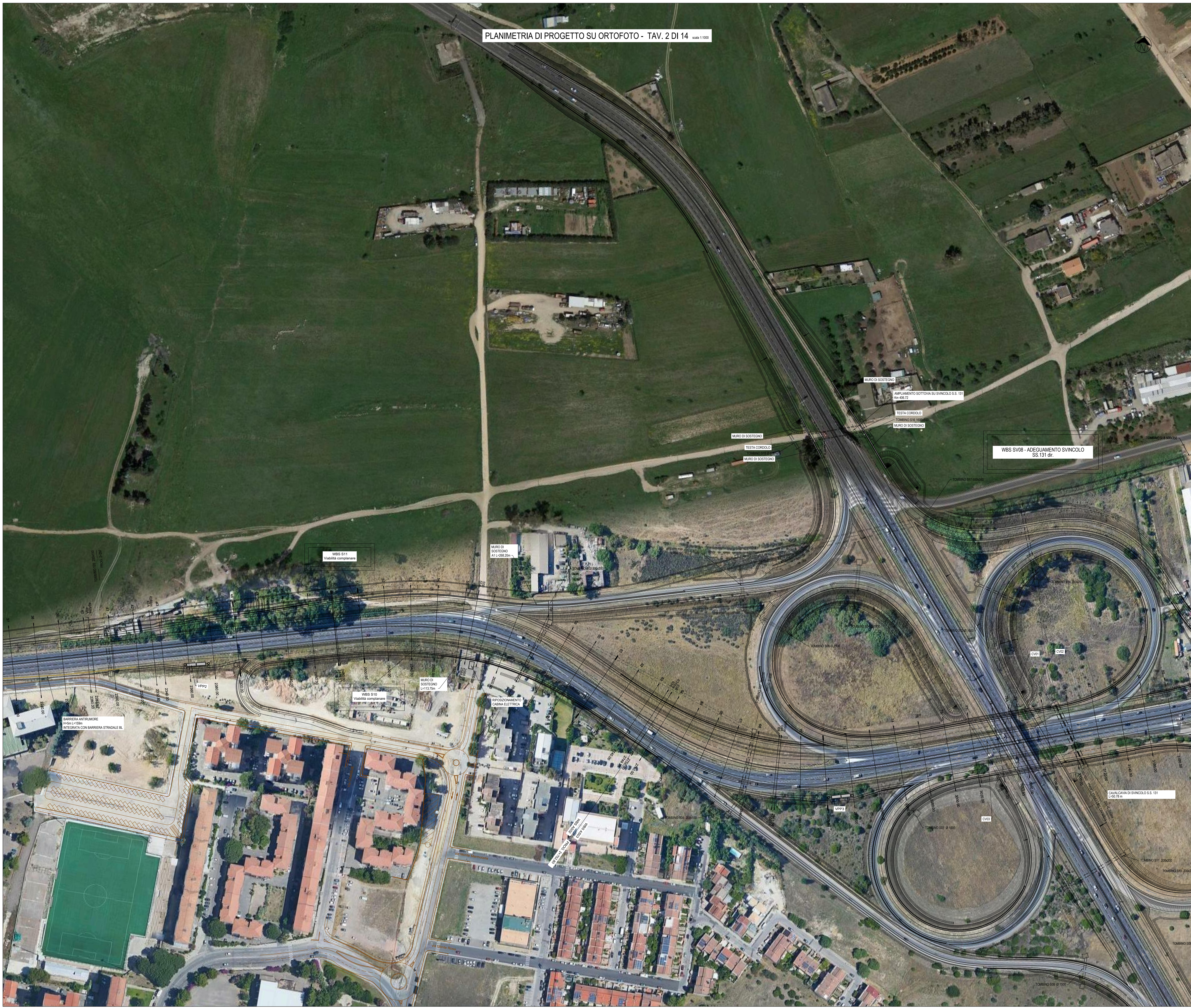
PLANIMETRIA DI PROGETTO SU ORTOFOTO - TAV. 2 DI 14 scala 1:1000