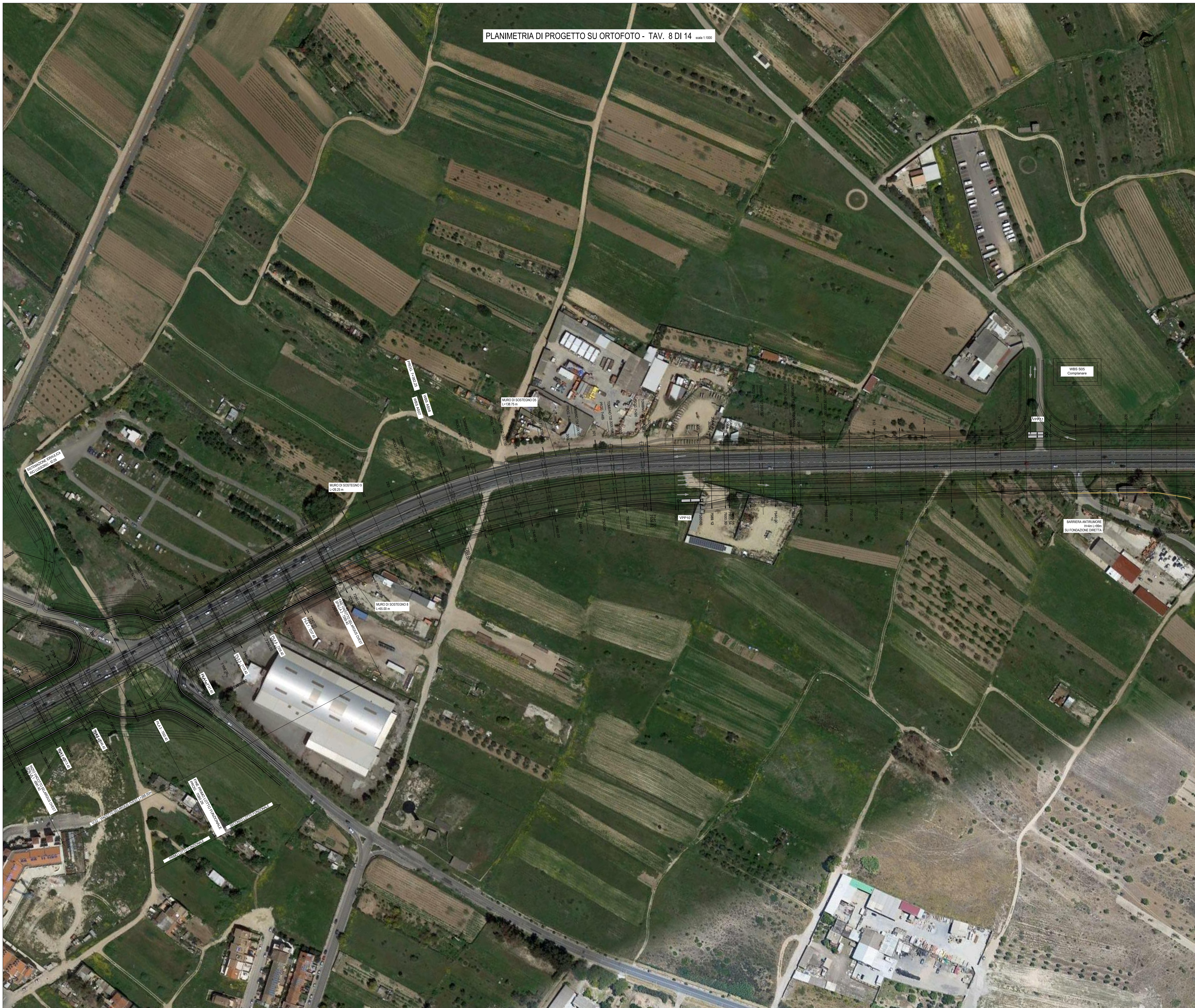
PLANIMETRIA DI PROGETTO SU ORTOFOTO - TAV. 8 DI 14 scala 1:1000