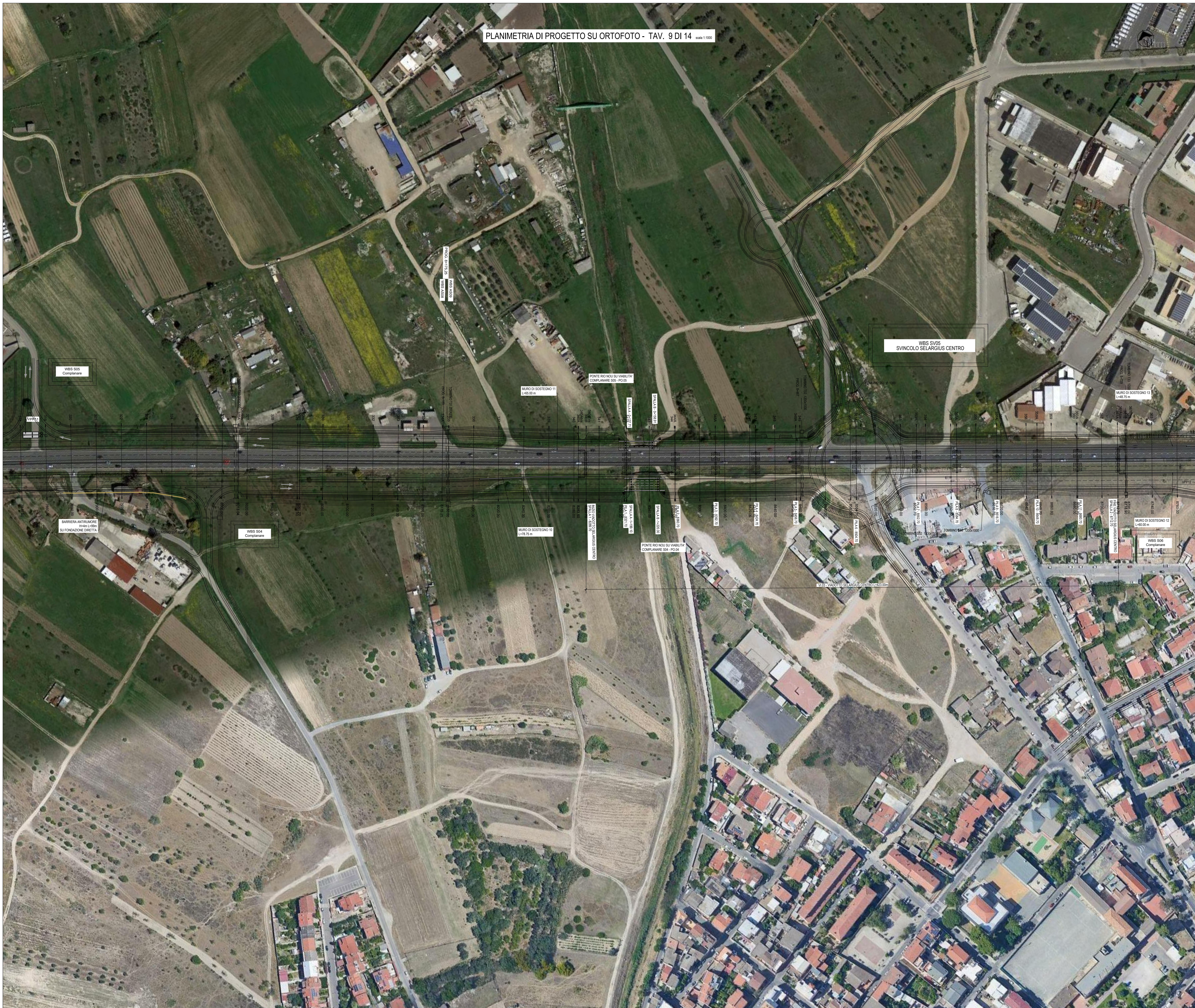
PLANIMETRIA DI PROGETTO SU ORTOFOTO - TAV. 9 DI 14 scala 1:1000