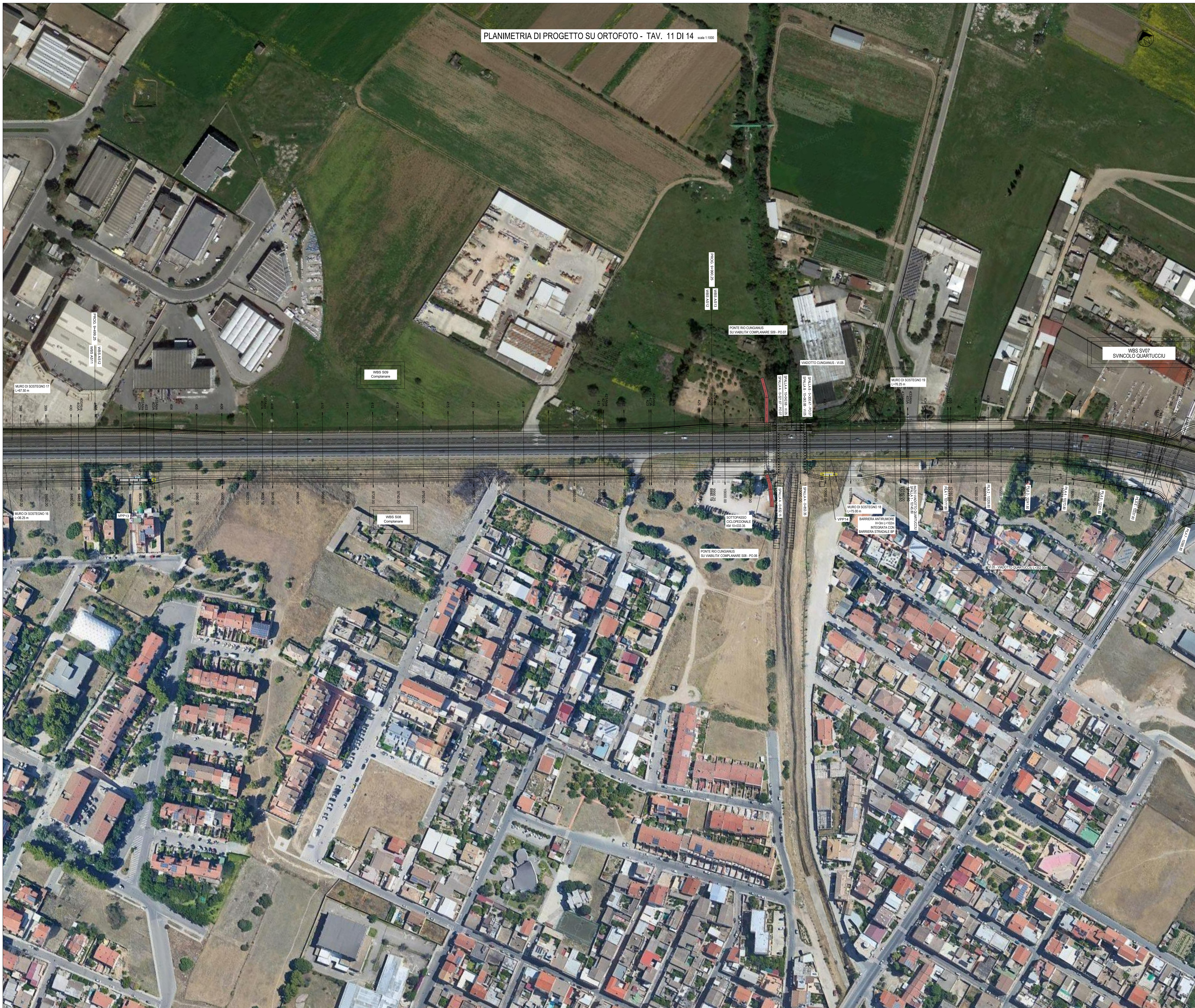
PLANIMETRIA DI PROGETTO SU ORTOFOTO - TAV. 11 DI 14 scala 1:1000