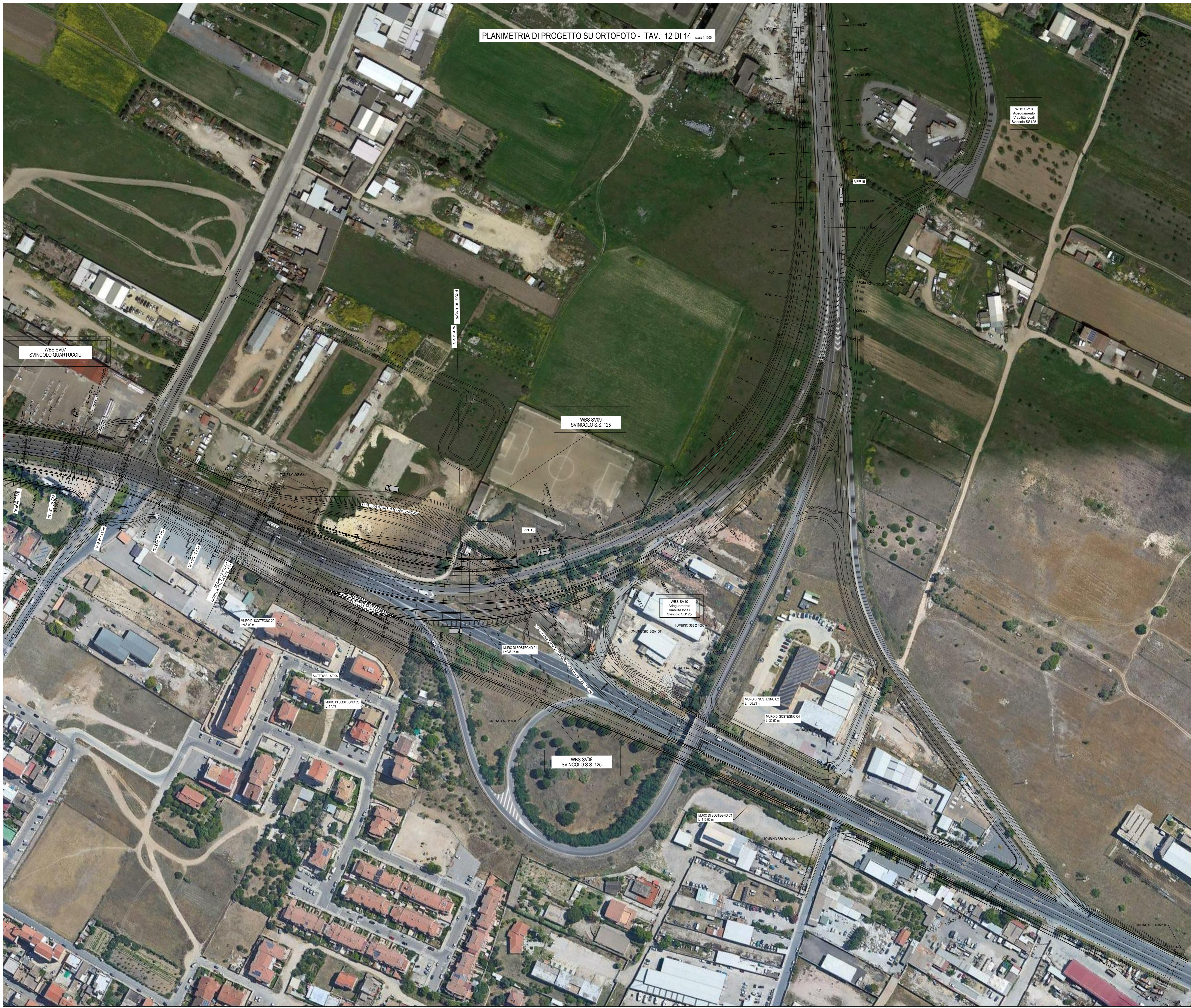
PLANIMETRIA DI PROGETTO SU ORTOFOTO - TAV. 12 DI 14