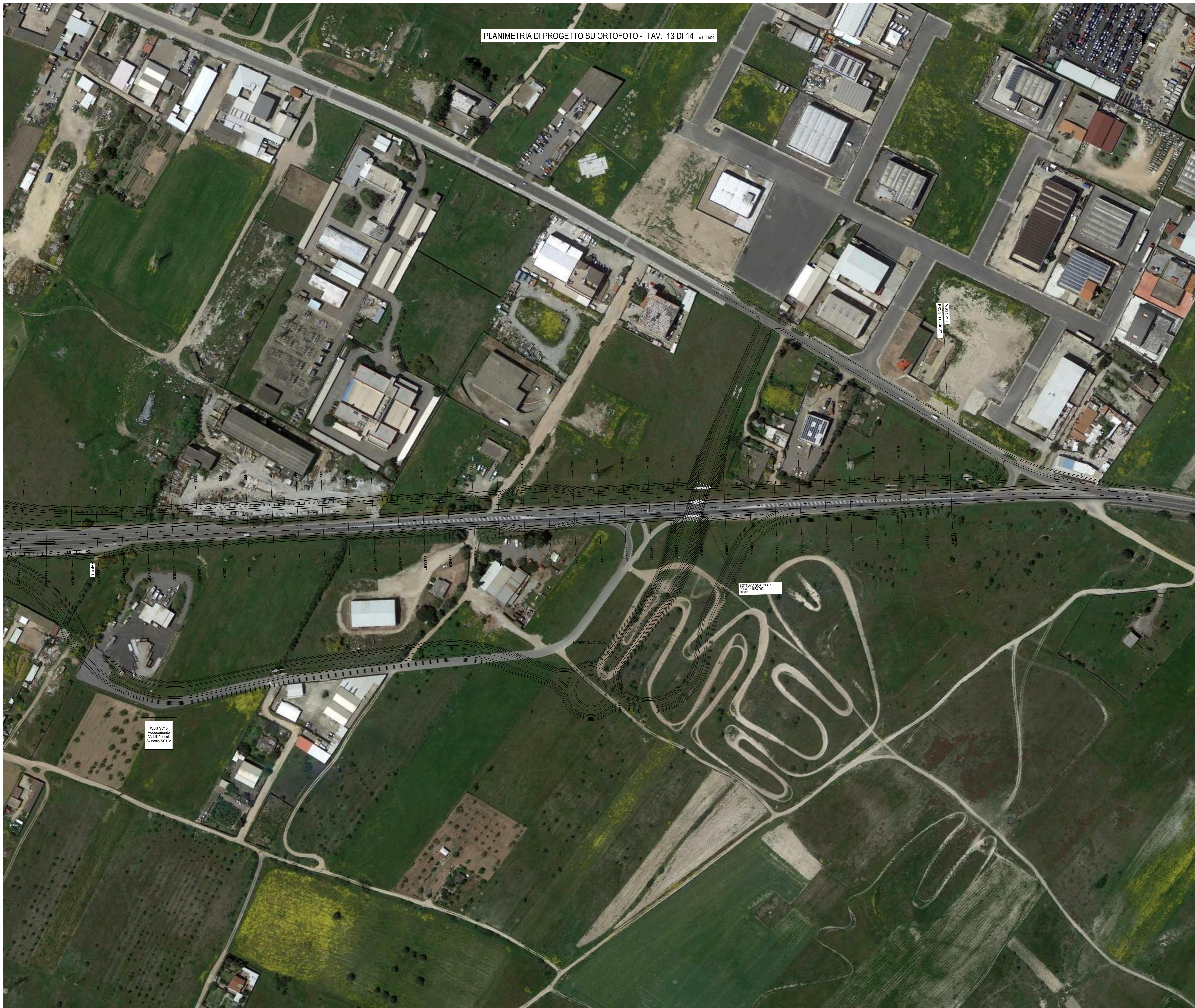
PLANIMETRIA DI PROGETTO SU ORTOFOTO - TAV. 13 DI 14 scala 1:1000