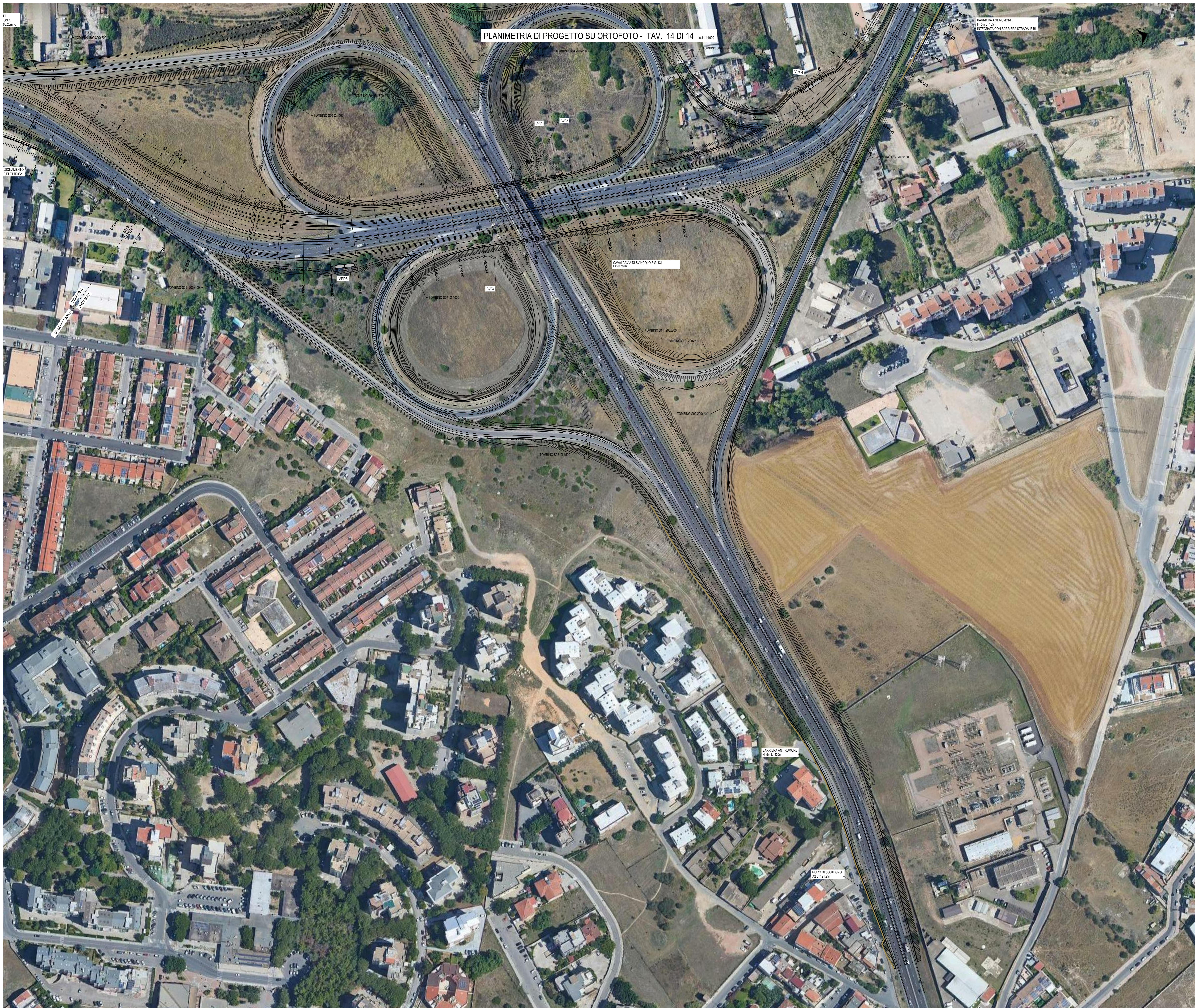
PLANIMETRIA DI PROGETTO SU ORTOFOTO - TAV. 14 DI 14