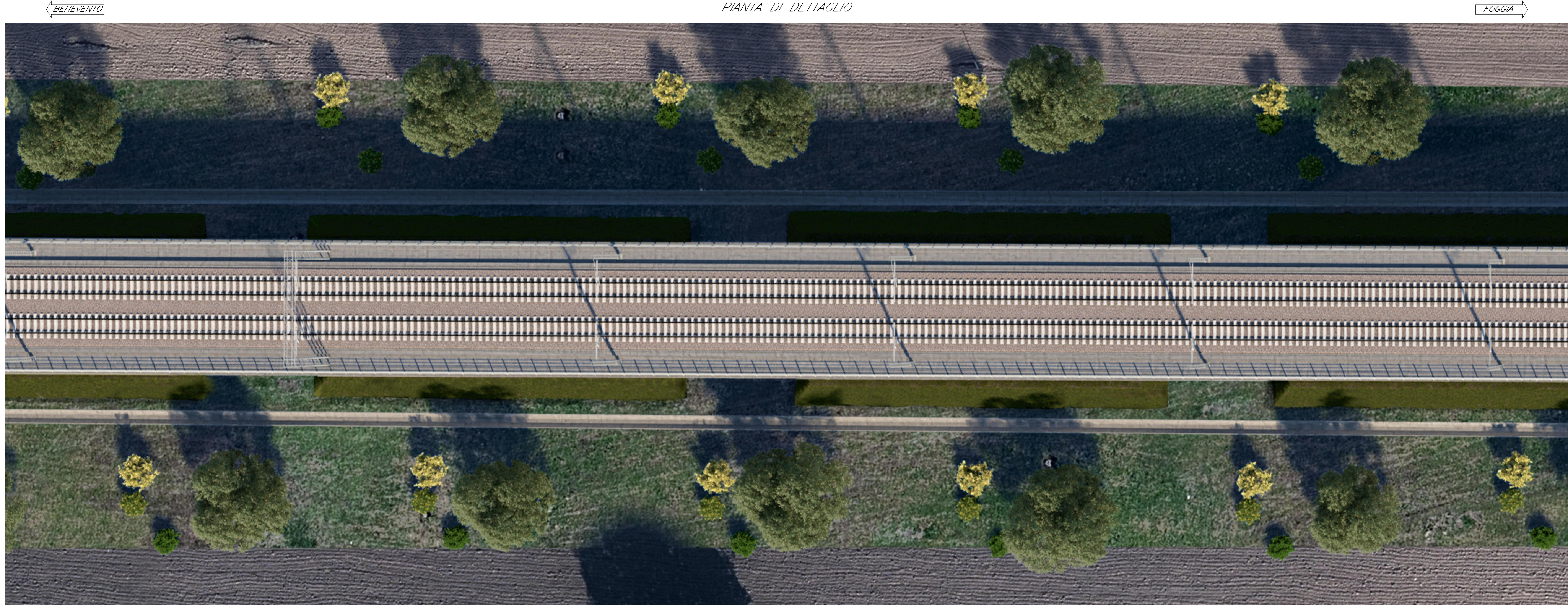
PIANTA DI DETTAGLIO