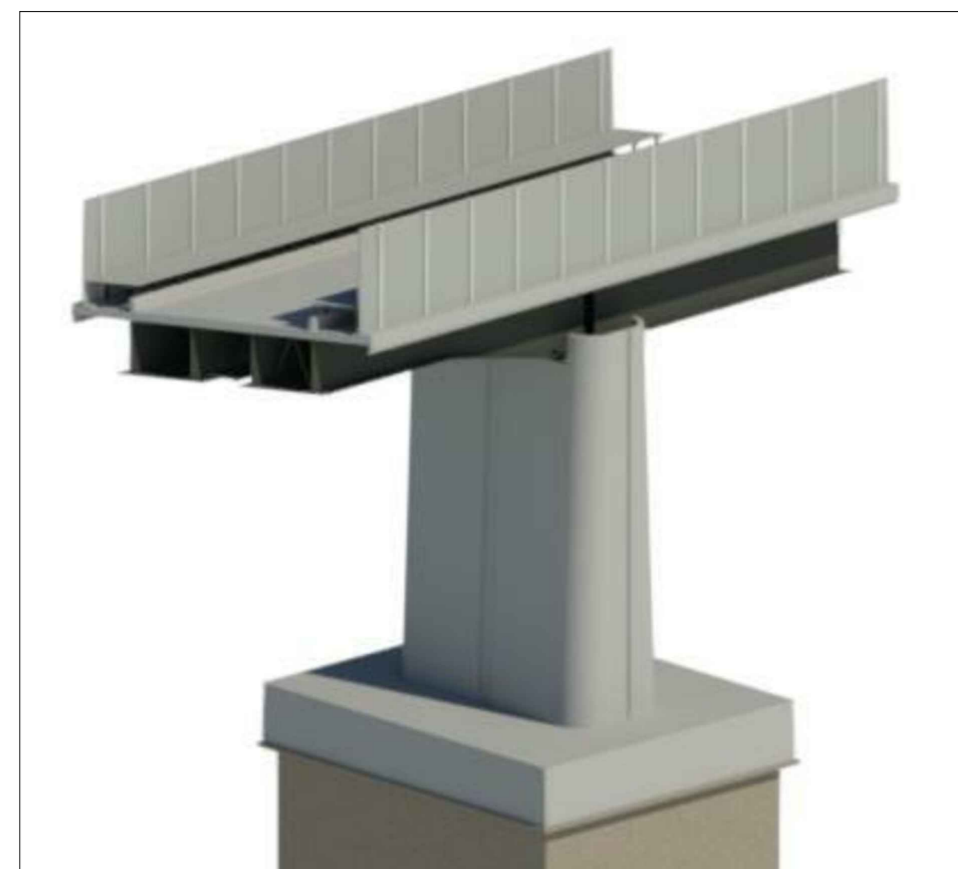
VISTA ASSONOMETRICA IMPALCATO IN ACCIAIO LUCE 65/45 m