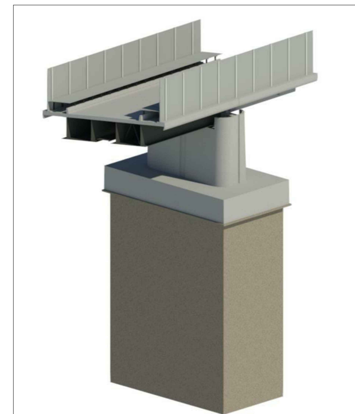
VISTA ASSONOMETRICA IMPALCATO IN ACCIAIO/CAP LUCE 45/25 m