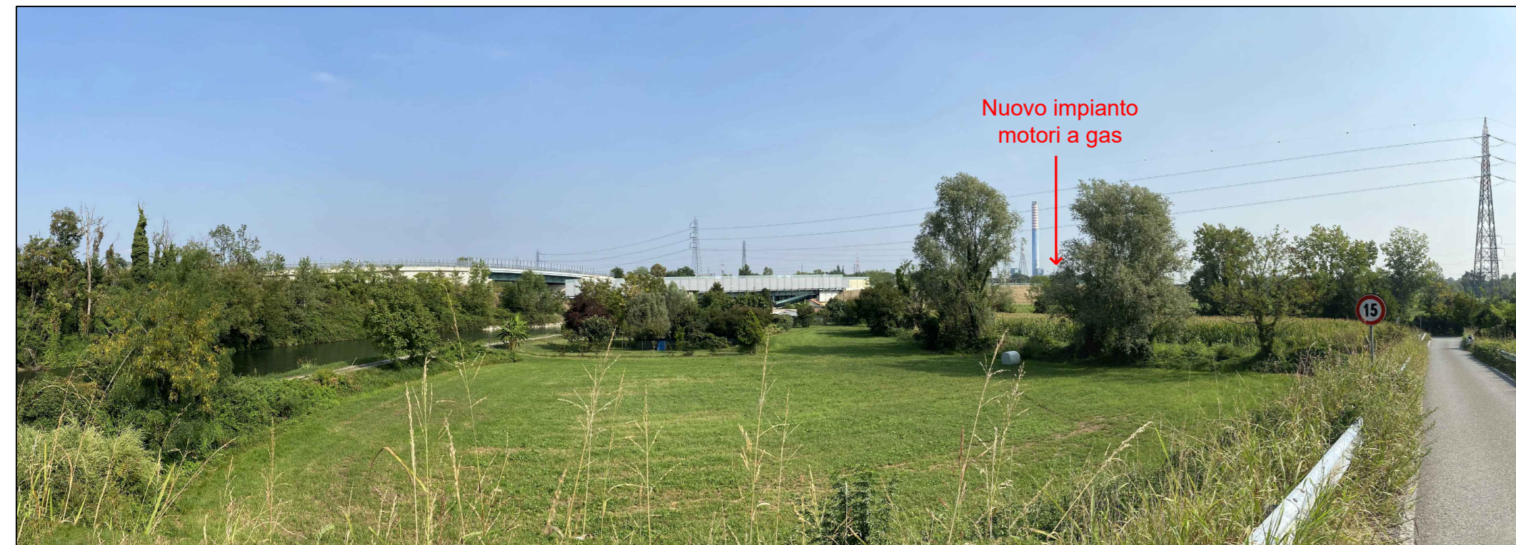
Fotoinserimento da PVA - Stato futuro con ipotesi camini azzurri