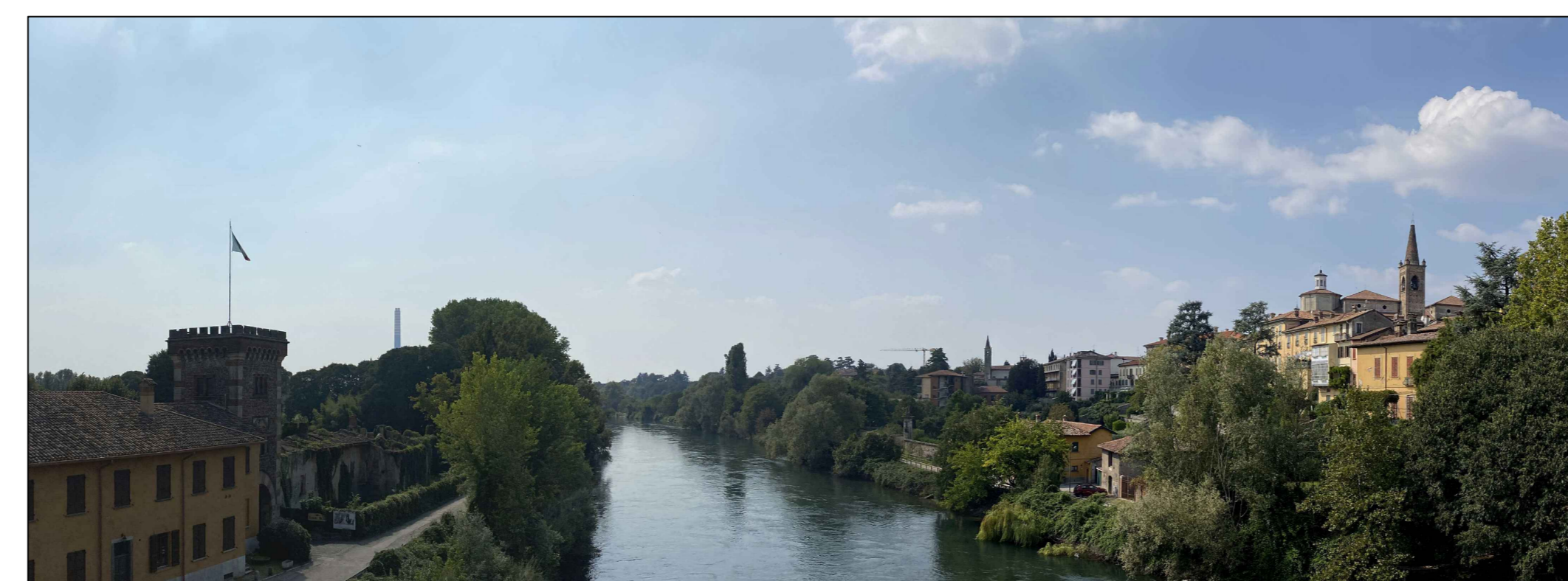
Fotoinserimento da PVD - Stato ante operam