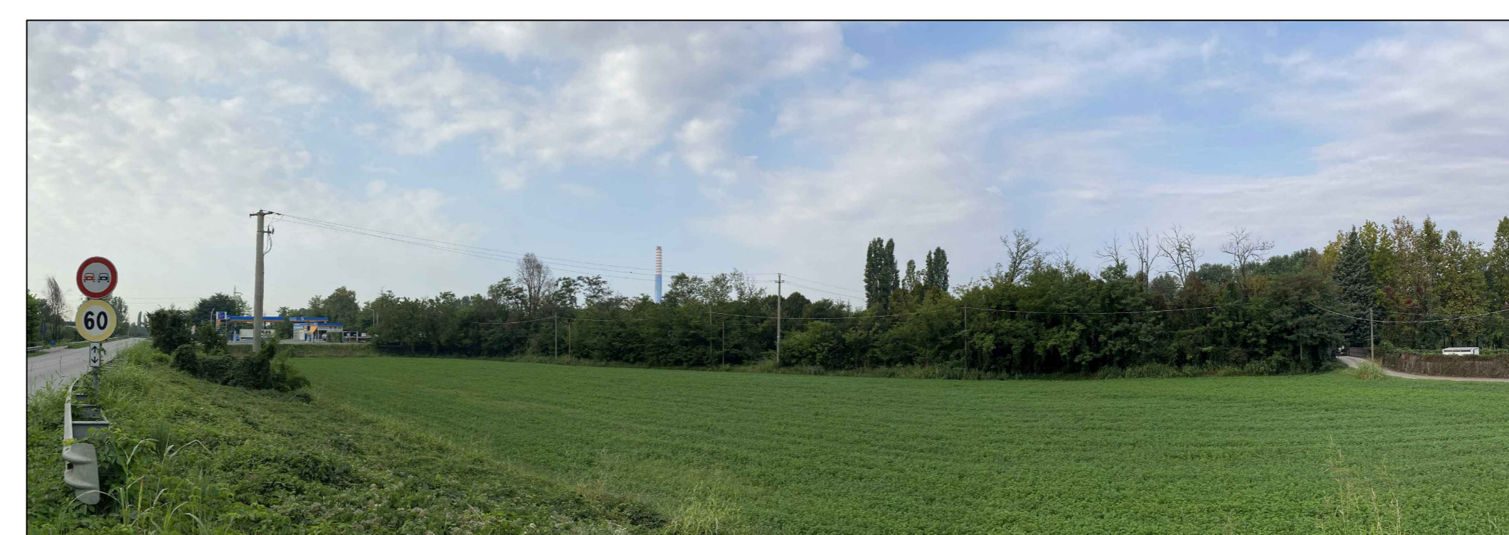
Fotoinserimento da PVE - Stato ante operam