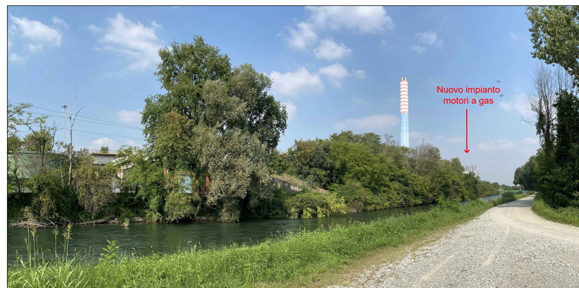
Fotoinserimento da PVB - Stato futuro con ipotesi camini grigi