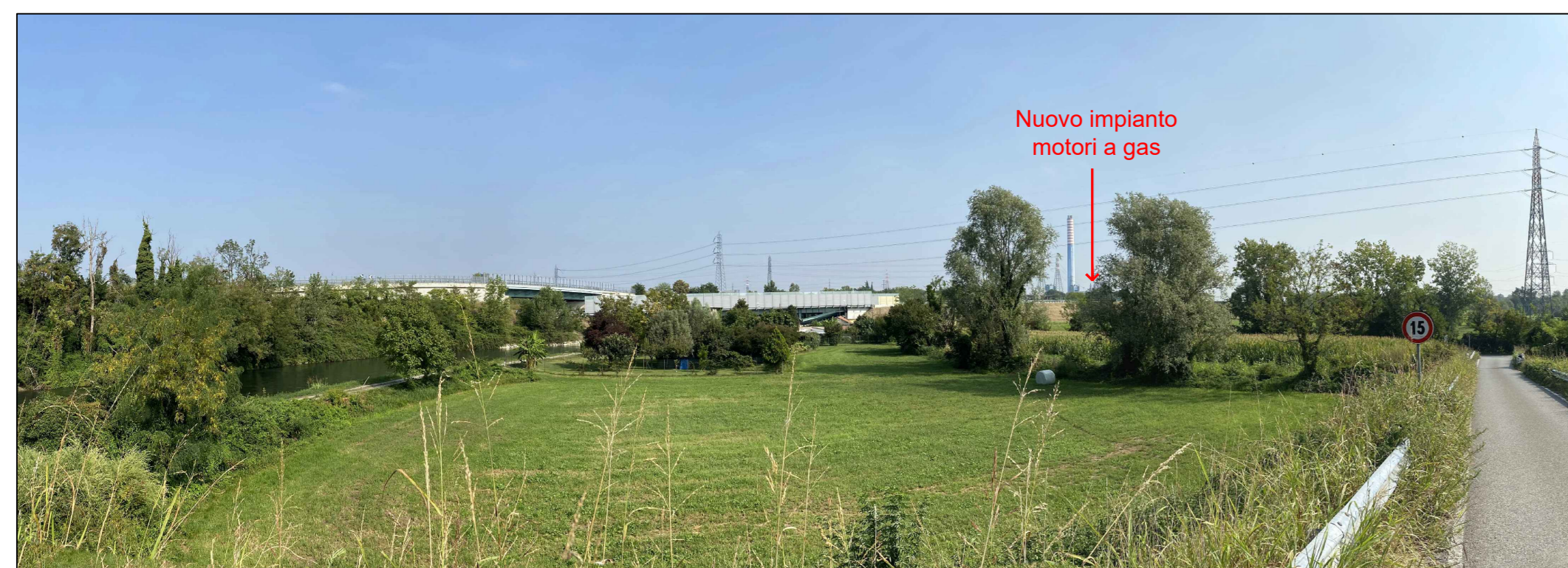
Fotoinserimento da PVA - Stato futuro con ipotesi camini grigi