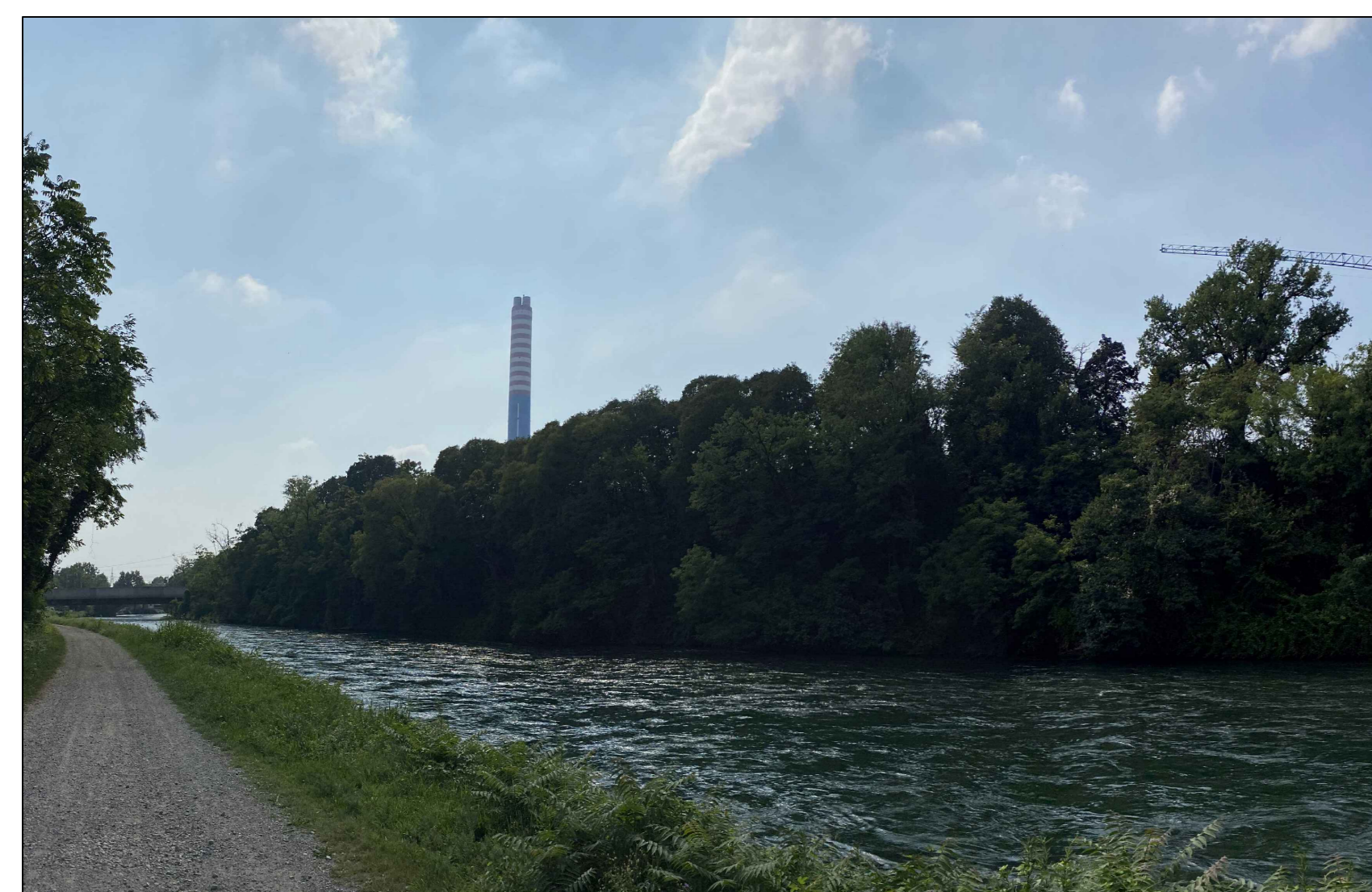
Fotoinserimento da PVC - Stato ante operam