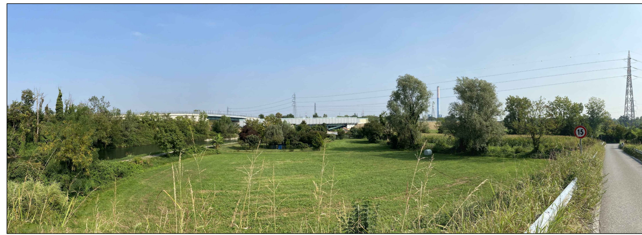
Fotoinserimento da PVA - Stato ante operam