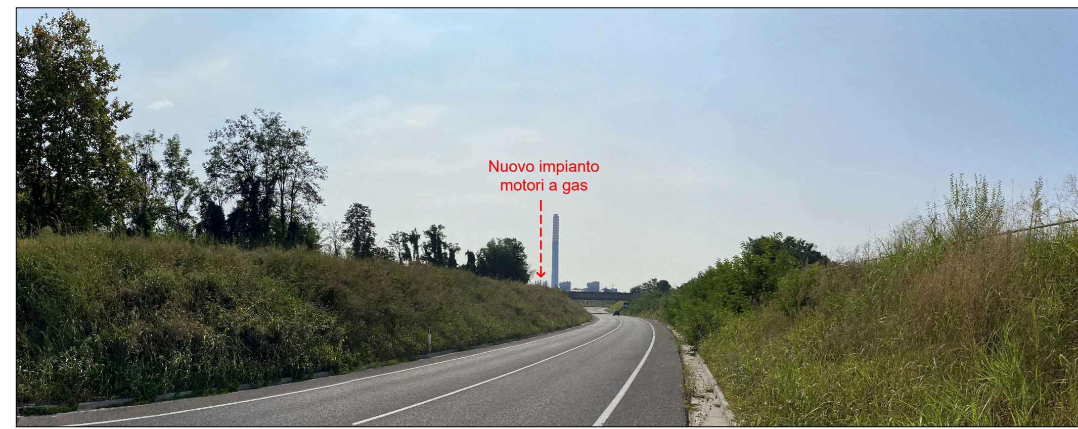
Fotoinserimento da PVM - Stato futuro con ipotesi camini azzurri