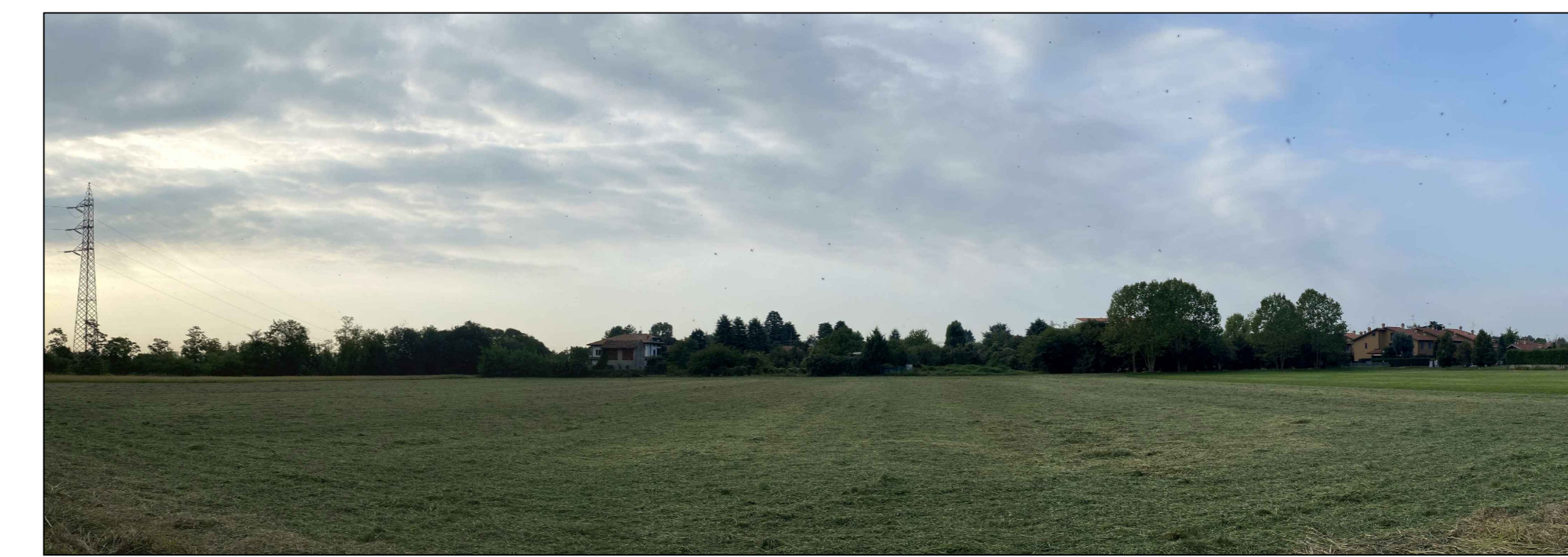
Fotoinserimento da PVN - Stato ante operam