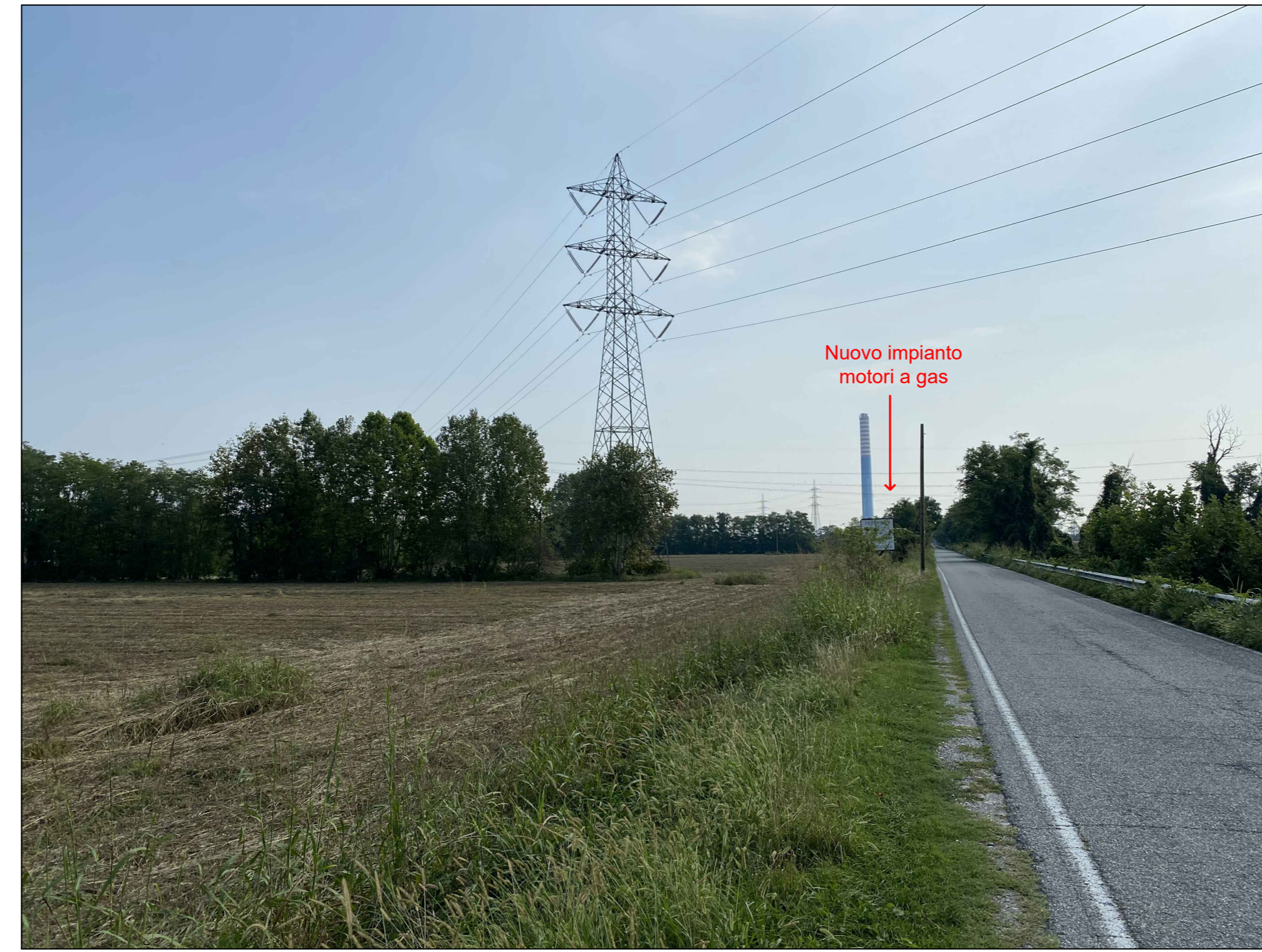
Fotoinserimento da PVL - Stato futuro