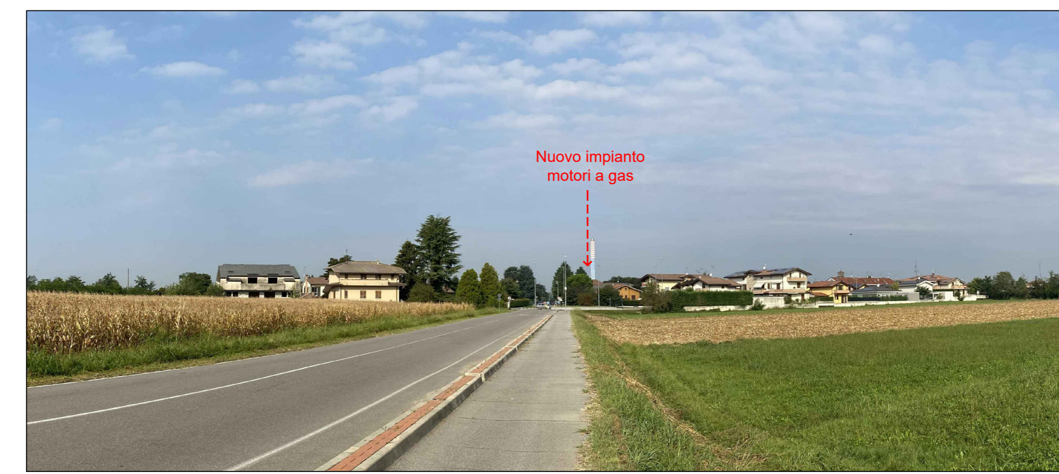
Fotoinserimento da PVO - Stato futuro