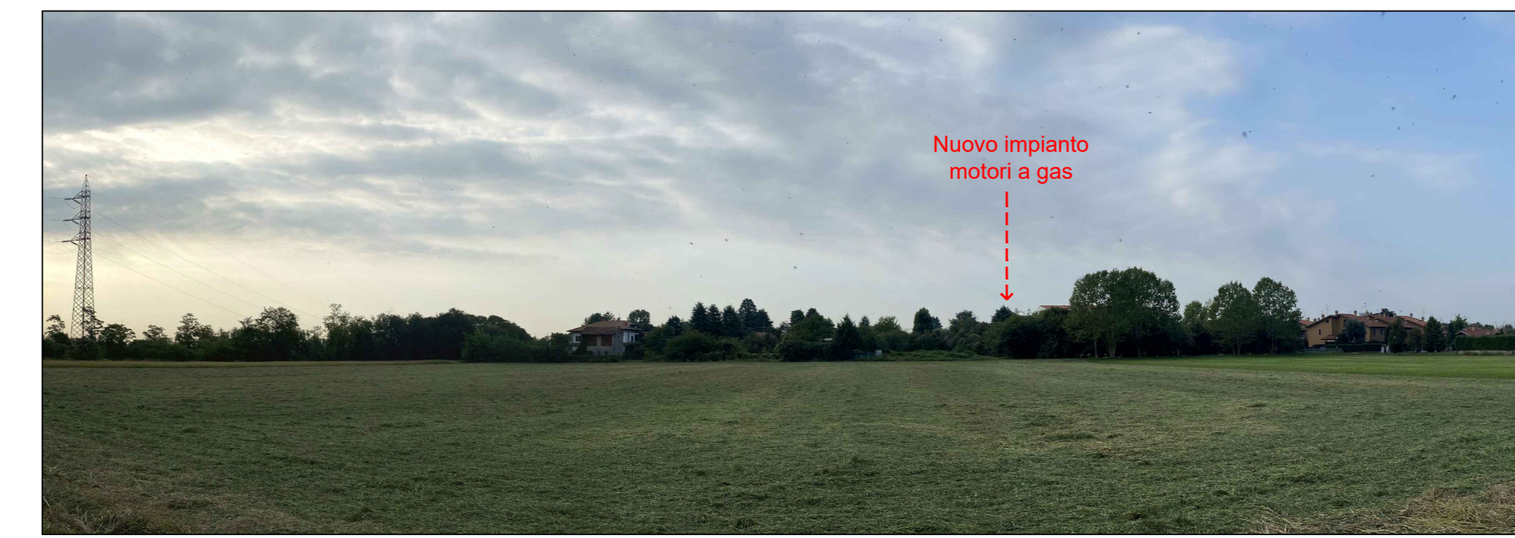
Fotoinserimento da PVN - Stato futuro