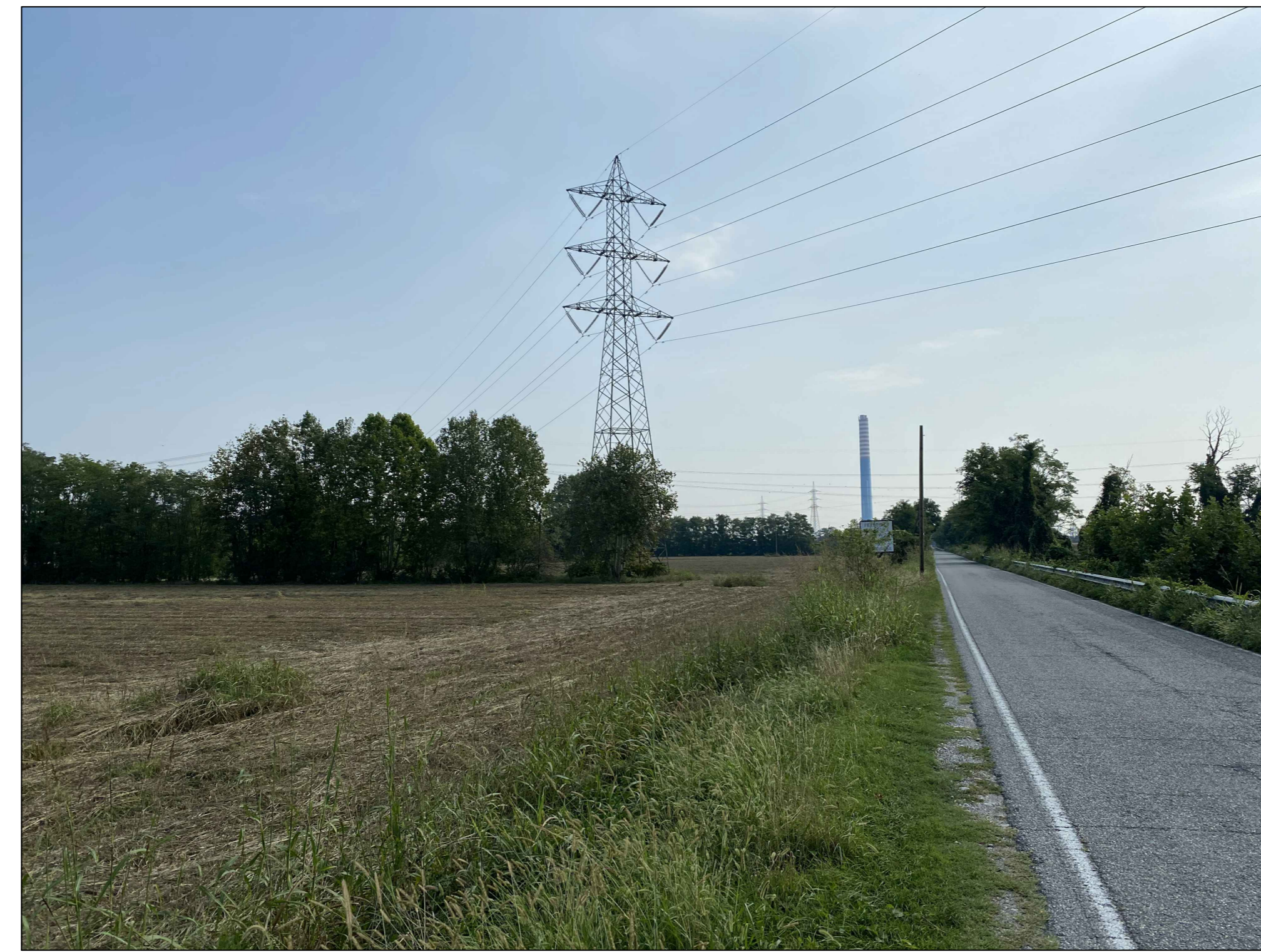
Fotoinserimento da PVL - Stato ante operam