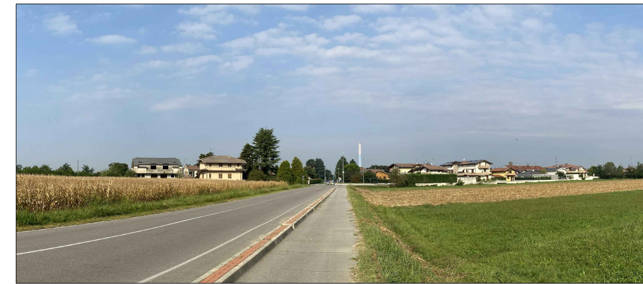
Fotoinserimento da PVO - Stato ante operam