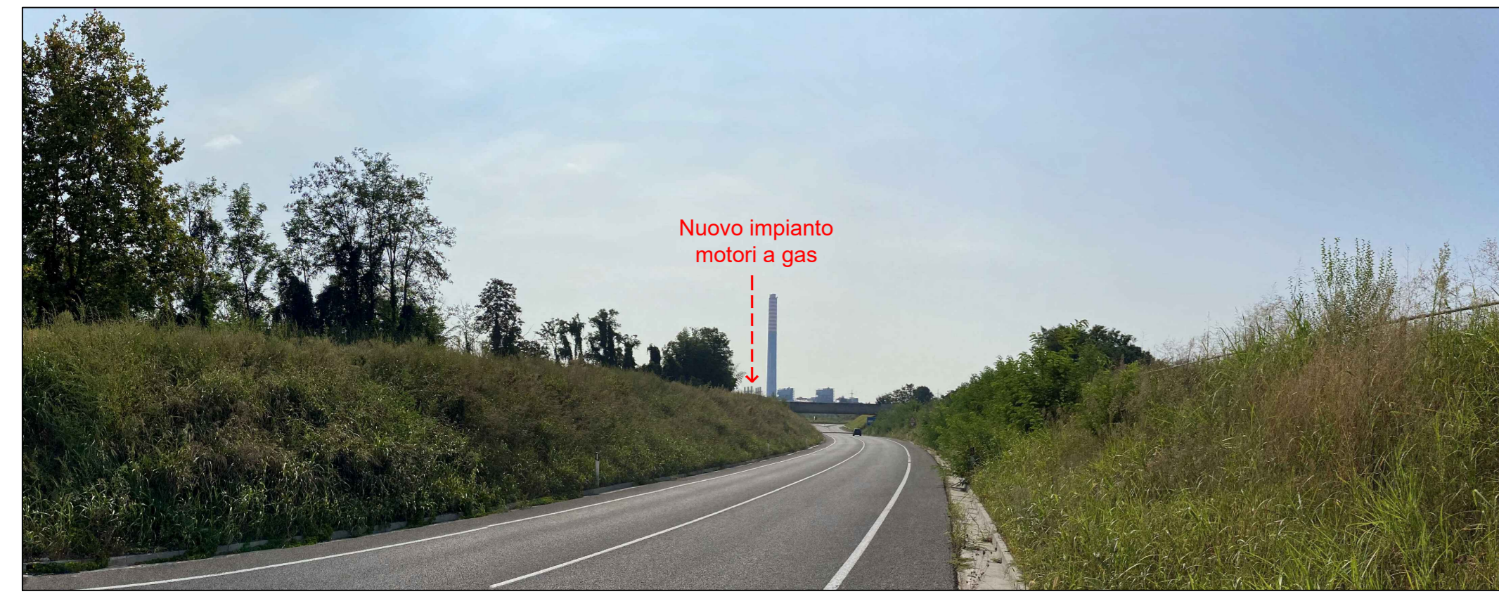
Fotoinserimento da PVM - Stato futuro con ipotesi camini grigi