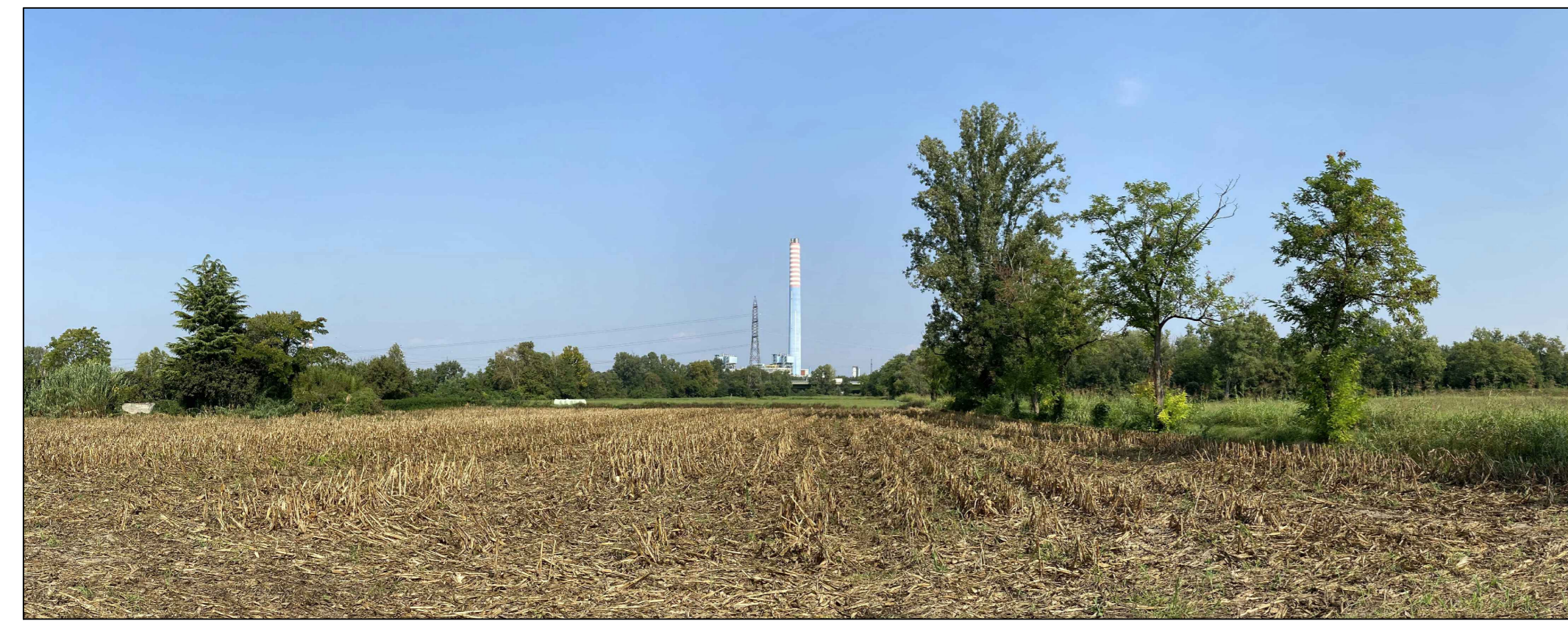
Fotoinserimento da PVK - Stato ante operam