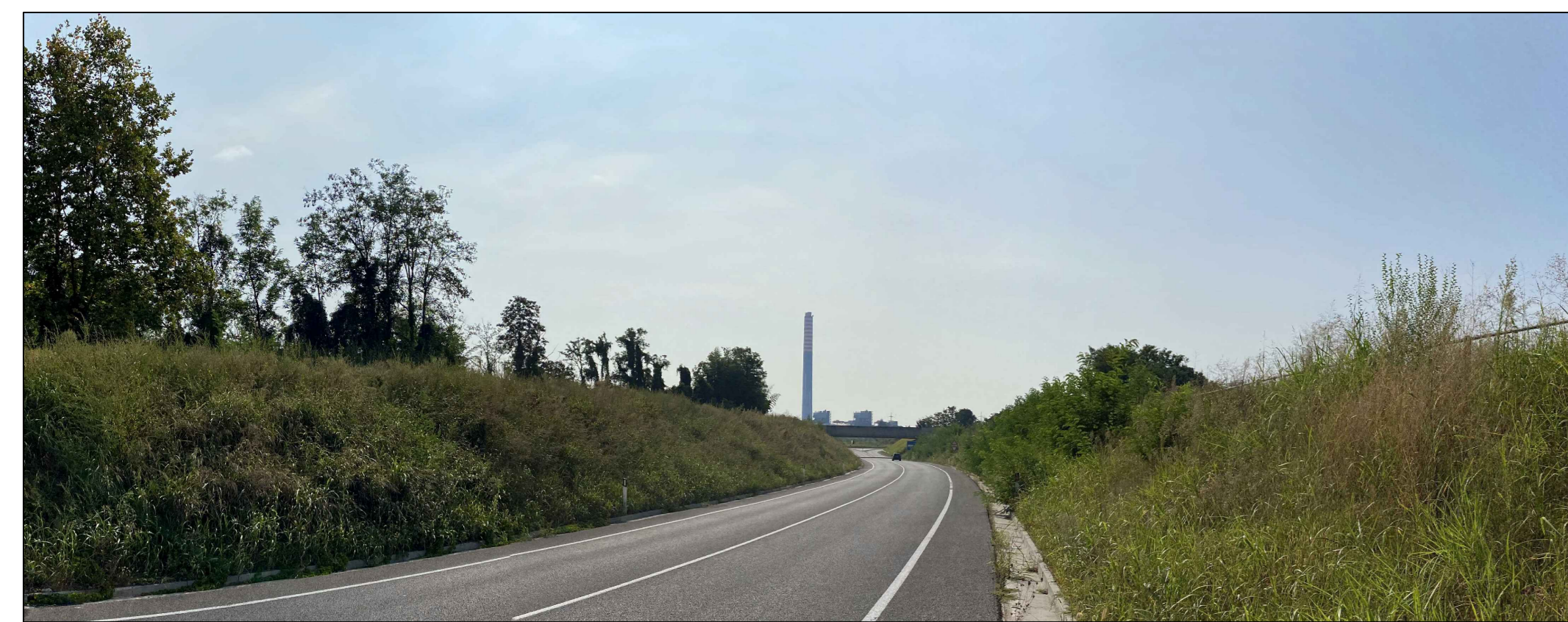
Fotoinserimento da PVM - Stato ante operam