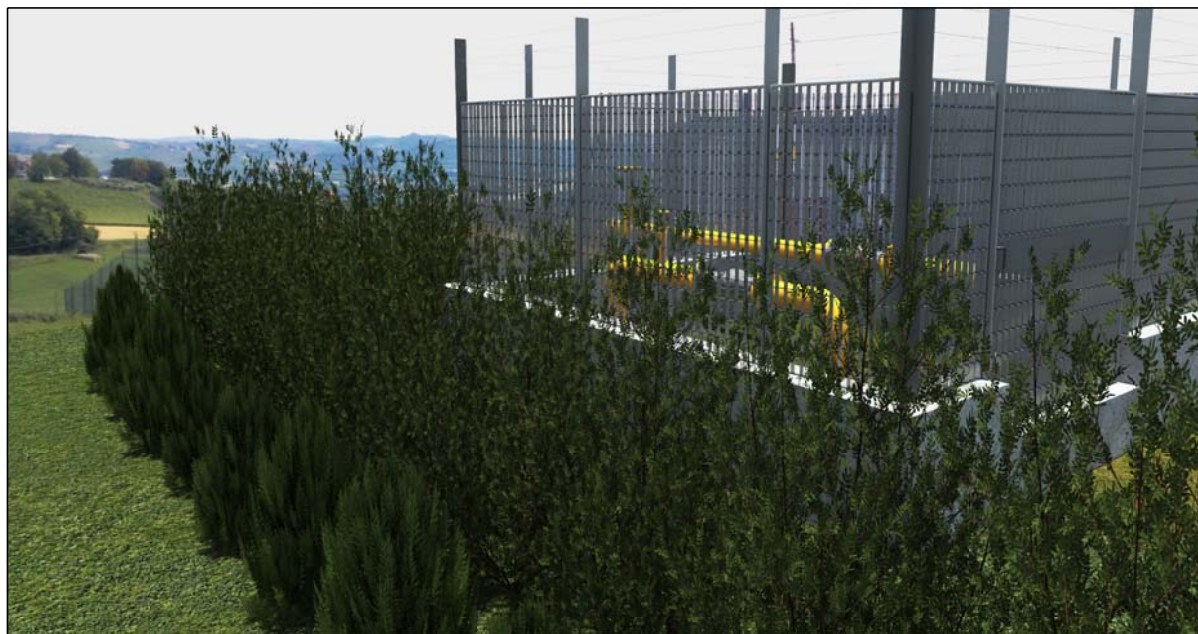
STATO FUTURO CON MITIGAZIONE A VERDE