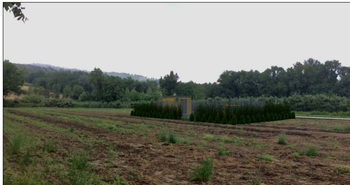
STATO FUTURO CON MITIGAZIONE A VERDE