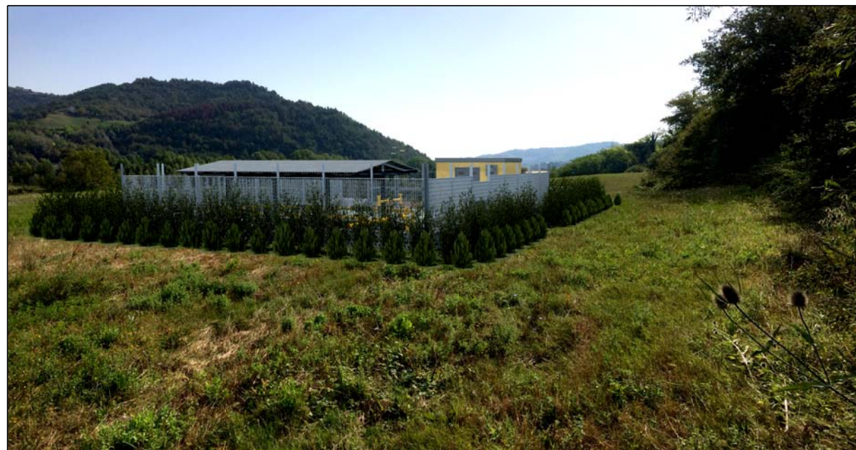
STATO FUTURO CON MITIGAZIONE A VERDE