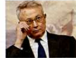
IL MINISTRO Giulio Tremonti Ministro dell'Economia

vra la partenza del nuovo meccanismo potrebbe venire anticipata di due anni, al 2013. In questo modo si cumulerebbero già da quell'anno l'aumento di tre mesi dovuto alla «speranza di vita» oltre alla cosiddetta «finestra mobile» (in vigore dal 2011) che di fatto allunga per tutti l'età pensionabile di un anno. A conti fatti, se andasse in porto l'intervento di cui si parla, nel 2013 l'età di vecchiaia (per gli uomini) sarebbe di 66 anni e tre mesi e quella di anzianità di 63 anni e tre mesi (per uomini e donne). Già nel 2020 entrambe dovrebbero salire a 67 e 64 anni.