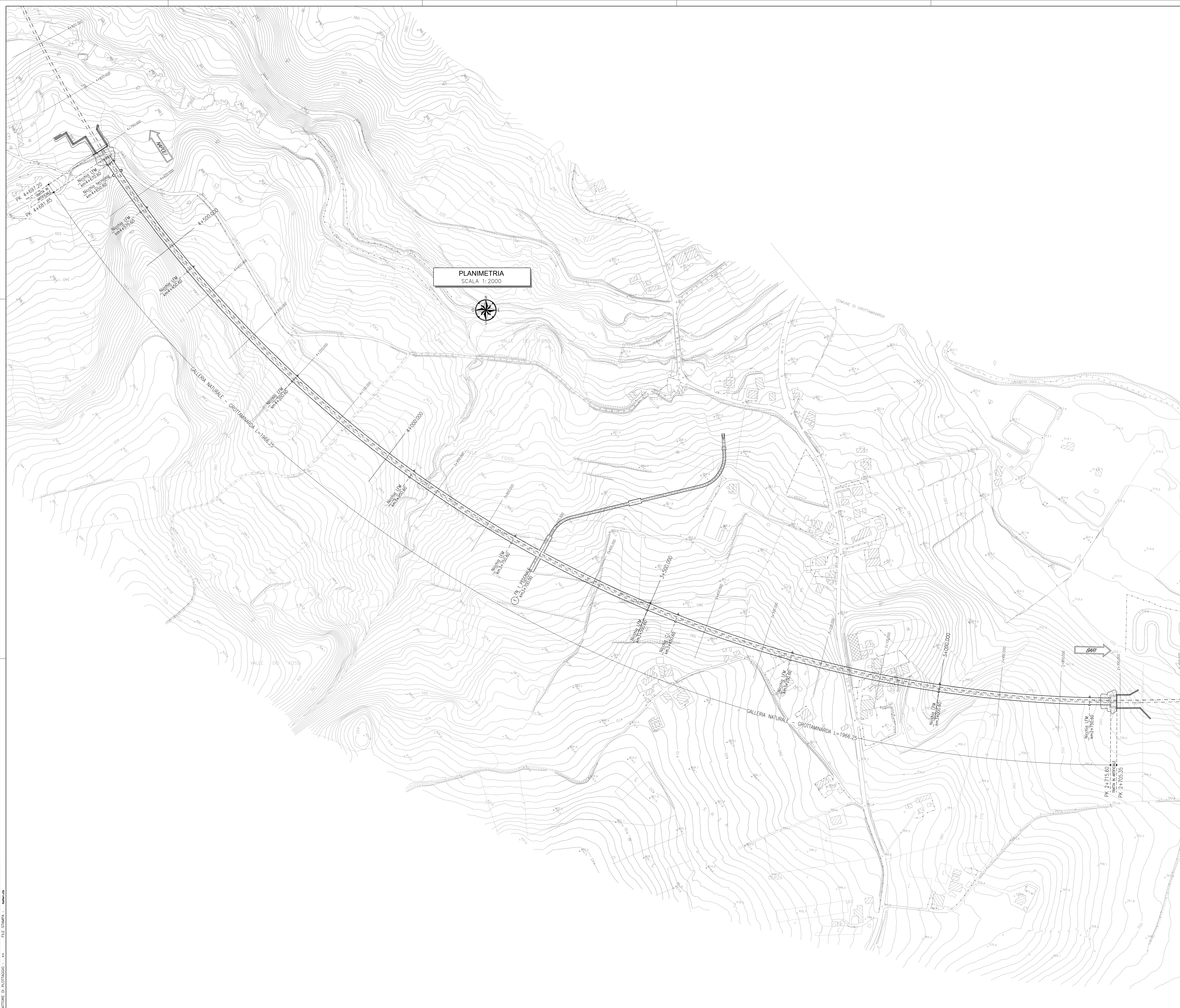
PLANIMETRIA SCALA 1:2000