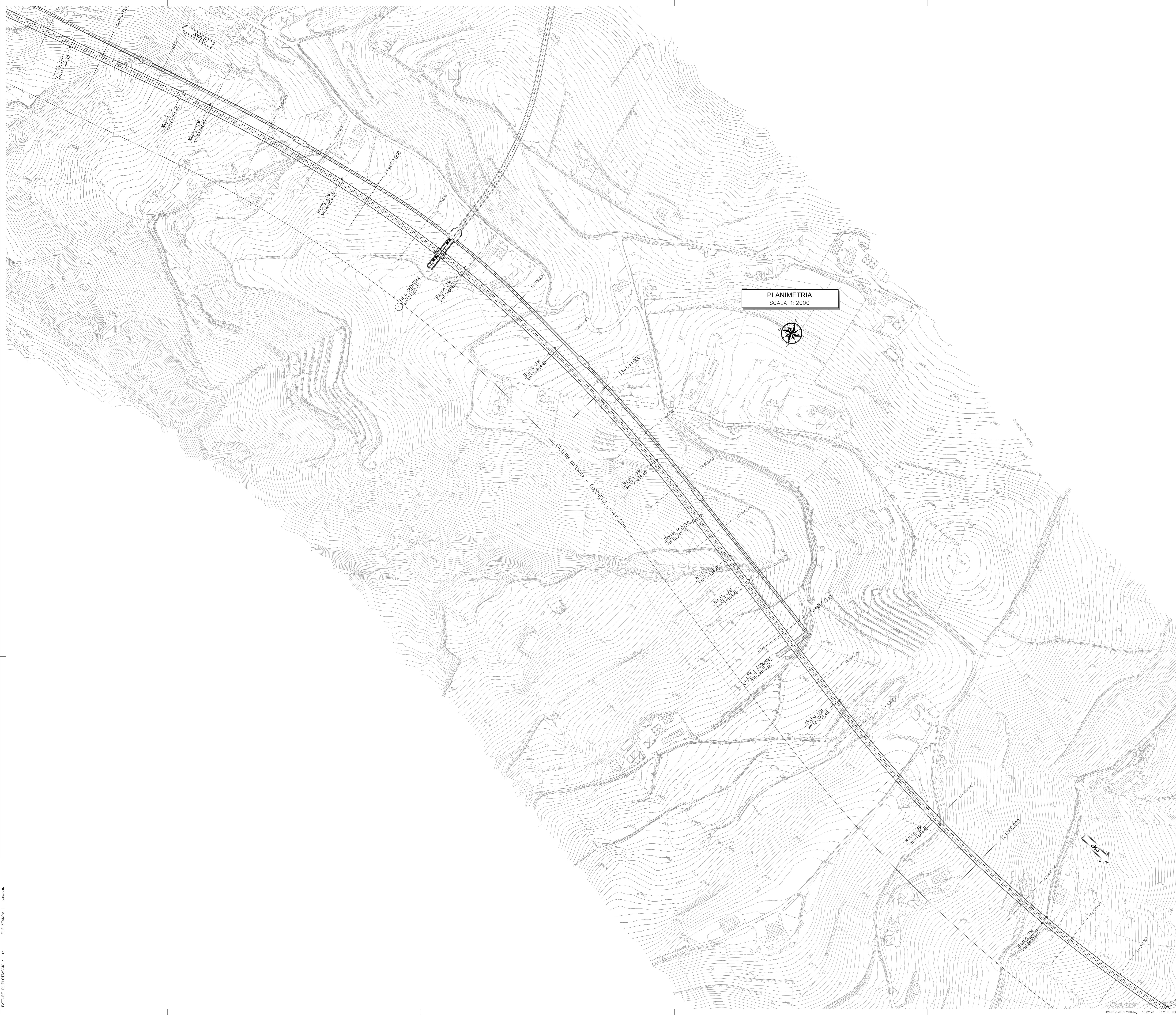
PLANIMETRIA SCALA 1:2000