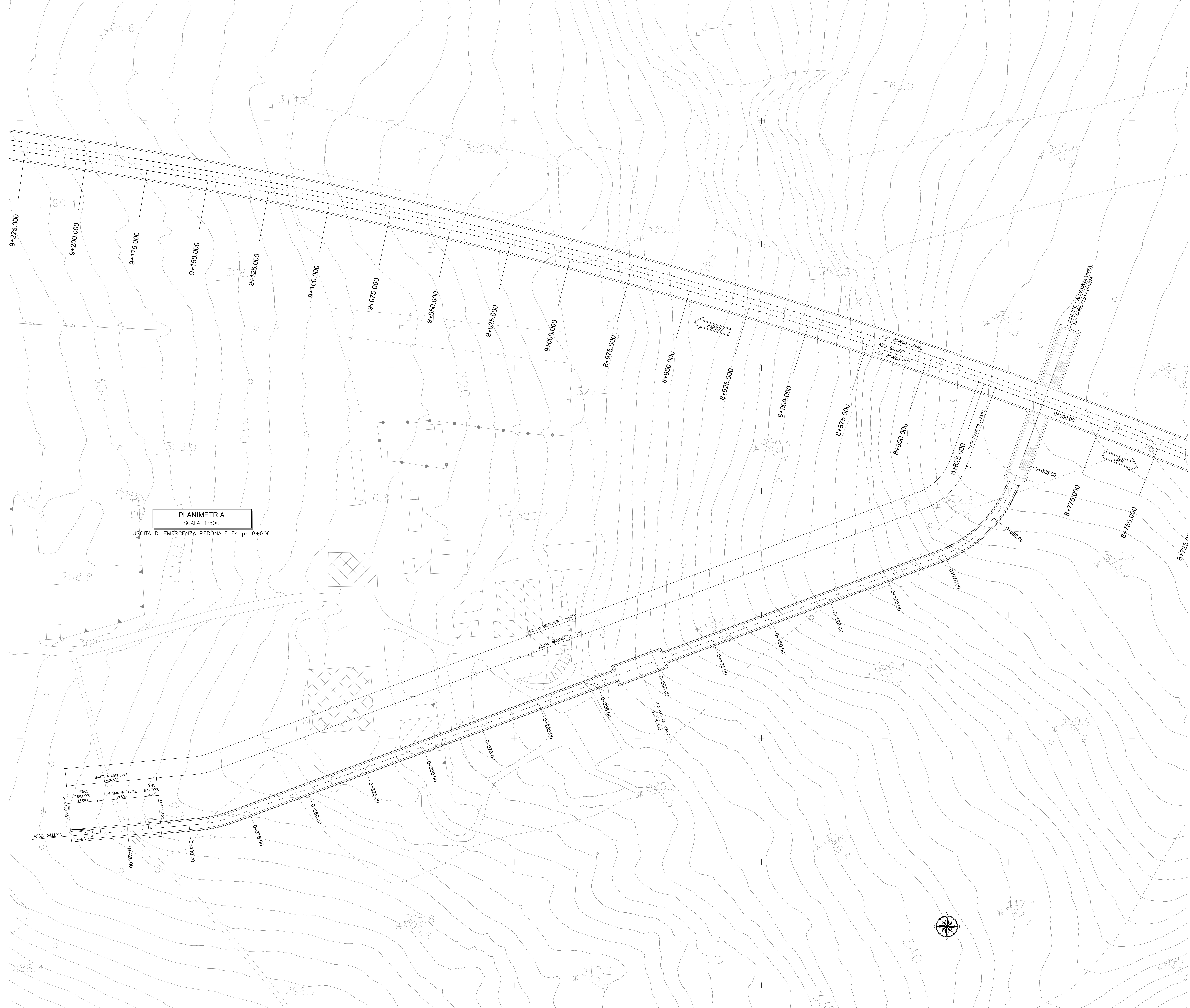
PLANIMETRIA SCALA 1:500 USCITA DI EMERGENZA PEDONALE F4 pk 8+800