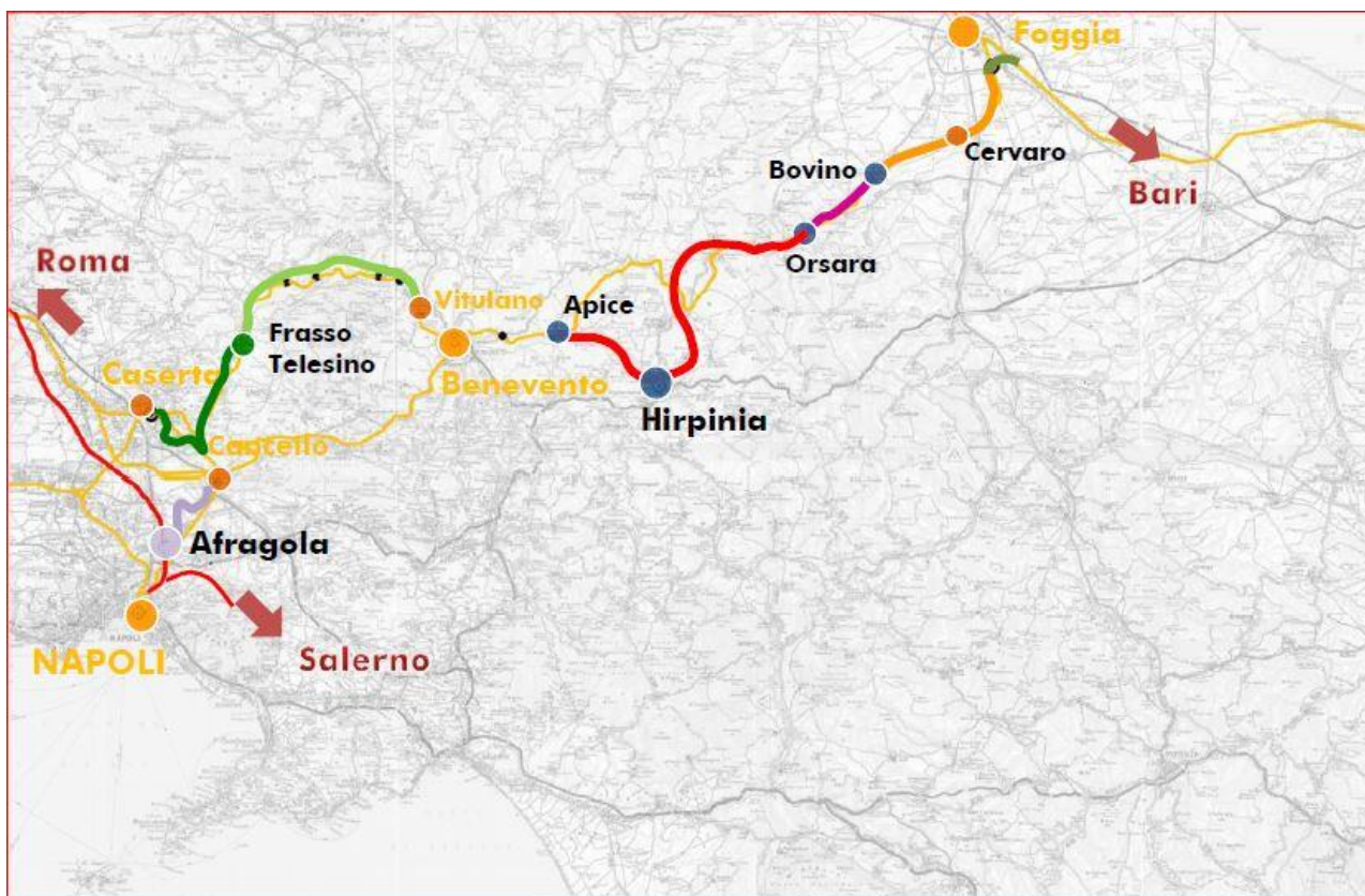
Figura 1-1. Corografia Generale Itinerario Napoli – Foggia – Bari

La riqualificazione e lo sviluppo dell'itinerario Roma/Napoli – Bari prevede interventi di raddoppio delle tratte ferroviarie a singolo binario e varianti agli attuali scenari perseguendo la scelta delle migliori soluzioni che garantiscano la velocizzazione dei collegamenti e l'aumento dell'offerta generalizzata del servizio ferroviario, elevando l'accessibilità al servizio medesimo nelle aree attraversate.