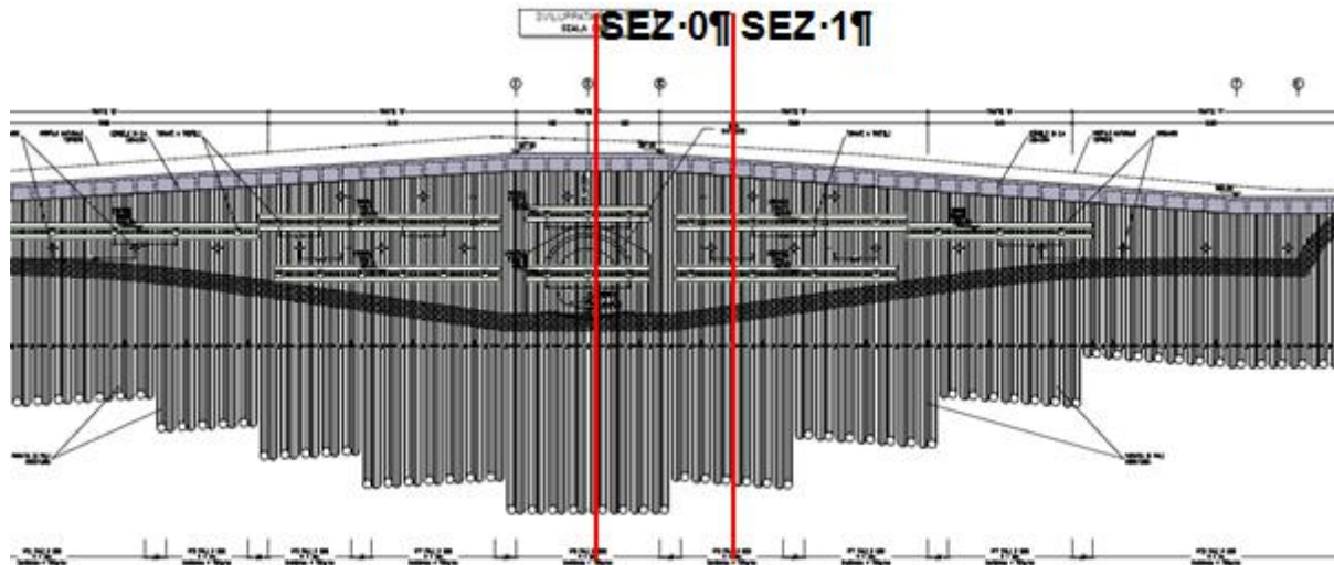
Figura 3-3. Sezioni di calcolo