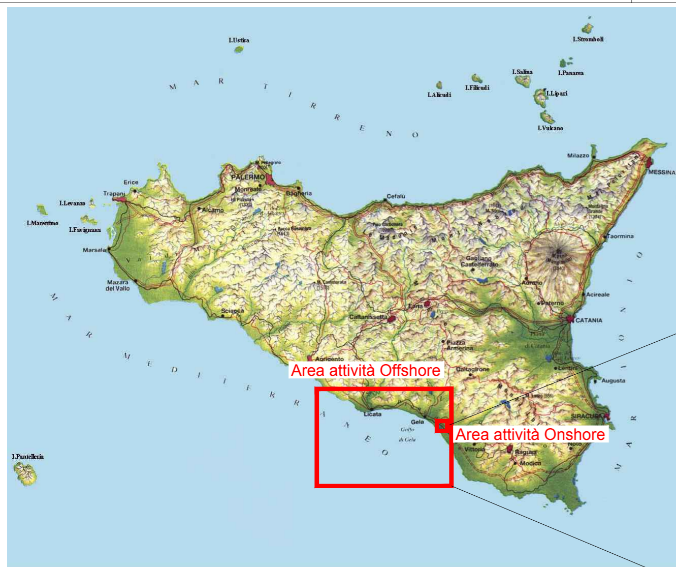
Figura non in scala