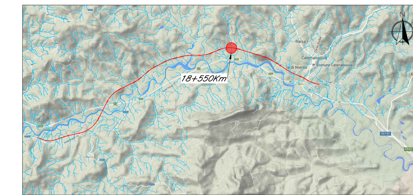
Linea Ferroviaria di progetto