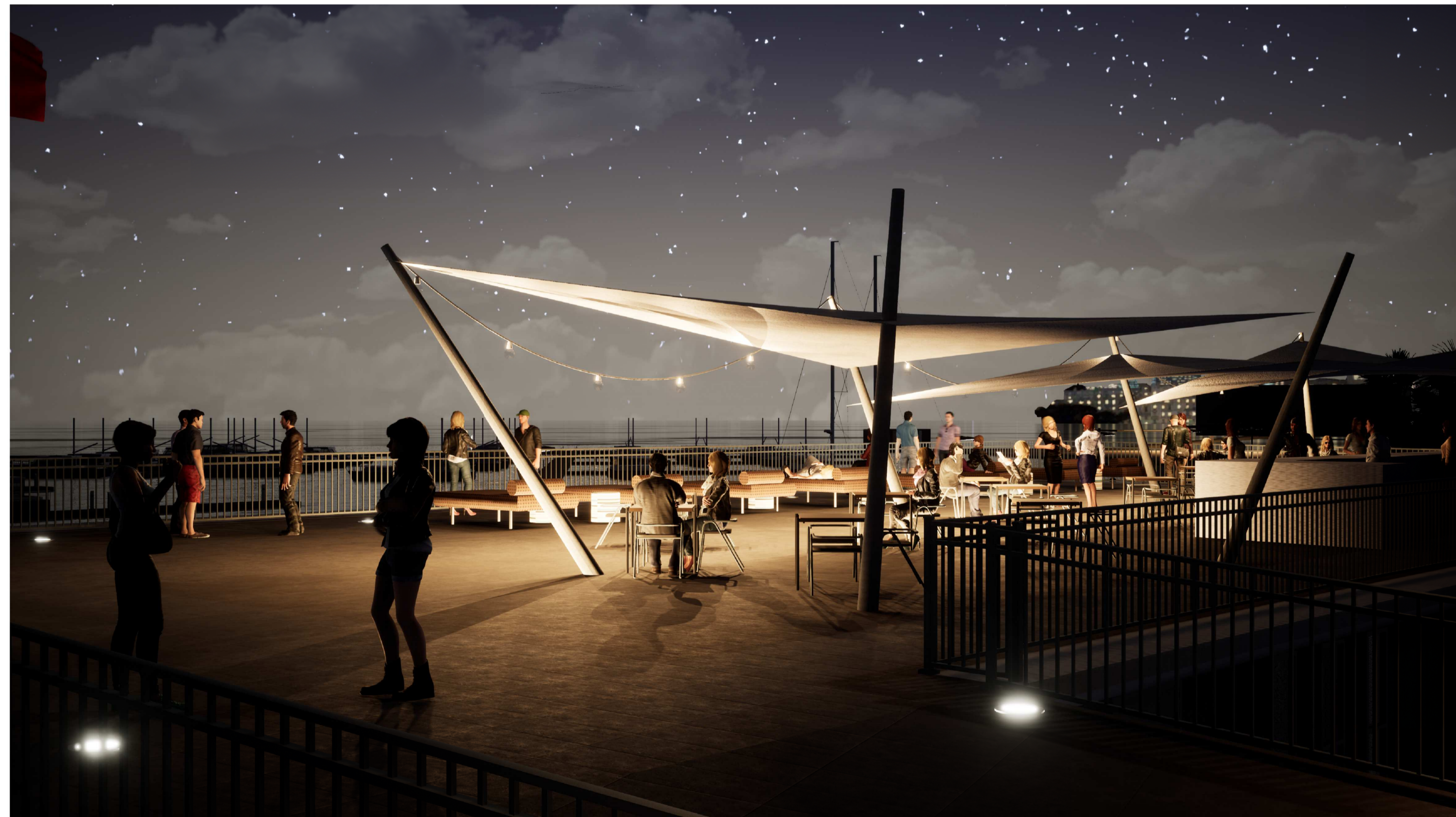
PORTO DI CATANZARO - VISTA GENERALE 4