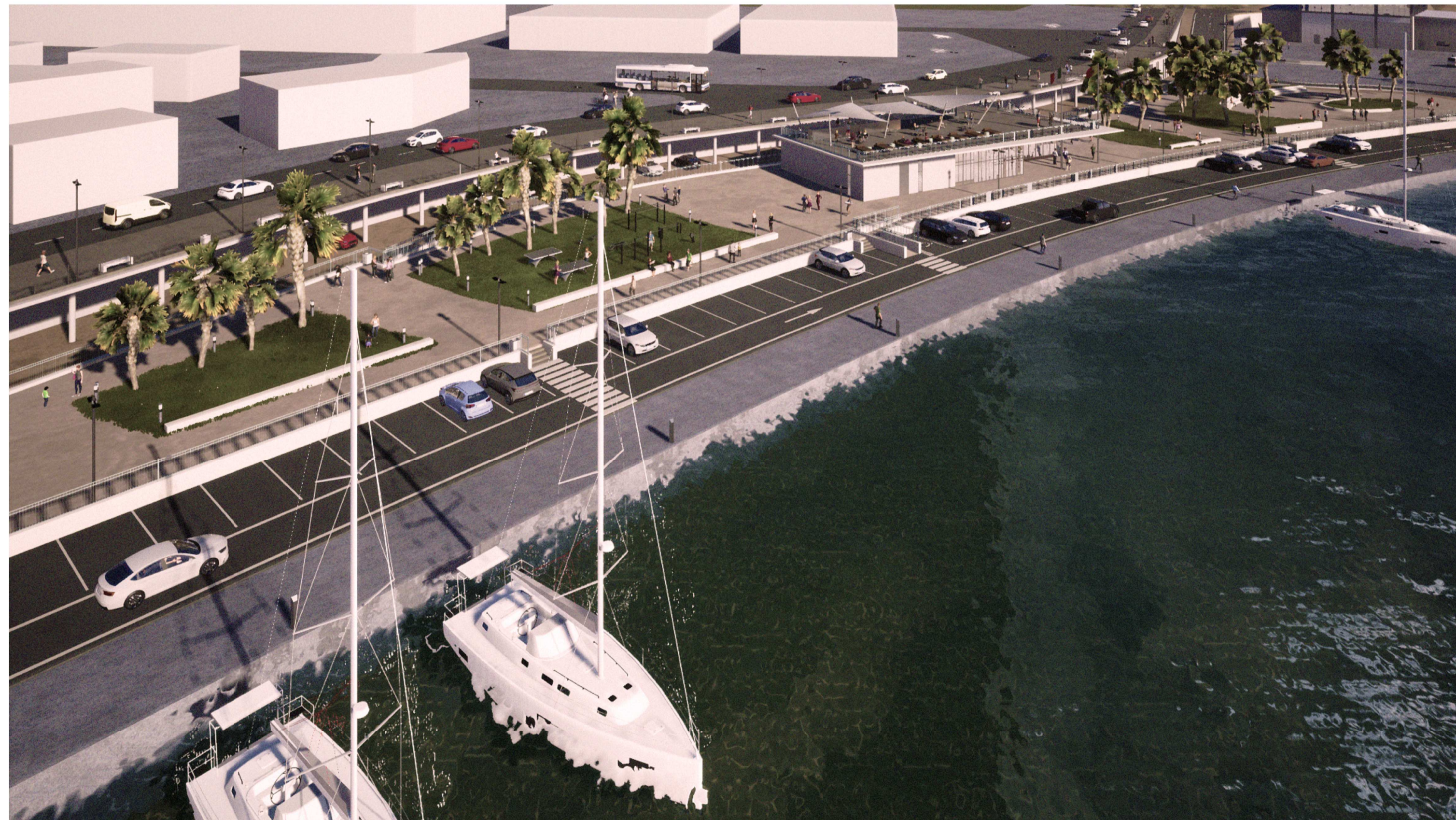
PORTO DI CATANZARO - VISTA GENERALE 3