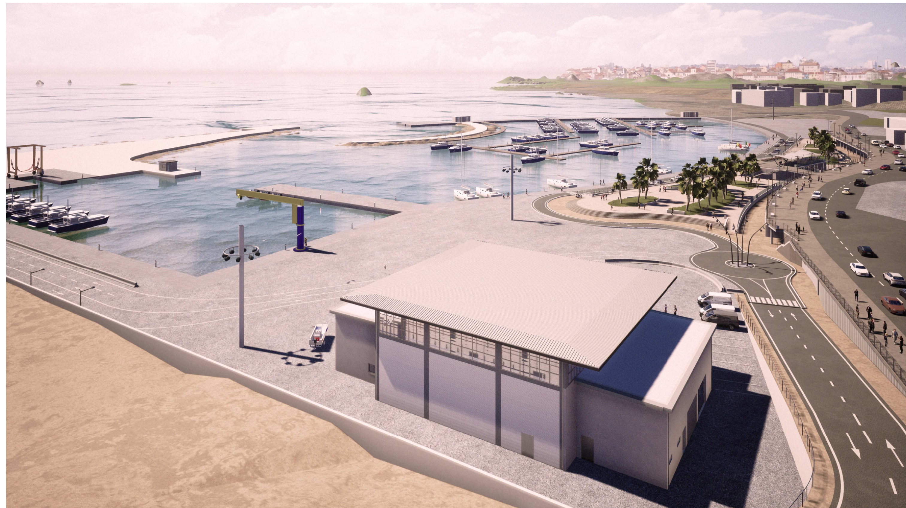
PORTO DI CATANZARO - VISTA GENERALE 2