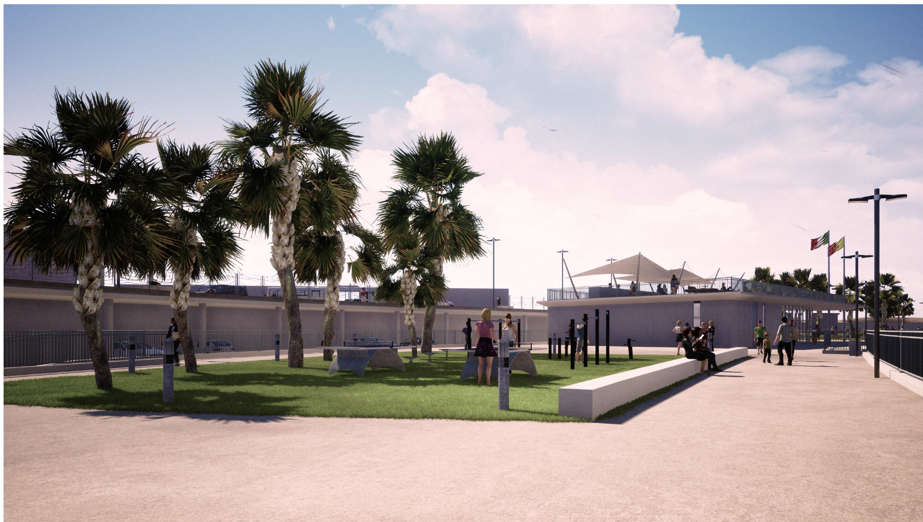
PORTO DI CATANZARO - VISTA 2