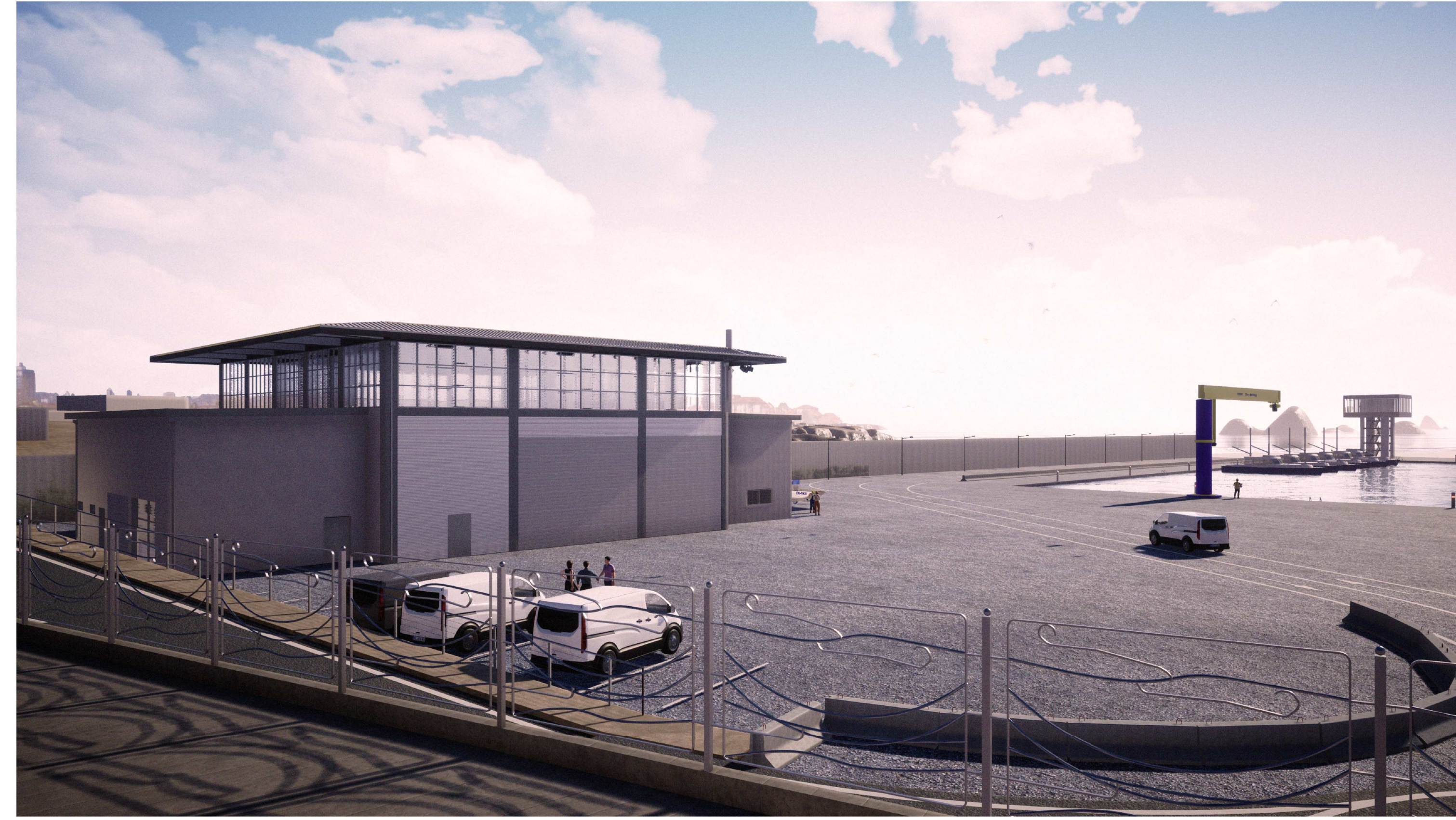
PORTO DI CATANZARO - VISTA 6