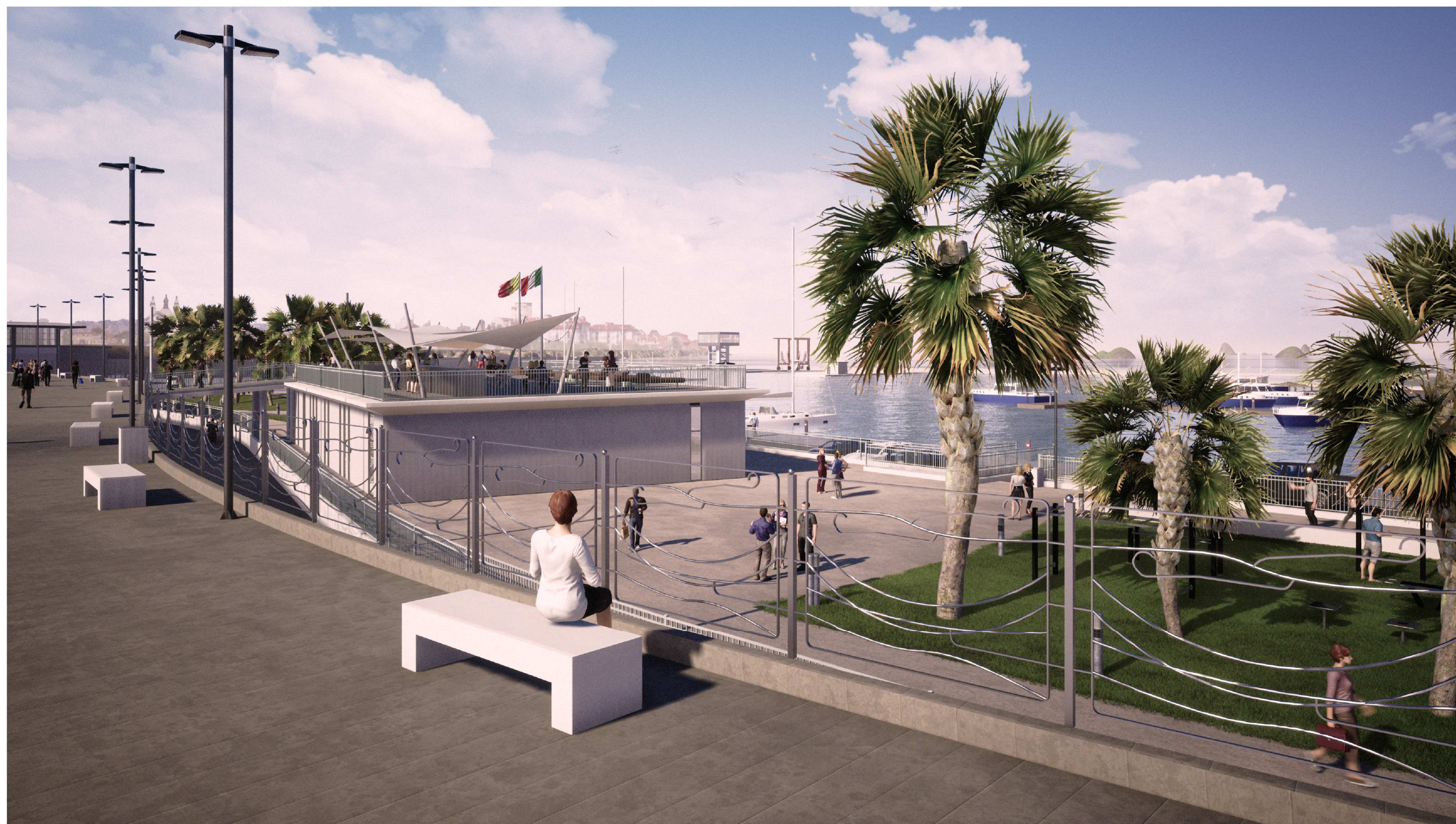
PORTO DI CATANZARO - VISTA 1