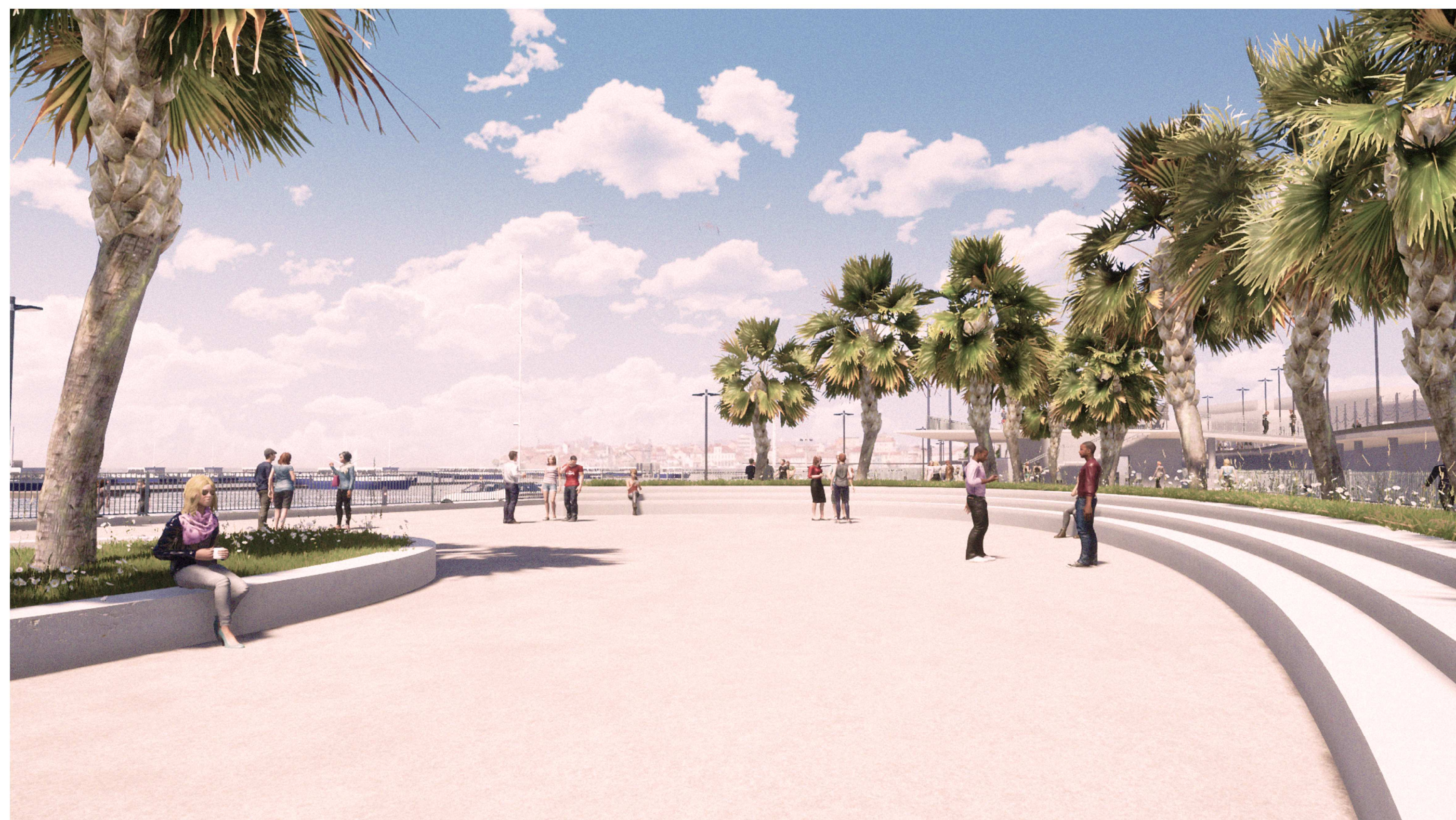
PORTO DI CATANZARO - VISTA 4