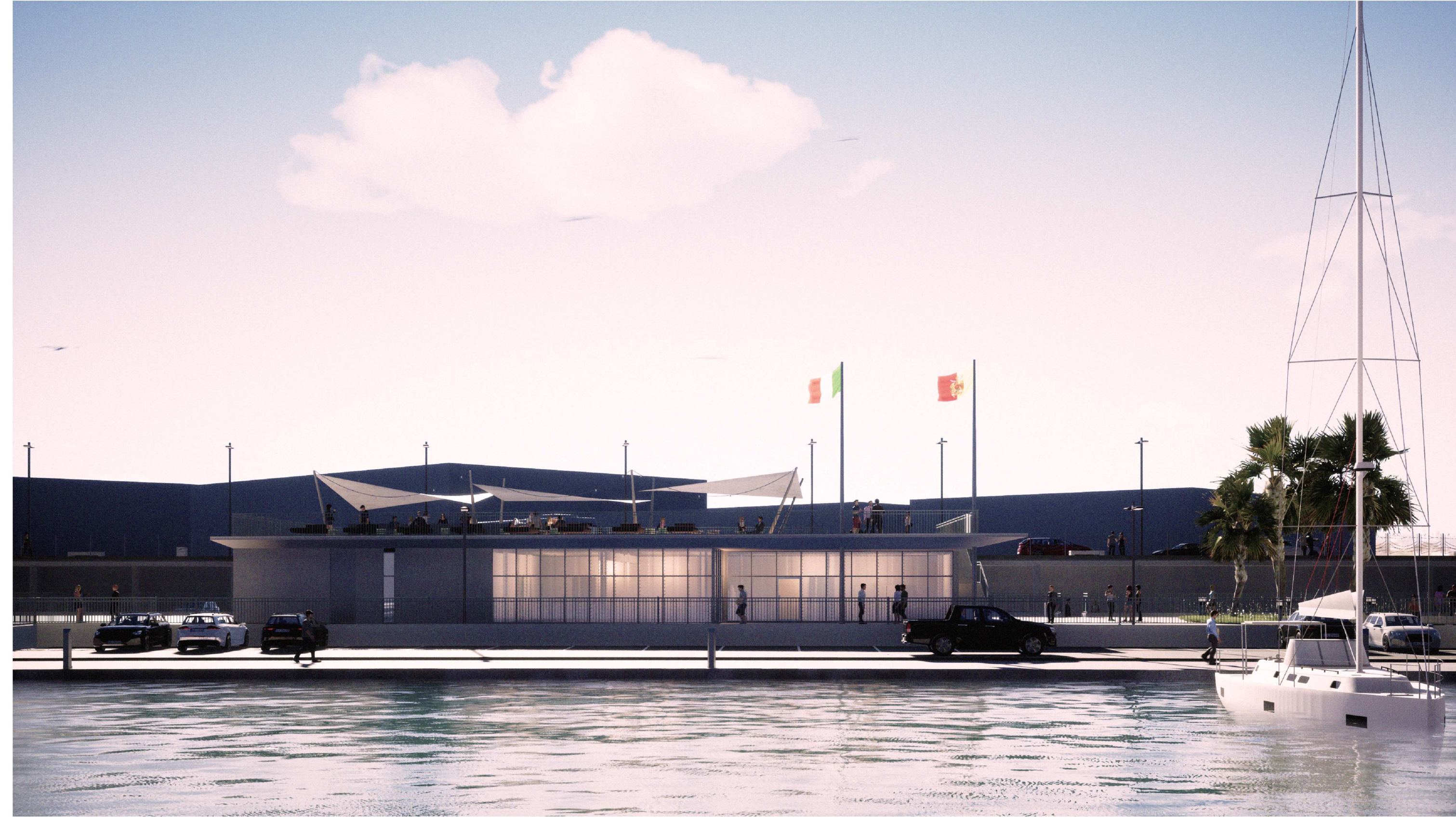
PORTO DI CATANZARO - VISTA 5