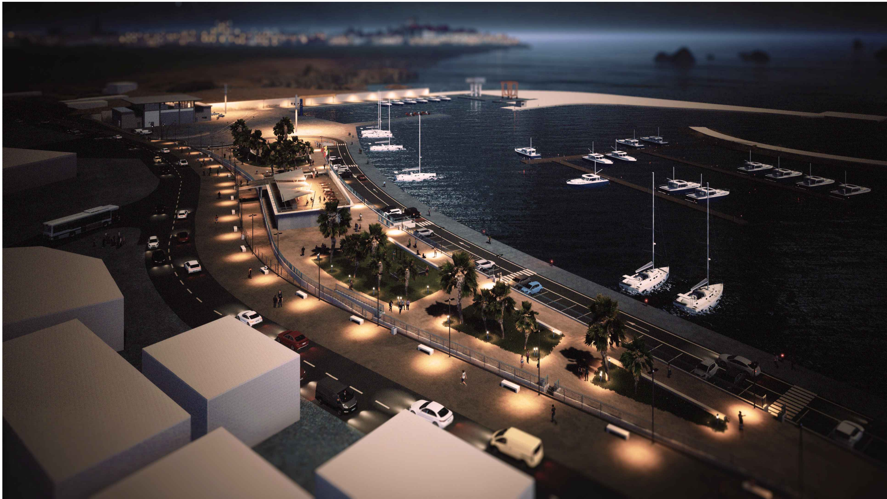
PORTO DI CATANZARO - VISTA GENERALE 1