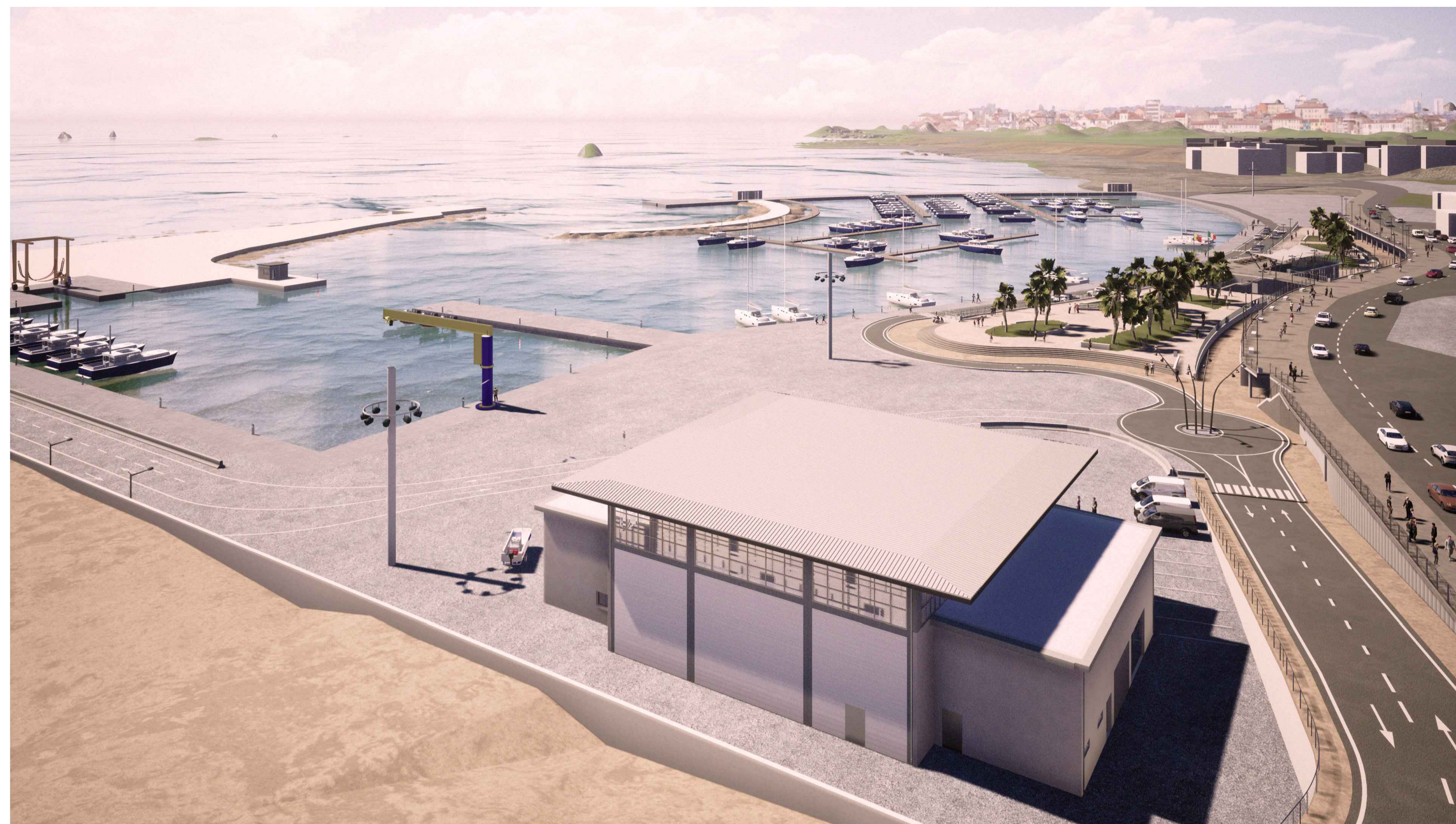
PORTO DI CATANZARO - VISTA GENERALE 2