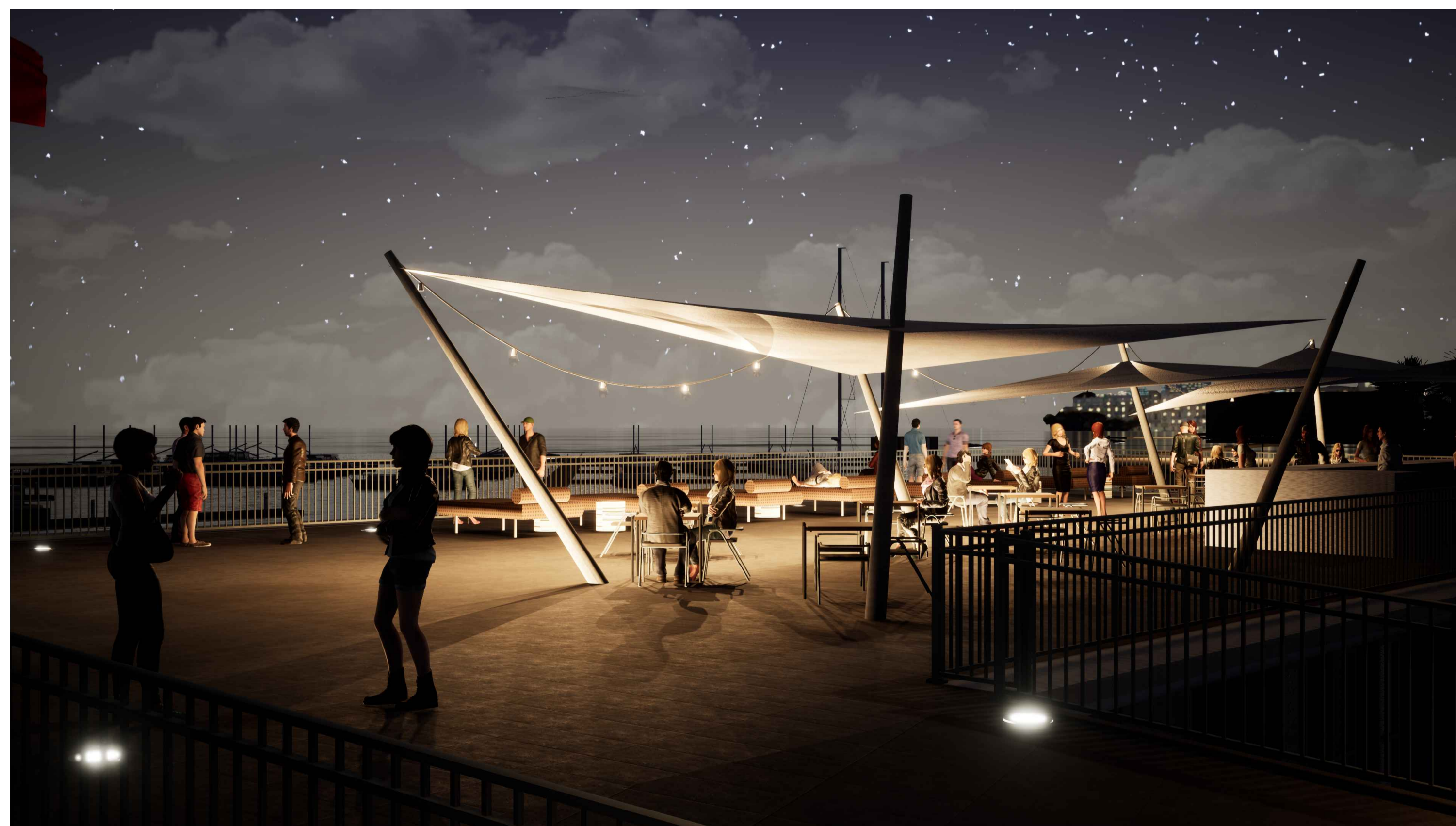
PORTO DI CATANZARO - VISTA GENERALE 4