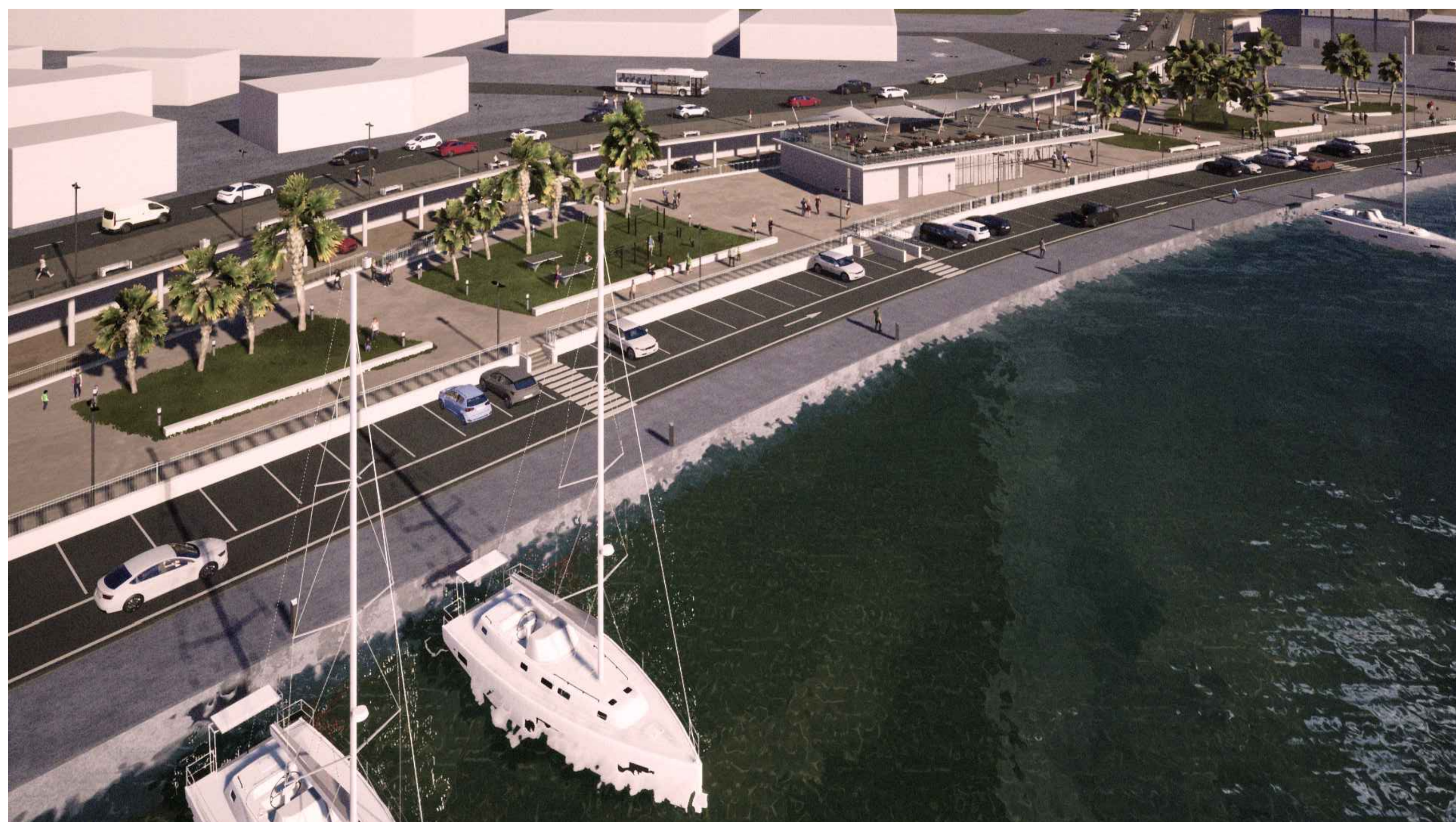
PORTO DI CATANZARO - VISTA GENERALE 3