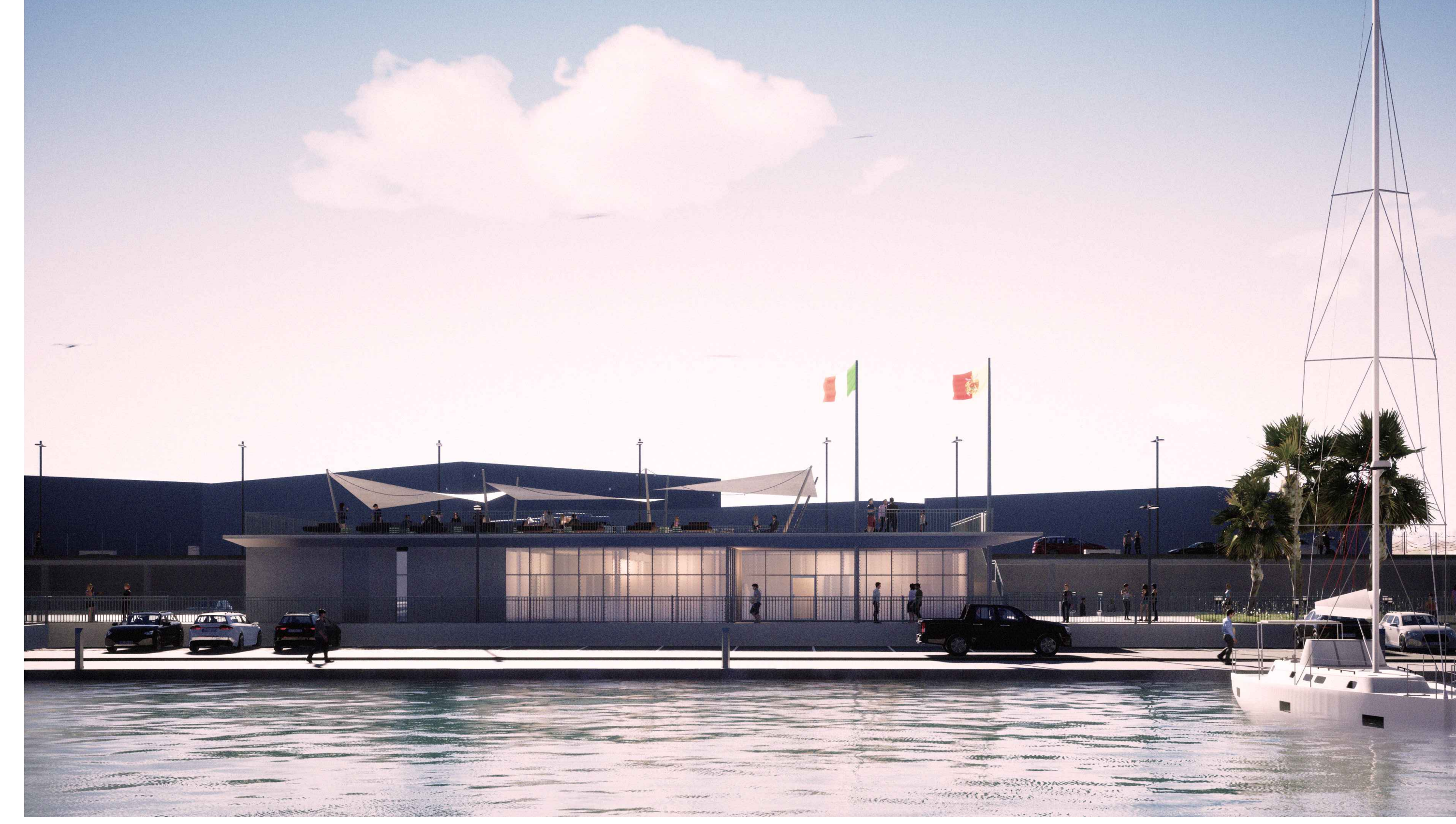
PORTO DI CATANZARO - VISTA 5