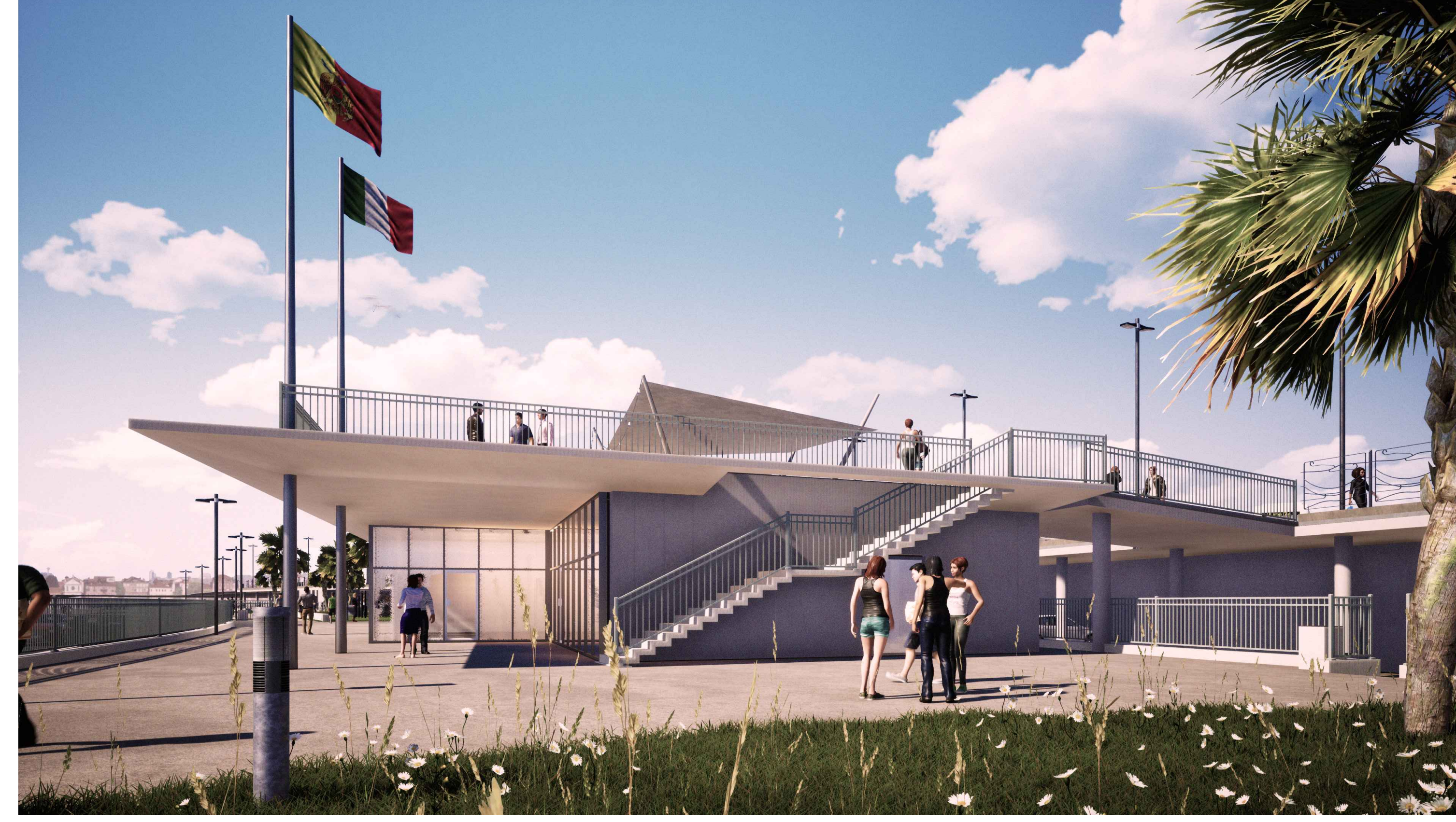
PORTO DI CATANZARO - VISTA 3