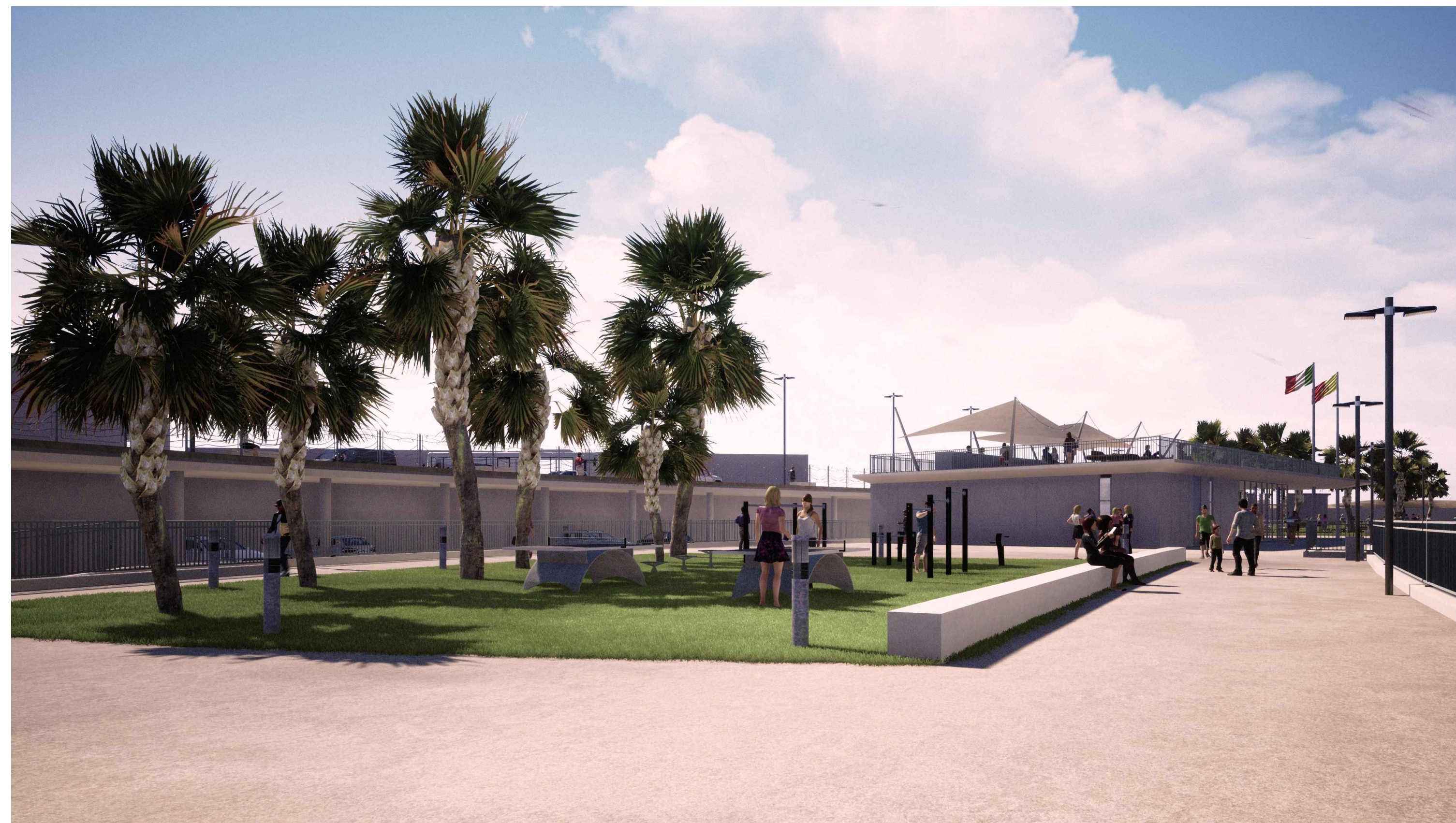
PORTO DI CATANZARO - VISTA 2