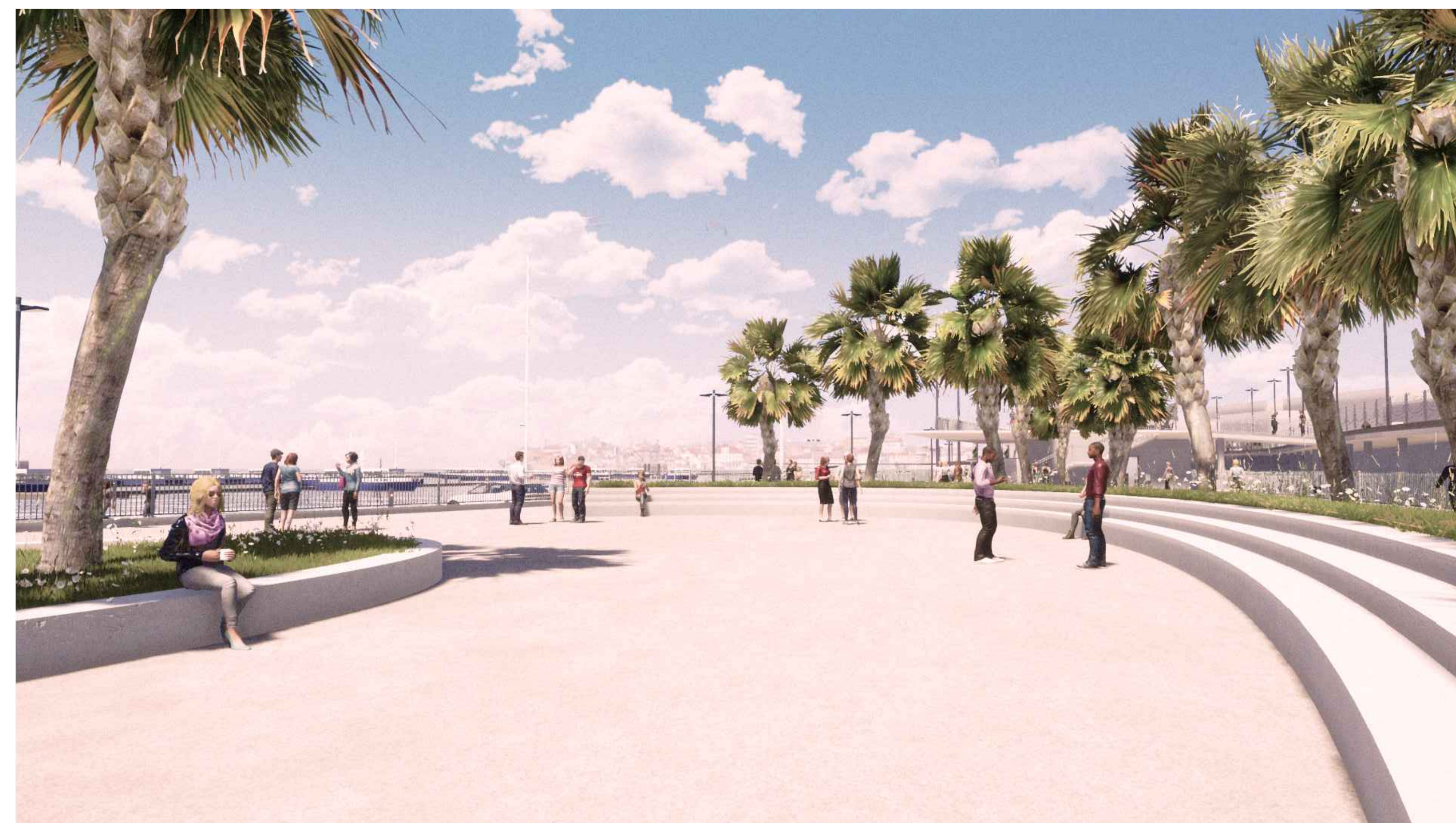
PORTO DI CATANZARO - VISTA 4