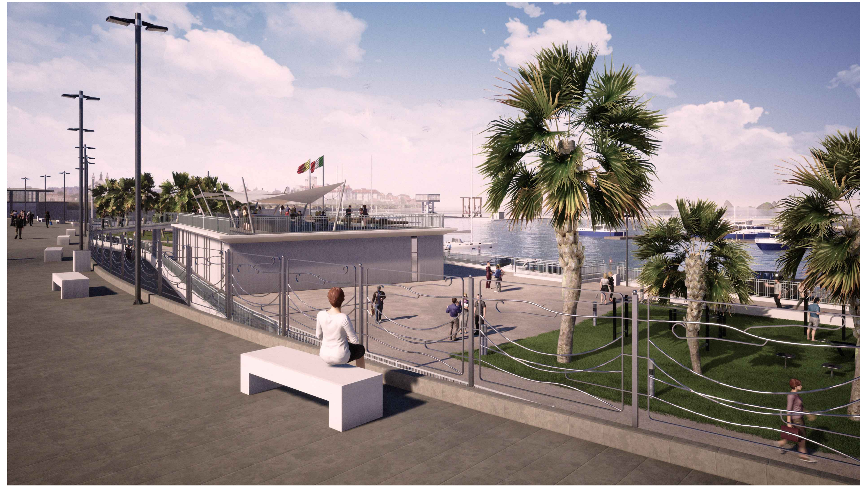
PORTO DI CATANZARO - VISTA 1