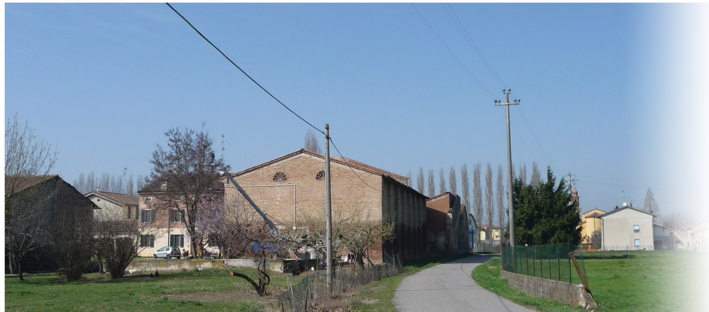
AMBITO INSEDIATIVO STORICO