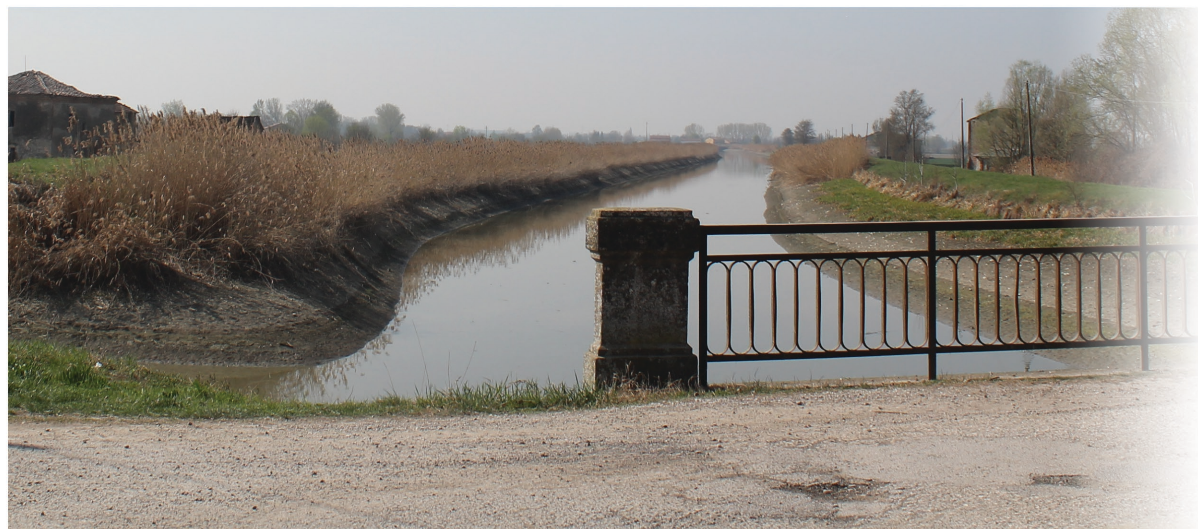
AMBITO FLUVIALE NATURALE