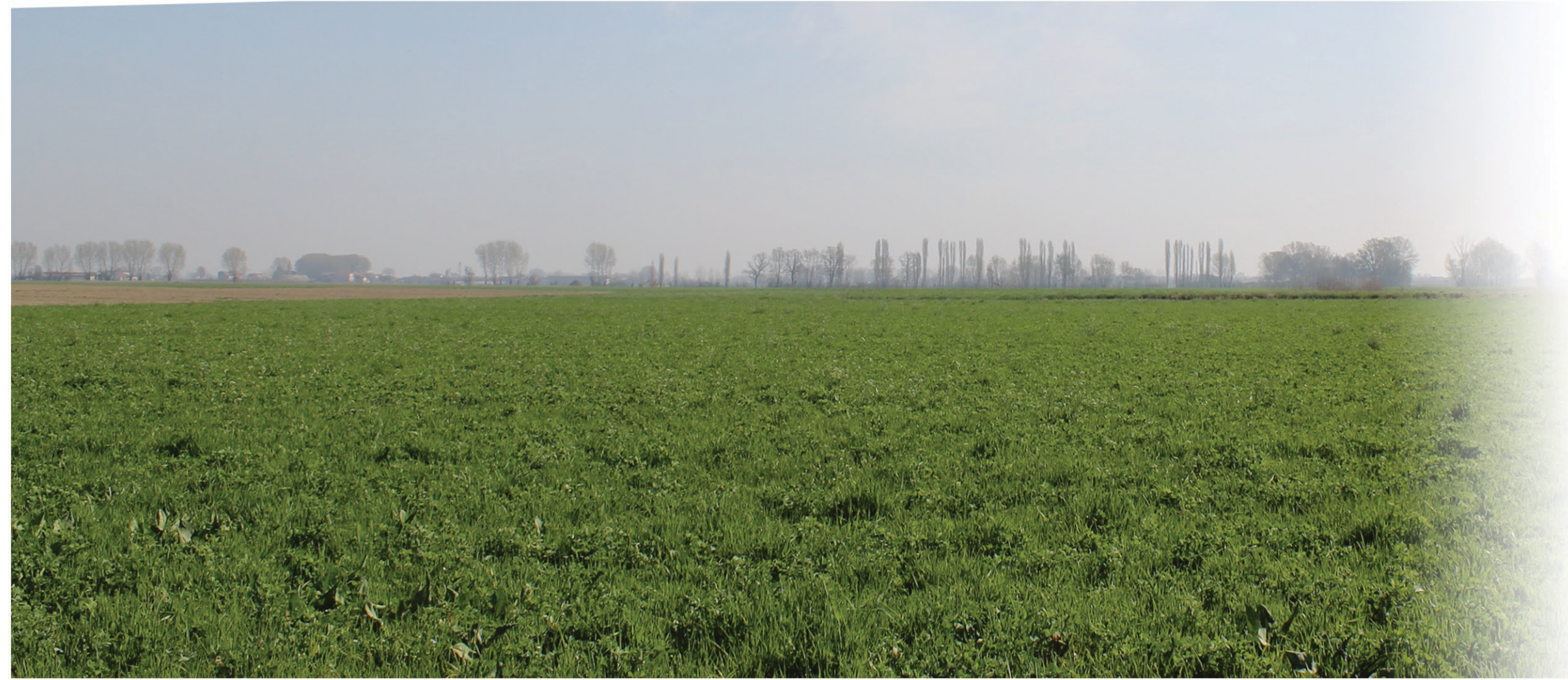
AMBITO AGRICOLO RURALE