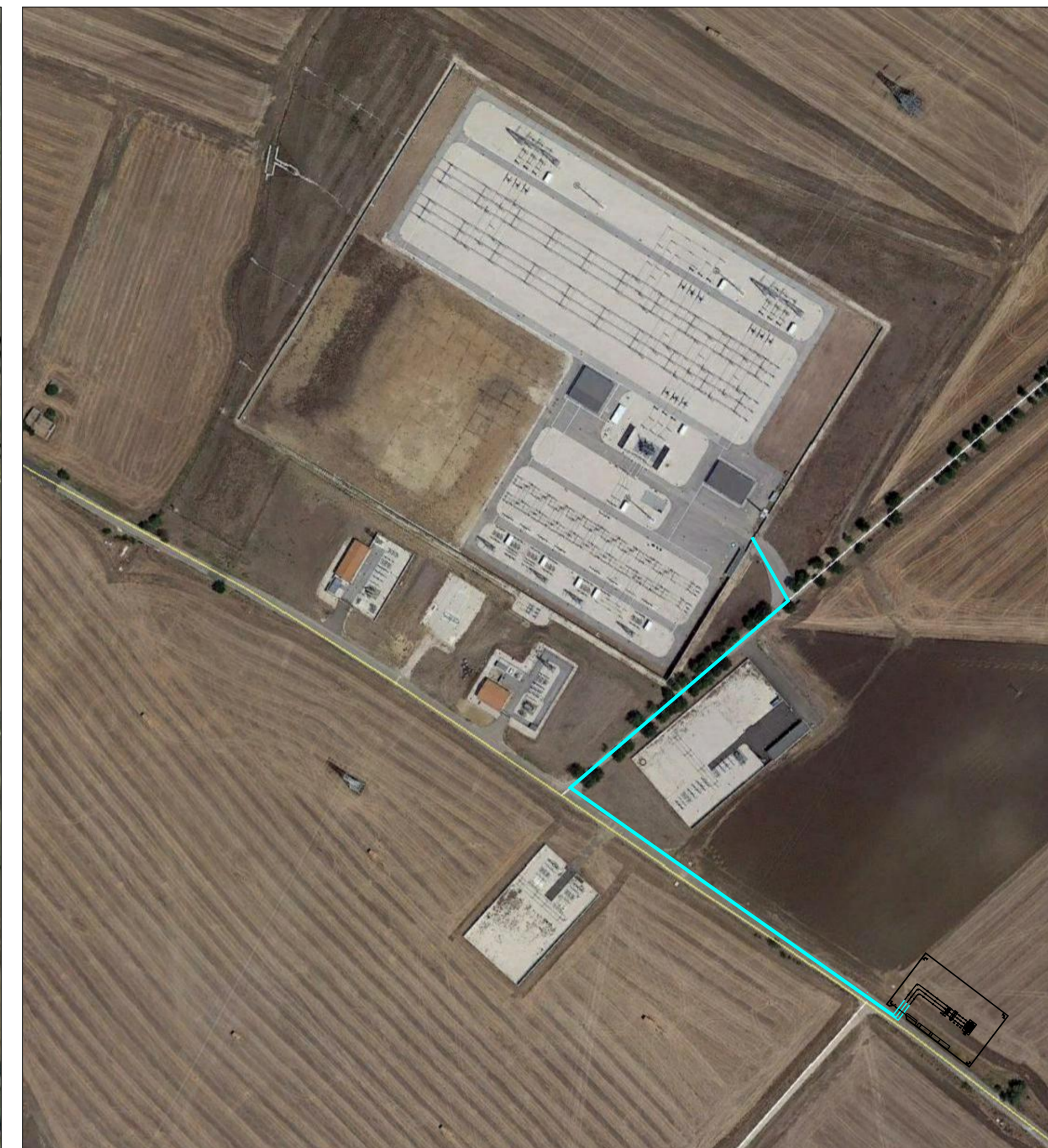
SOVRAPPOSIZIONE SU AEROFOTO