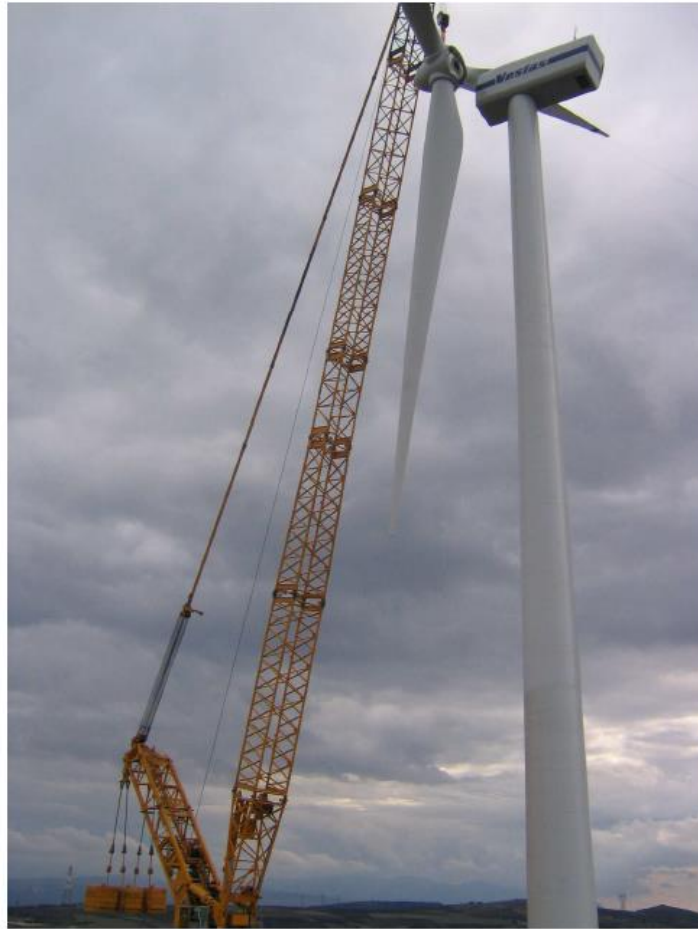
Figura 4 : Fase di montaggio dell'aerogeneratore

Lo scavo delle fondazioni degli aerogeneratori, che interesseranno strati profondi di terreno, darà infatti luogo alla generazione di materiale di risulta che in parte potrà esser utilizzato in loco per la risistemazione agricola e in parte minore, previa eventuale frantumazione meccanica, potrà diventare, se le caratteristiche geomeccaniche lo consentiranno, materiale di sufficiente qualità per la costruzione di strade e piazzole.