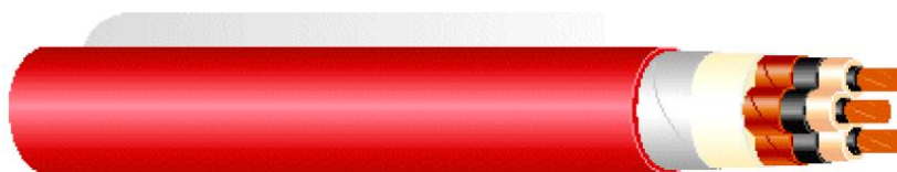
Figura 5 : Tipico del cavo in MT

Nel caso in esame, essendo previsti modesti tempi per l'allaccio dell'impianto alla rete, è conveniente accelerare per quanto possibile l'installazione di macchine ed apparecchiature elettriche. Si sceglierà la seconda soluzione.