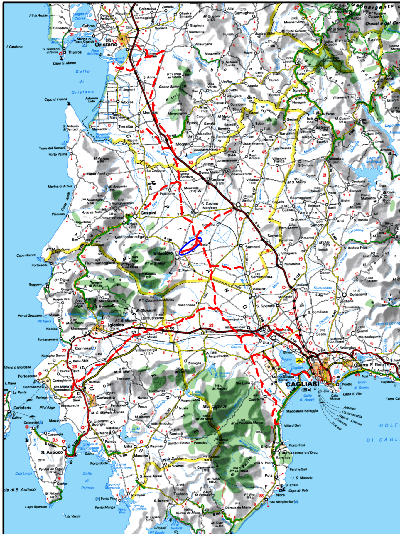
COROGRAFIA Scala 1:500.000

Il presente disegno e' di proprieta' aziendale - Lo Societa' tutelera' i propri diritti a termine di legge.