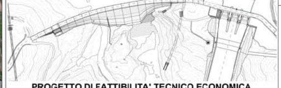
PROGETTO DI FATTIBILITA' TECNICO ECONOMICA

100 = PROGETTO DI FATTIBILITA' GEN = GENERALE INONDAZIONE PRELIMINARE PIENA MILLENARIA