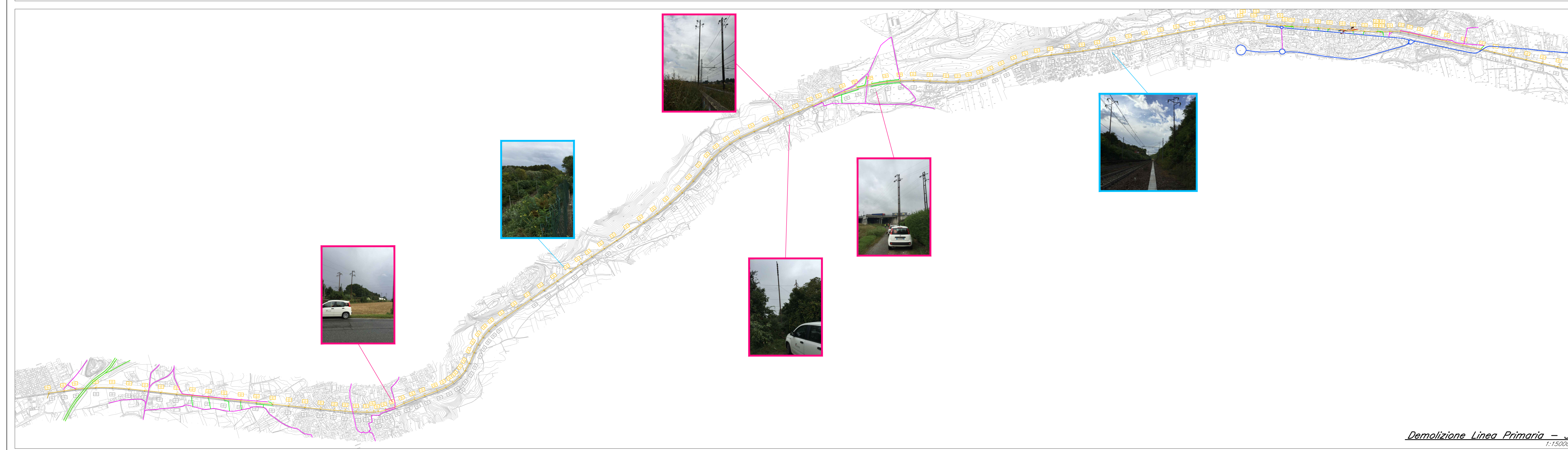
Demolizione Linea Primaria - 3 1:15000

NB Le foto sono da intendersi rappresentative.