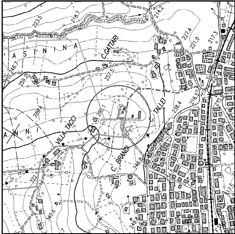
COROGRAFIA 1:10000 CTR 302160