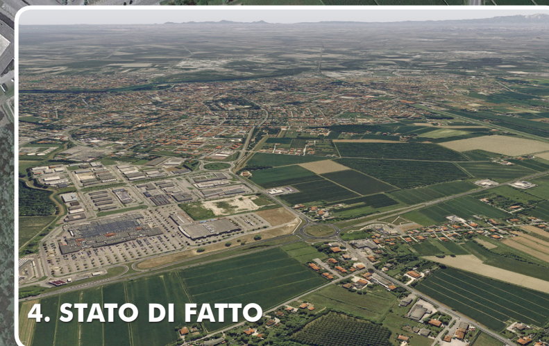
4. STATO DI FATTO