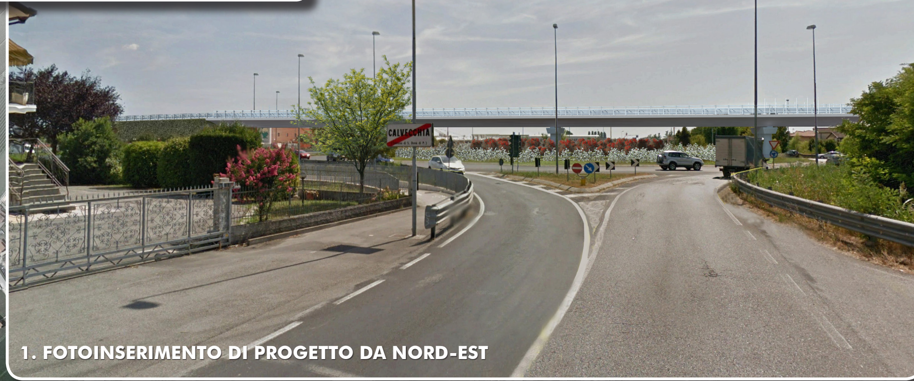
1. FOTOINSERIMENTO DI PROGETTO DA NORD-EST