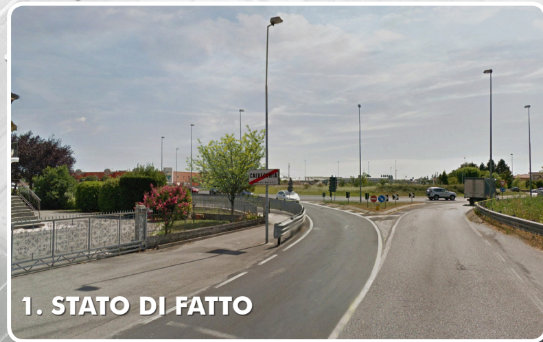
1. STATO DI FATTO