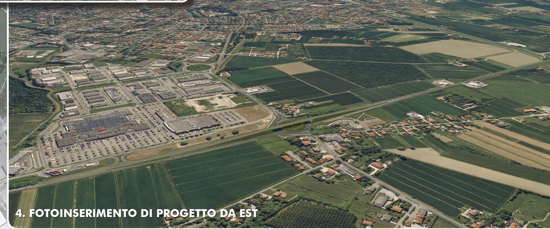
4. FOTOINSERIMENTO DI PROGETTO DA EST