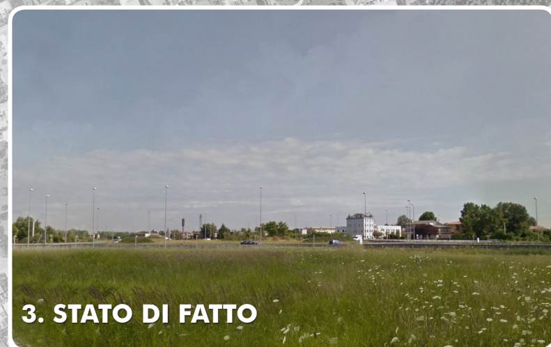
3. STATO DI FATTO