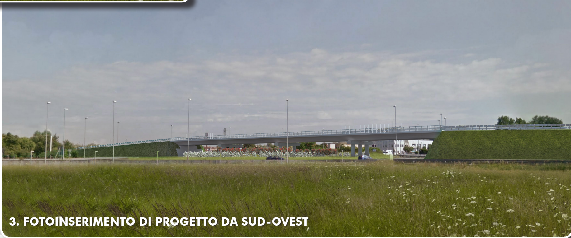
3. FOTOINSERIMENTO DI PROGETTO DA SUD-OVEST