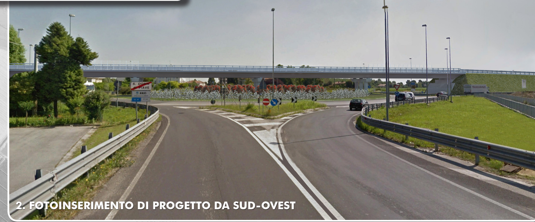
2. FOTOINSERIMENTO DI PROGETTO DA SUD-OVEST