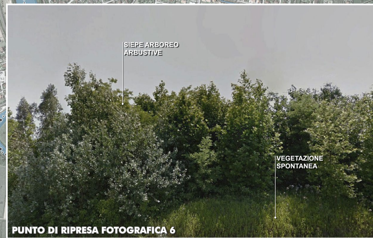
PUNTO DI RIPRESA FOTOGRAFICA 6