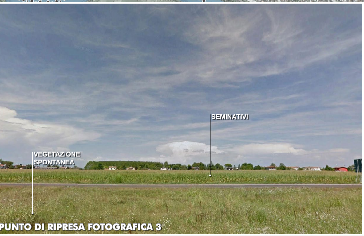
PUNTO DI RIPRESA FOTOGRAFICA 3