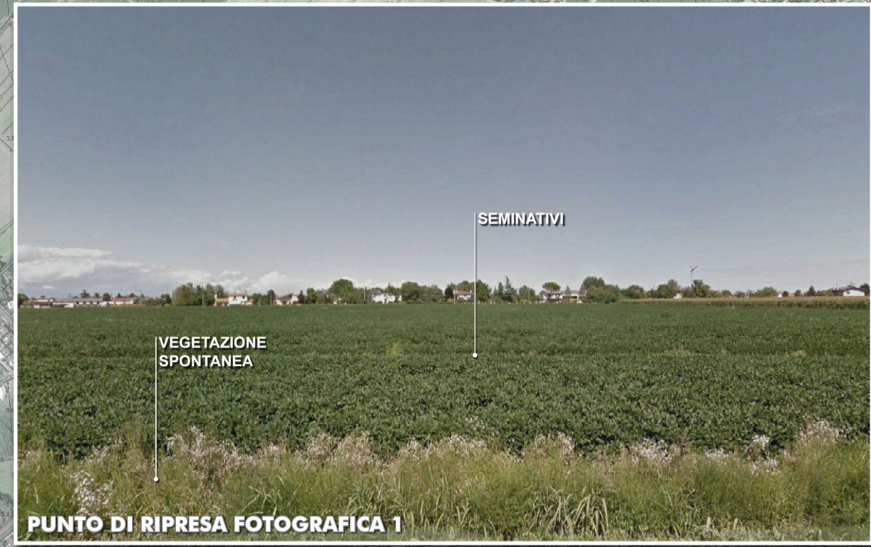
PUNTO DI RIPRESA FOTOGRAFICA 1