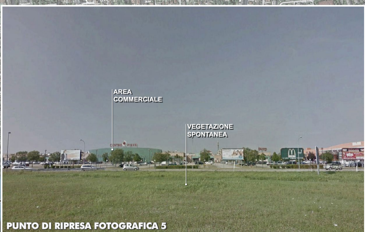
PUNTO DI RIPRESA FOTOGRAFICA 5