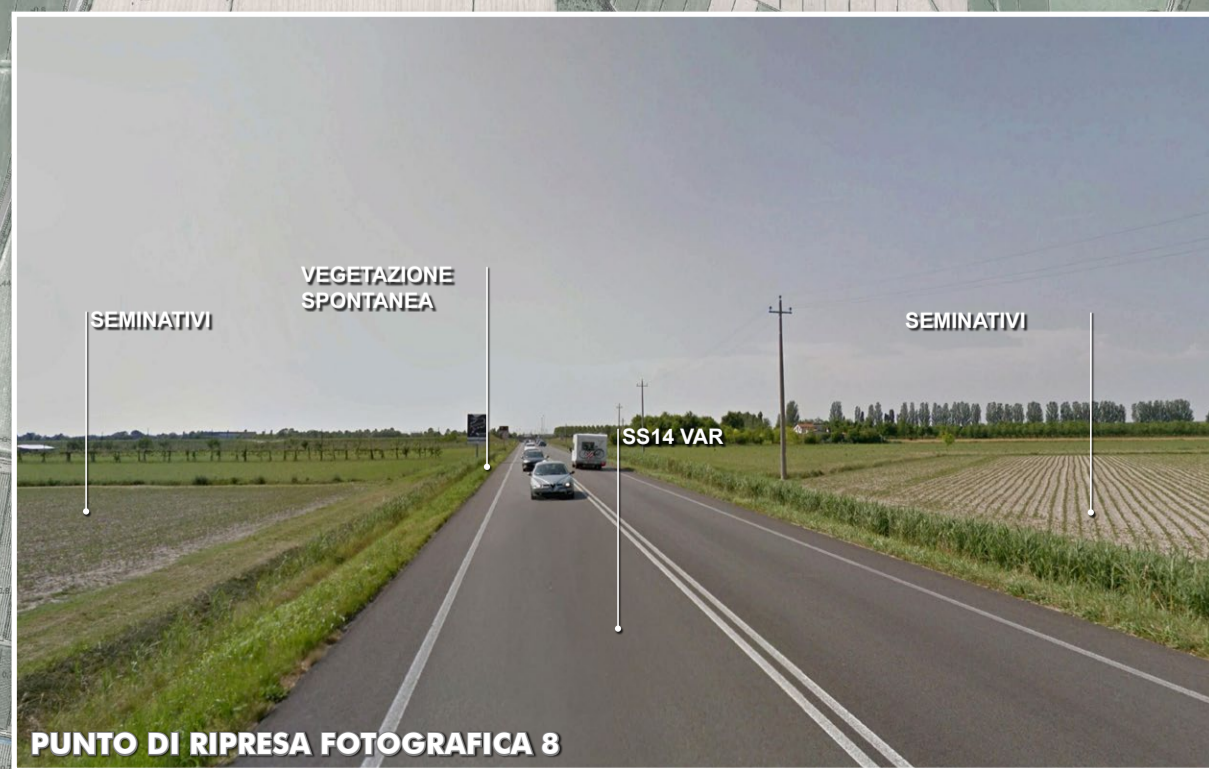
PUNTO DI RIPRESA FOTOGRAFICA 8