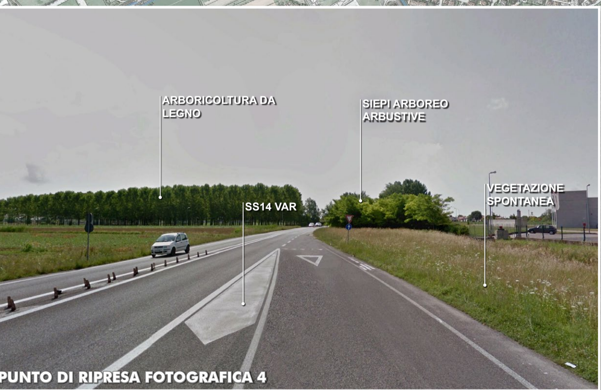
PUNTO DI RIPRESA FOTOGRAFICA 4