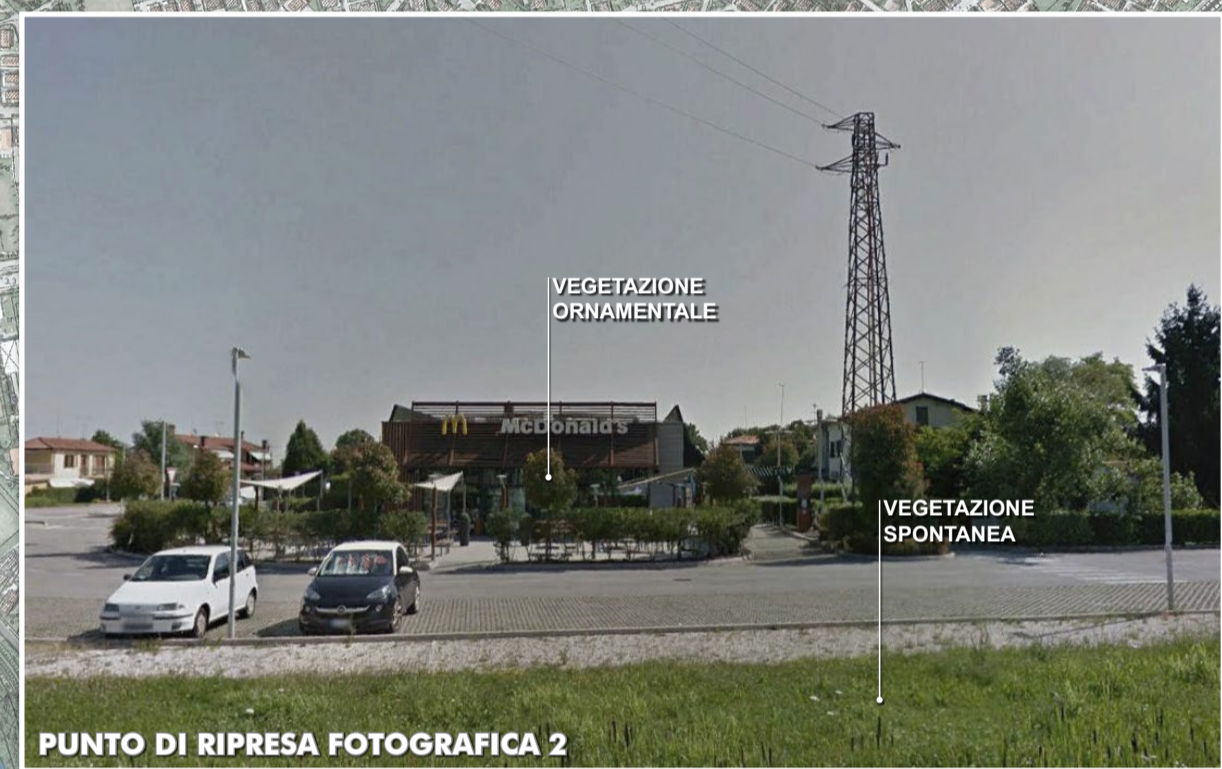
PUNTO DI RIPRESA FOTOGRAFICA 2