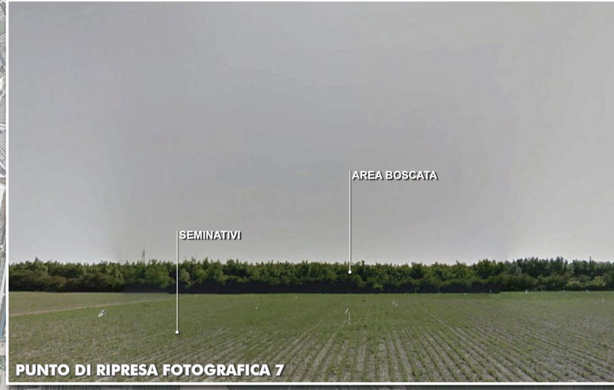
PUNTO DI RIPRESA FOTOGRAFICA 7