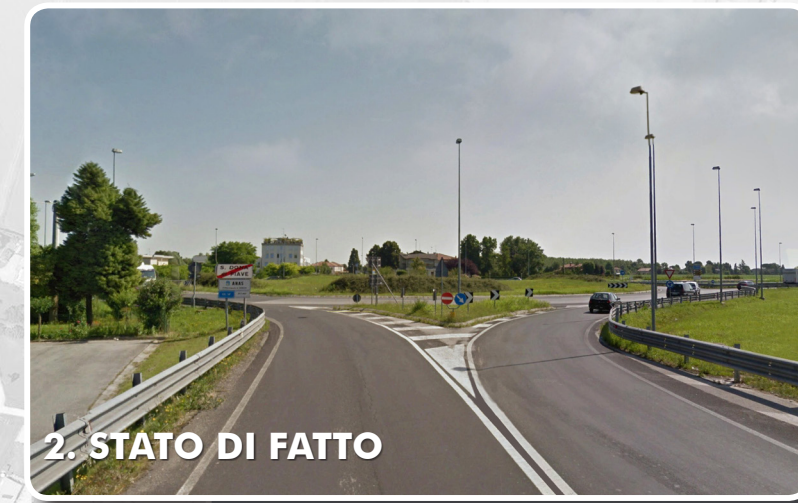
2. STATO DI FATTO