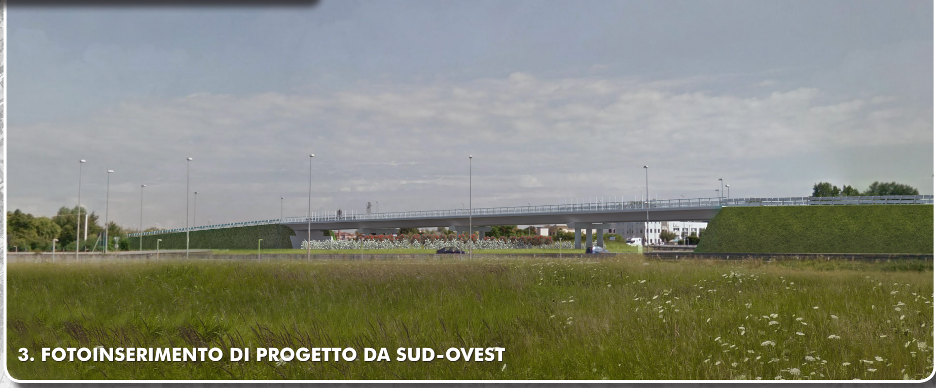
3. FOTOINSERIMENTO DI PROGETTO DA SUD-OVEST