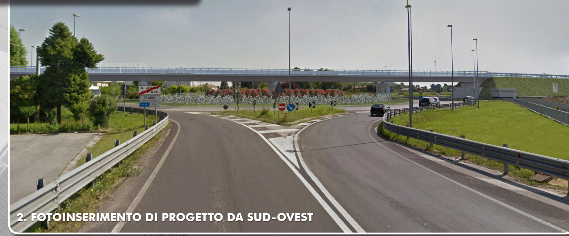
2. FOTOINSERIMENTO DI PROGETTO DA SUD-OVEST