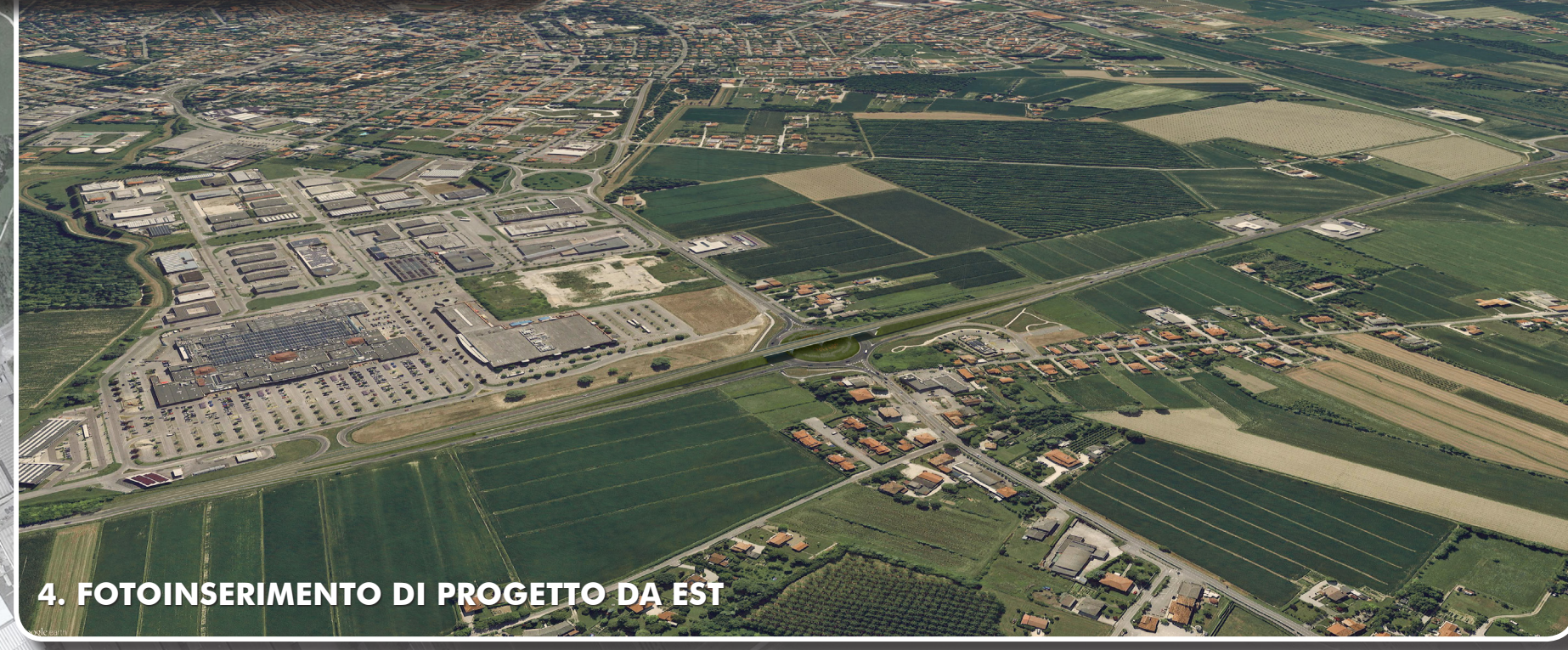
4. FOTOINSERIMENTO DI PROGETTO DA EST