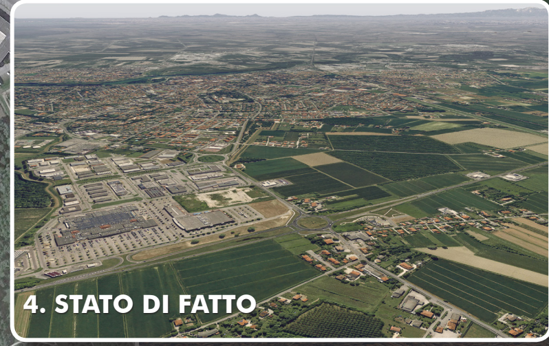
4. STATO DI FATTO