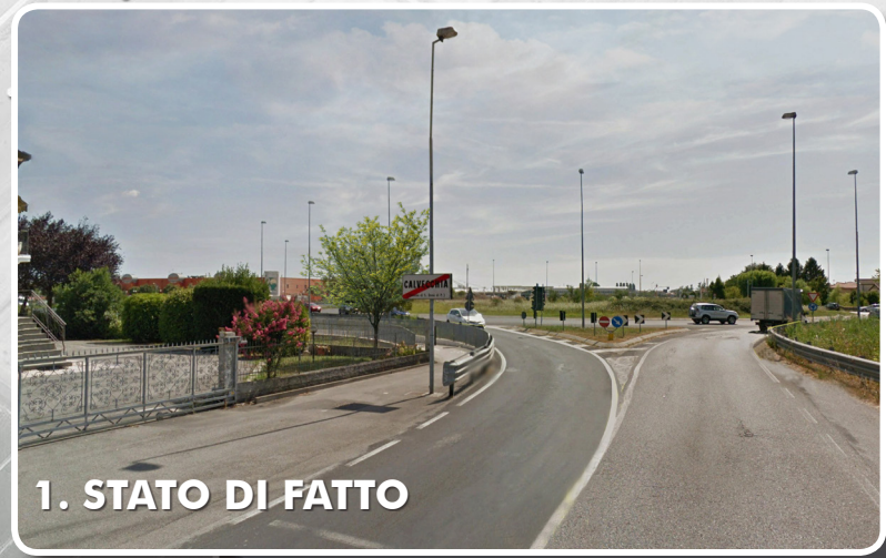
1. STATO DI FATTO