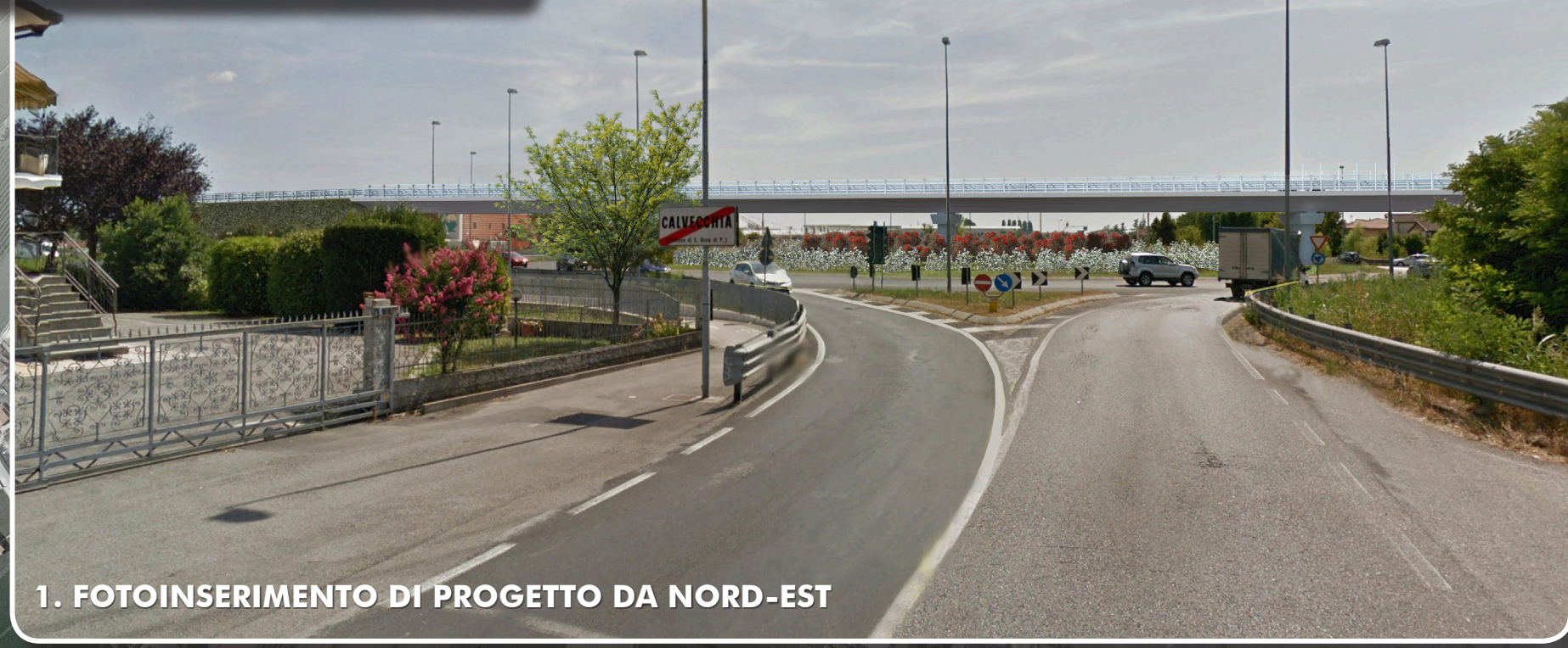
1. FOTOINSERIMENTO DI PROGETTO DA NORD-EST