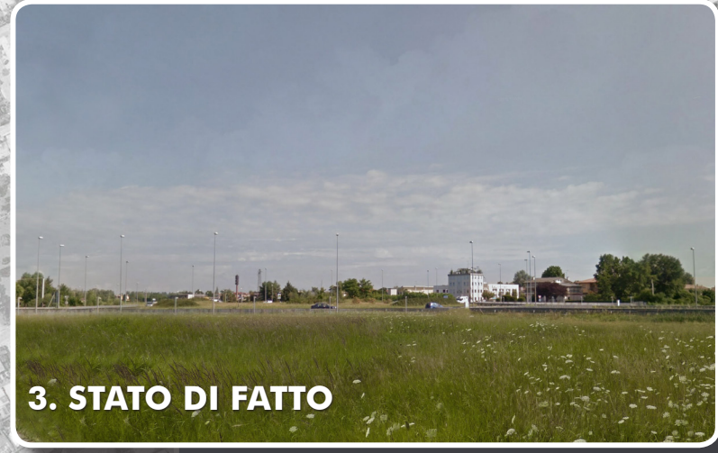
3. STATO DI FATTO