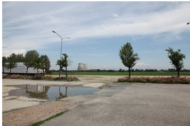
05 - dal parcheggio dell'area commerciale a Castell'Apertole