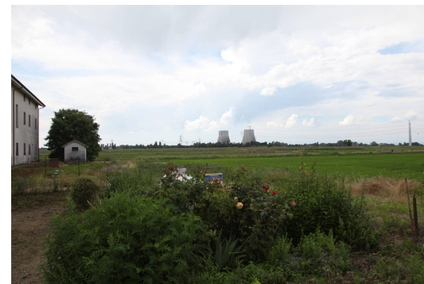
10 - da una cascina a SE dell'area di progetto