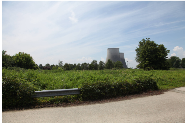
02 - da Leri Cavour