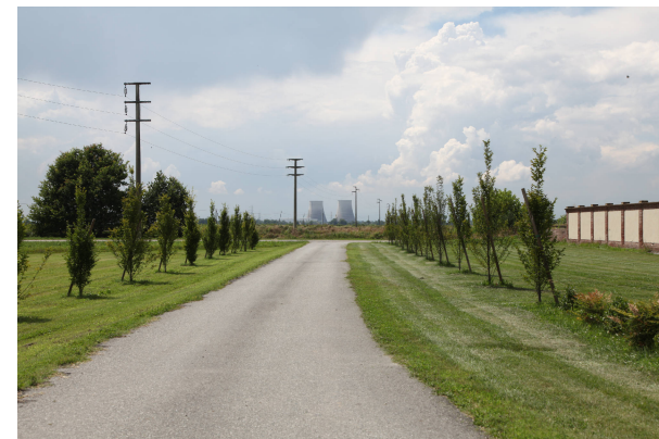
11 - dall'ingresso di Tenuta Darola