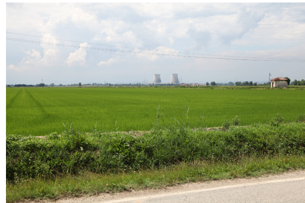
09 - lungo la SP 34 in prossimità del Principato di Lucedio