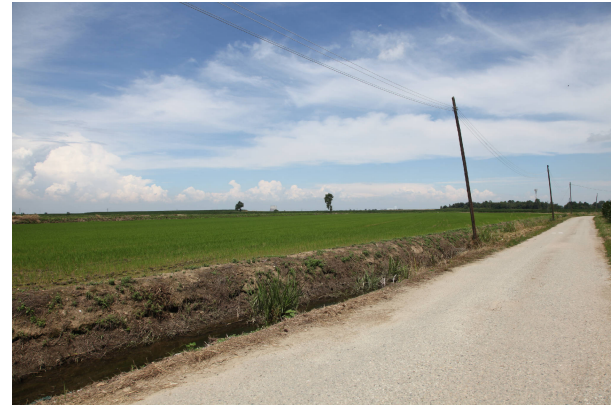
07 - dal fronte urbano di San Genuario