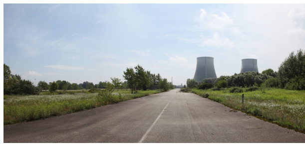
01 - da una strada privata a nord dell'area di progetto