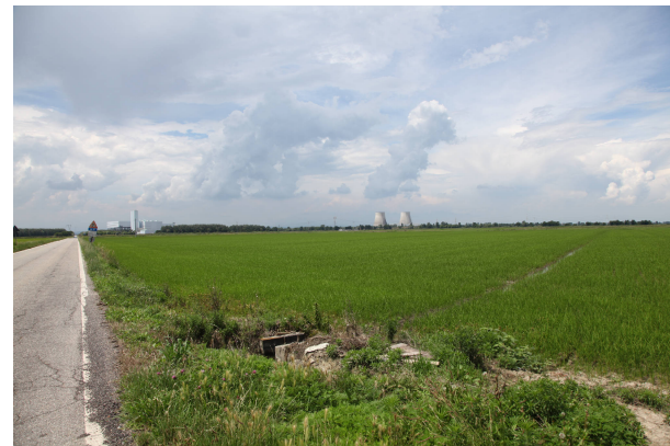
08 - lungo la SP 8 in prossimità del cascinale Montarucco