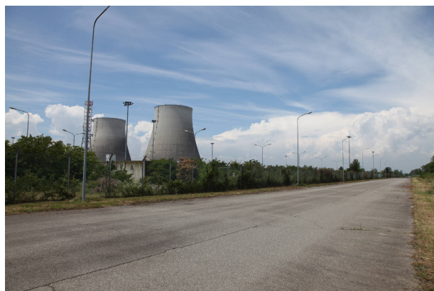
04 - dalla strada che conduce all'ingresso della centrale