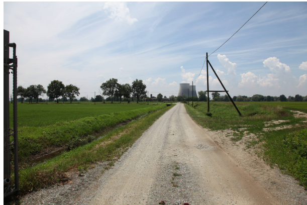
03 - da Cascina Castelserlino