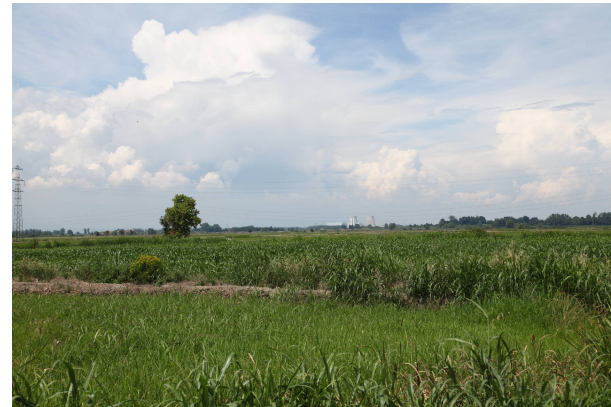
06 - dal fronte urbano di Fontanetto Po