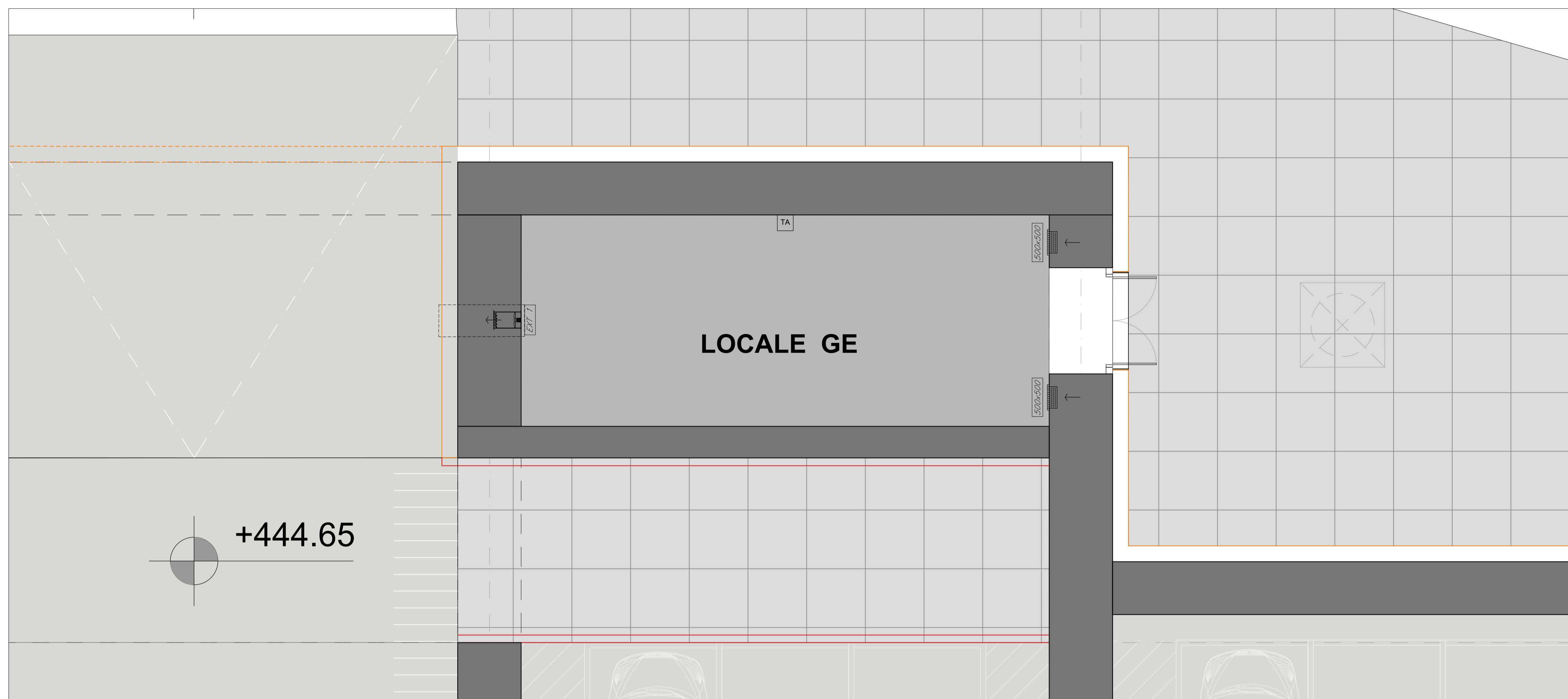
LAYOUT IMPIANTO HVAC - FABBRICATO VIAGGIATORI STAZIONE ENNA - LOCALE GE