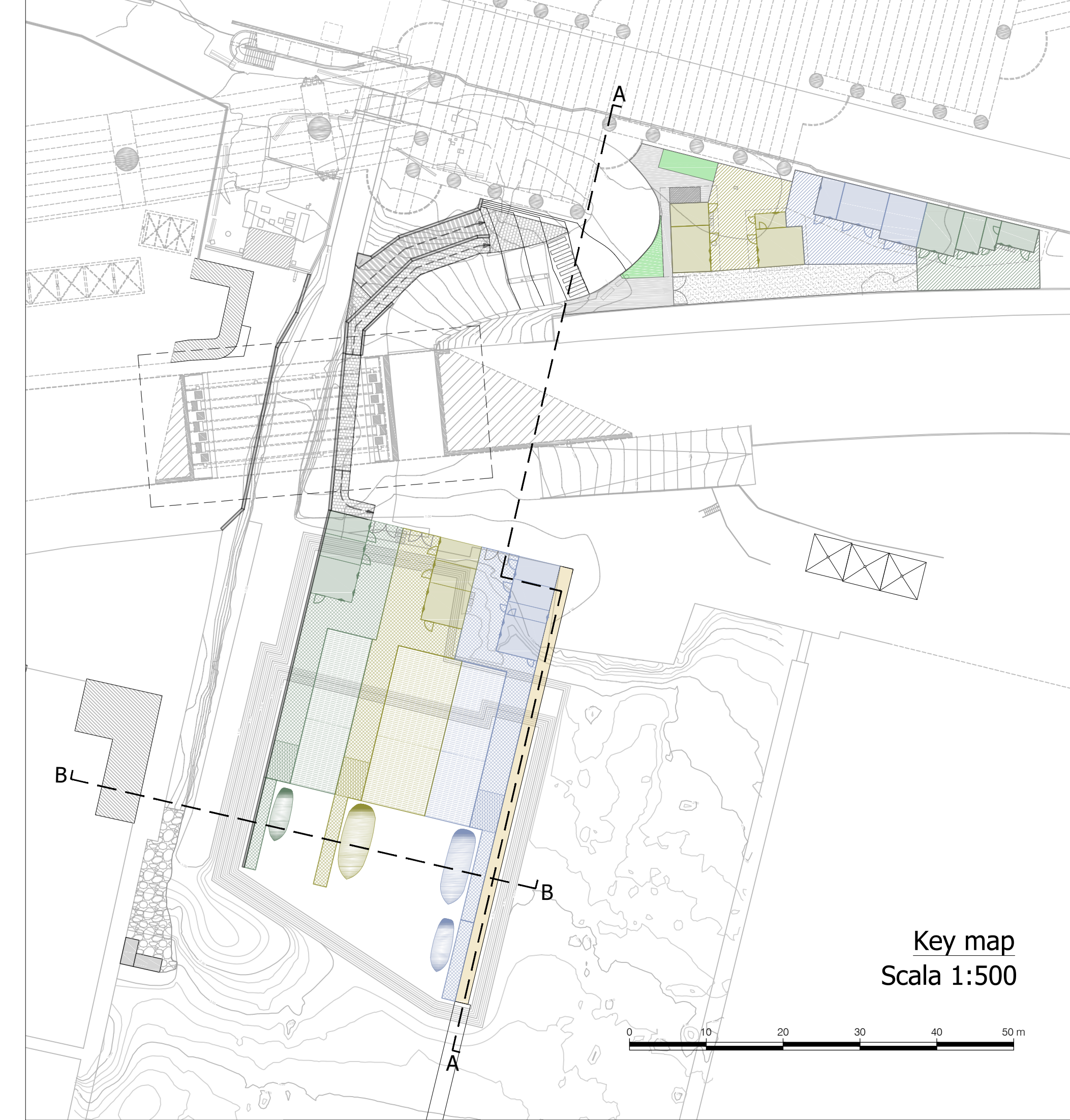
Key map Scala 1:500