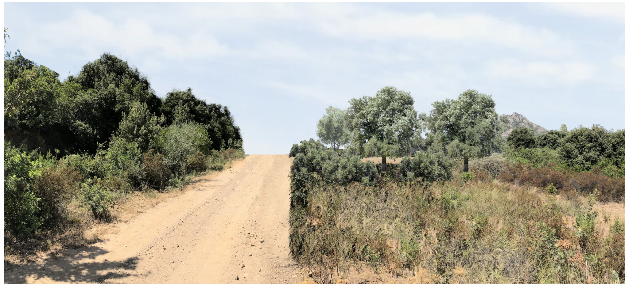
Simulazione stato di progetto