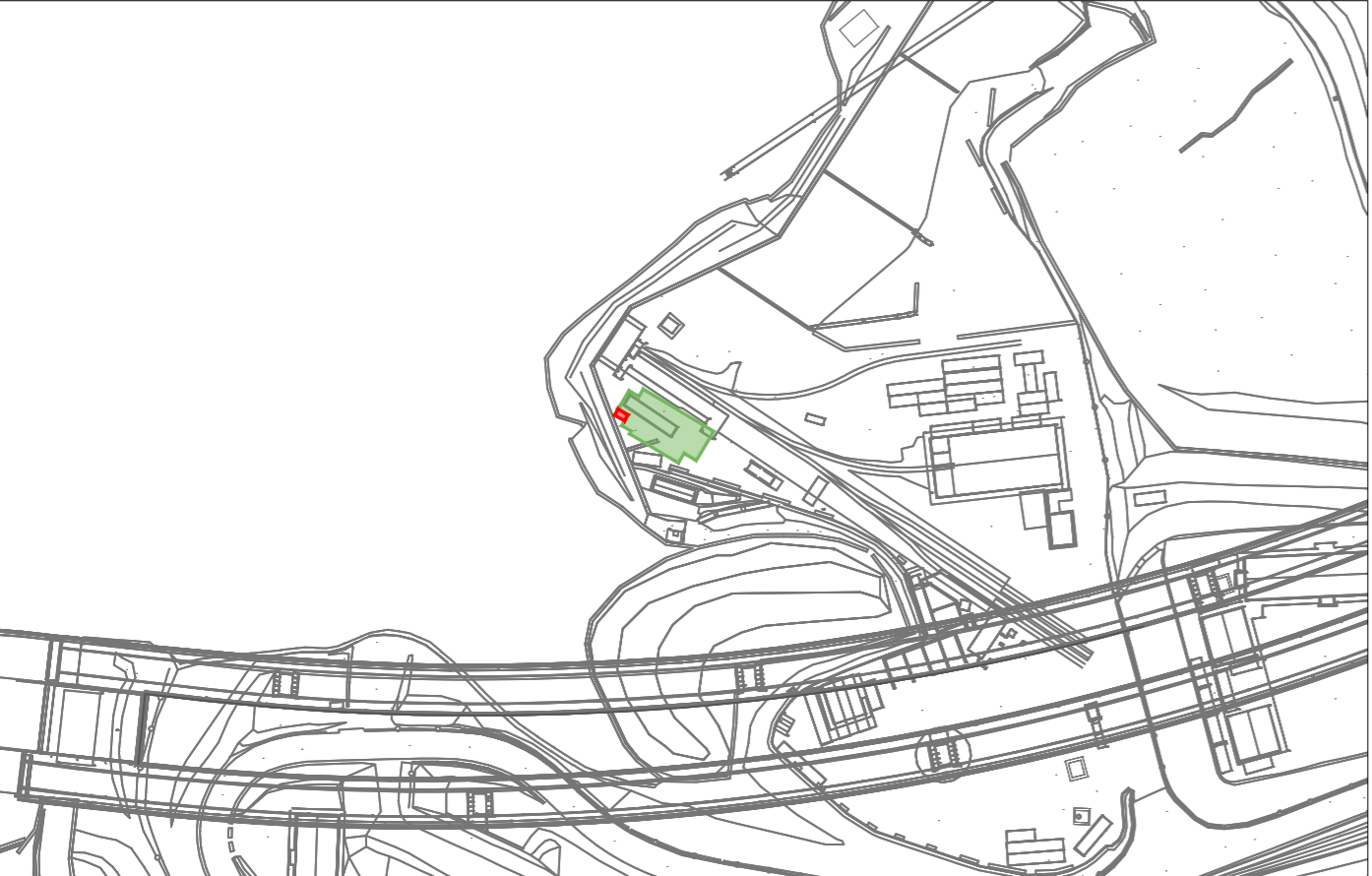
Carte de risque archeologique - Tavola del rischio archeologico