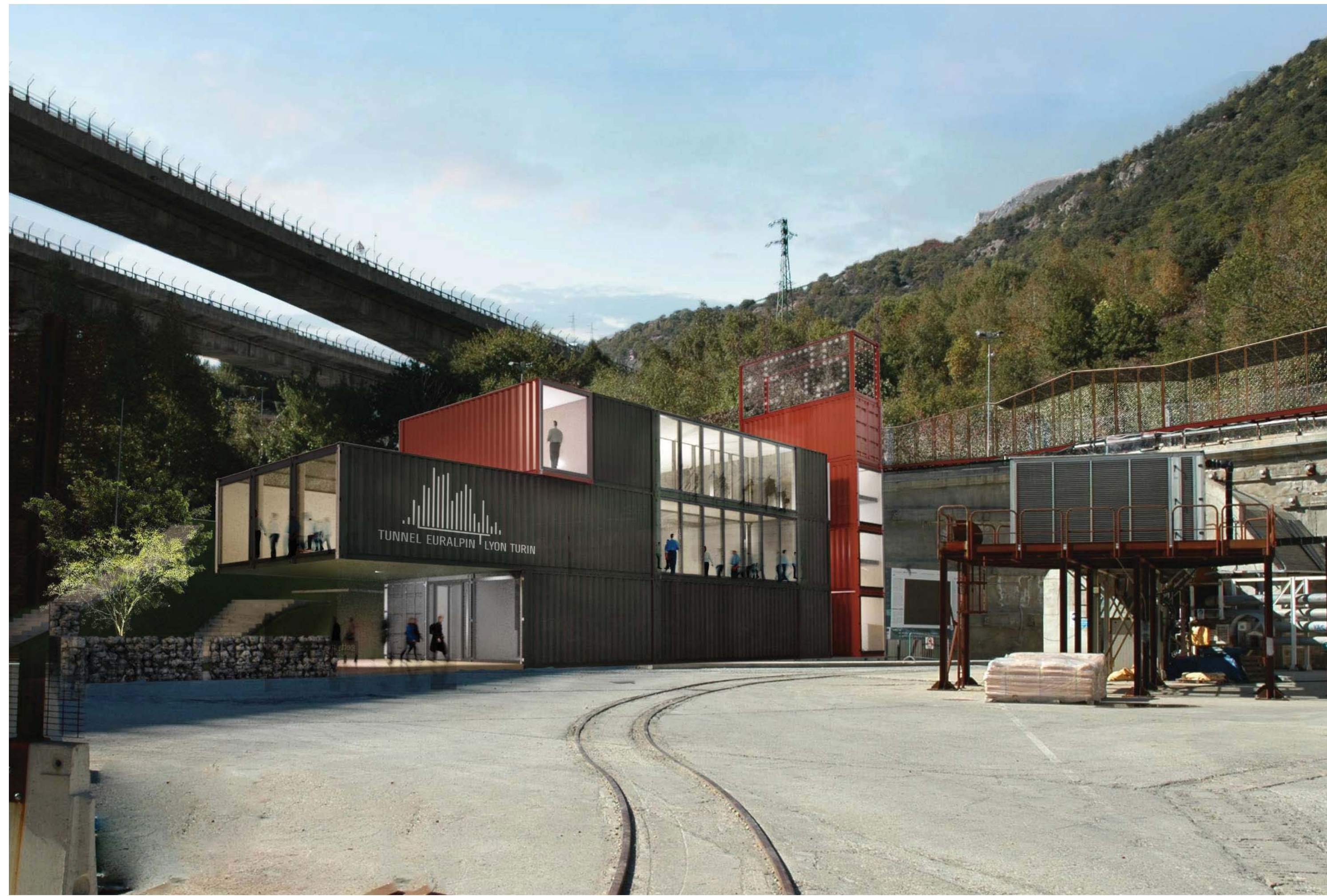
Render fotoinserito - giorno