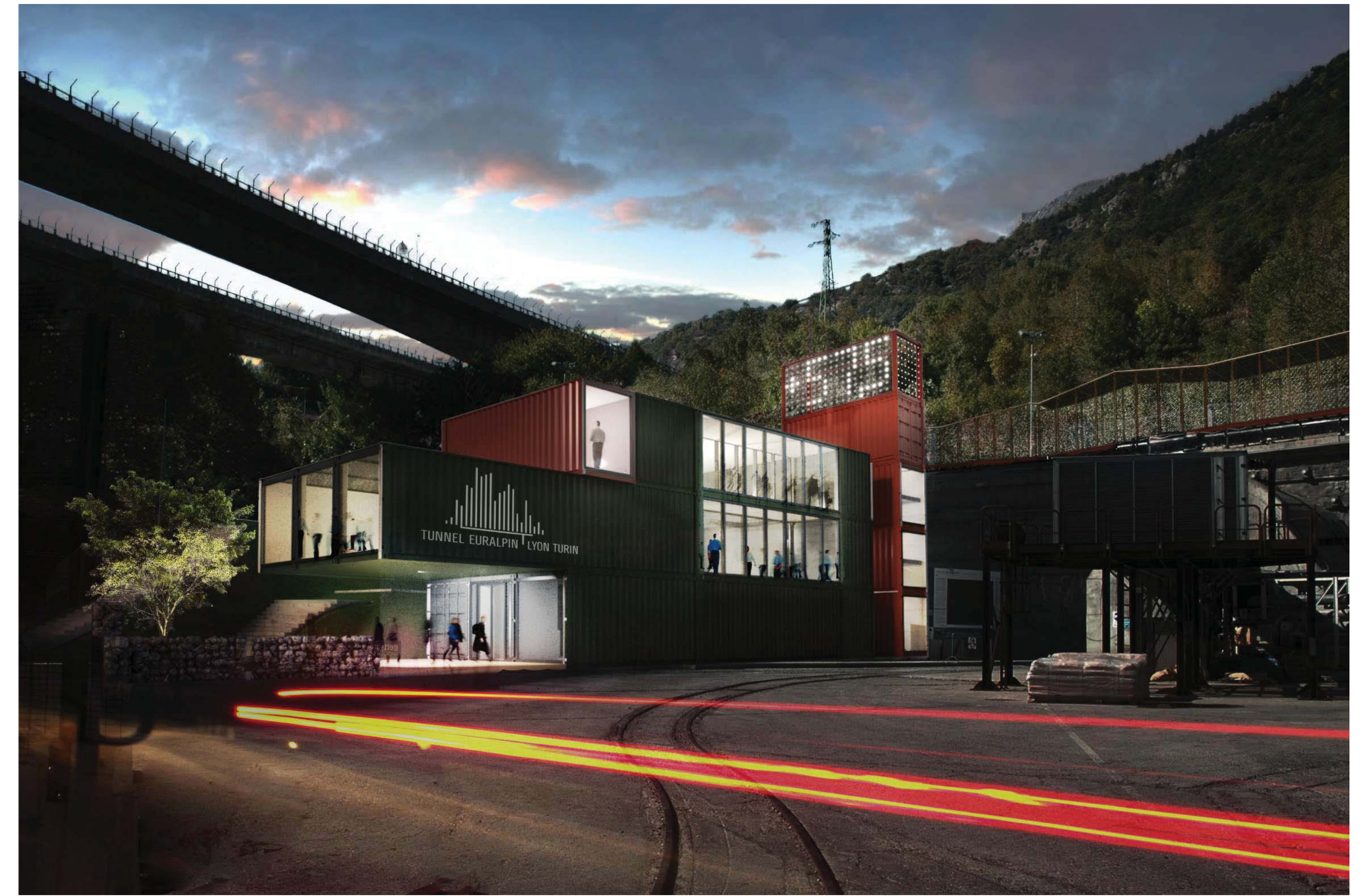
Render fotoinserito - tramonto