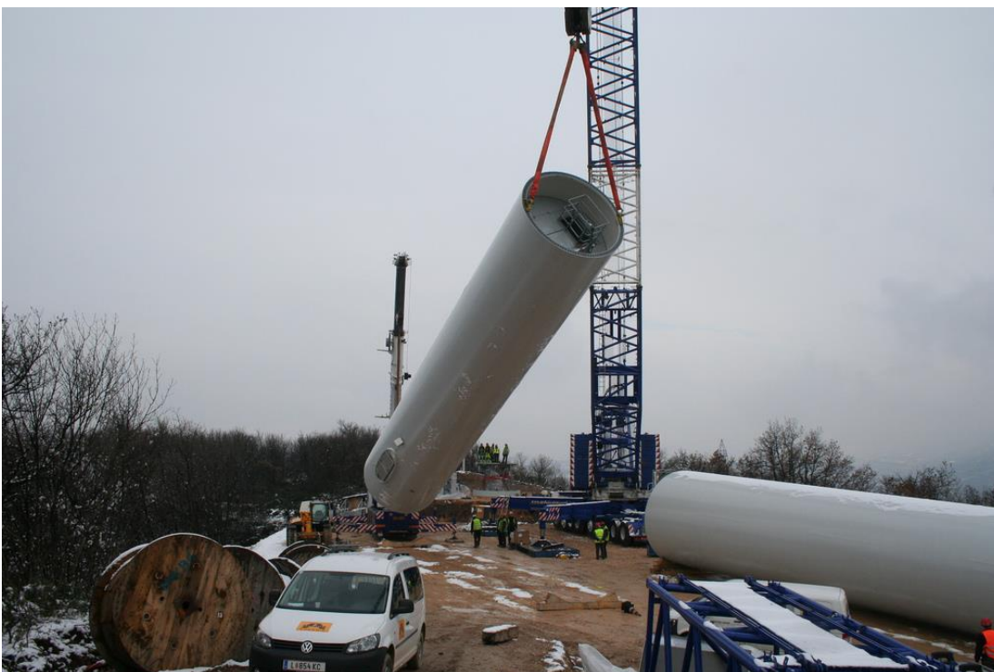
Figura 3. Smontaggio dei tronchi