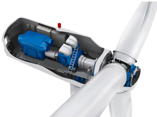
Figura 1. Disposizione dei componenti in navicella

Impianto eolico nel Comune di San Severo in località “La Camera”, costituito da n. 10 per una potenza complessiva di 60 MW comprese le relative opere di connessione alla rete ed infrastrutture indispensabili alla costruzione ed all’esercizio dell’impianto.