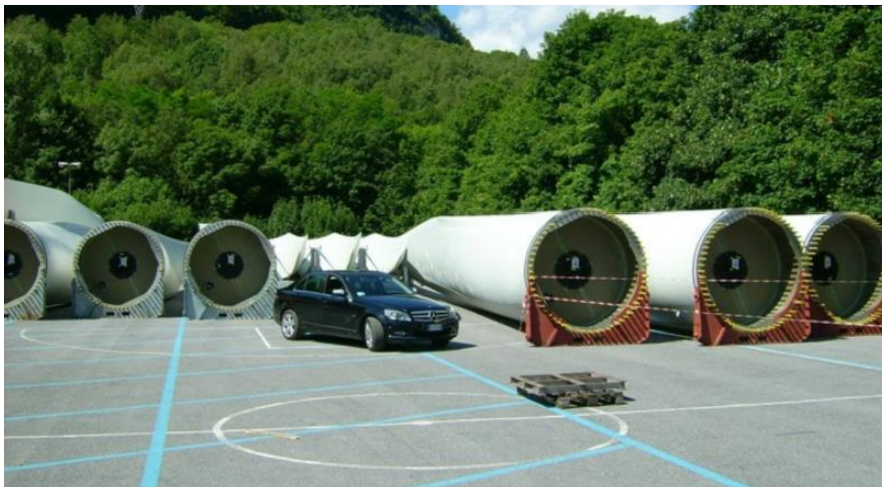
Figura 4. Deposito dei componenti nel centro di recupero

Impianto eolico nel Comune di San Severo in località “La Camera”, costituito da n. 10 per una potenza complessiva di 60 MW comprese le relative opere di connessione alla rete ed infrastrutture indispensabili alla costruzione ed all’esercizio dell’impianto.