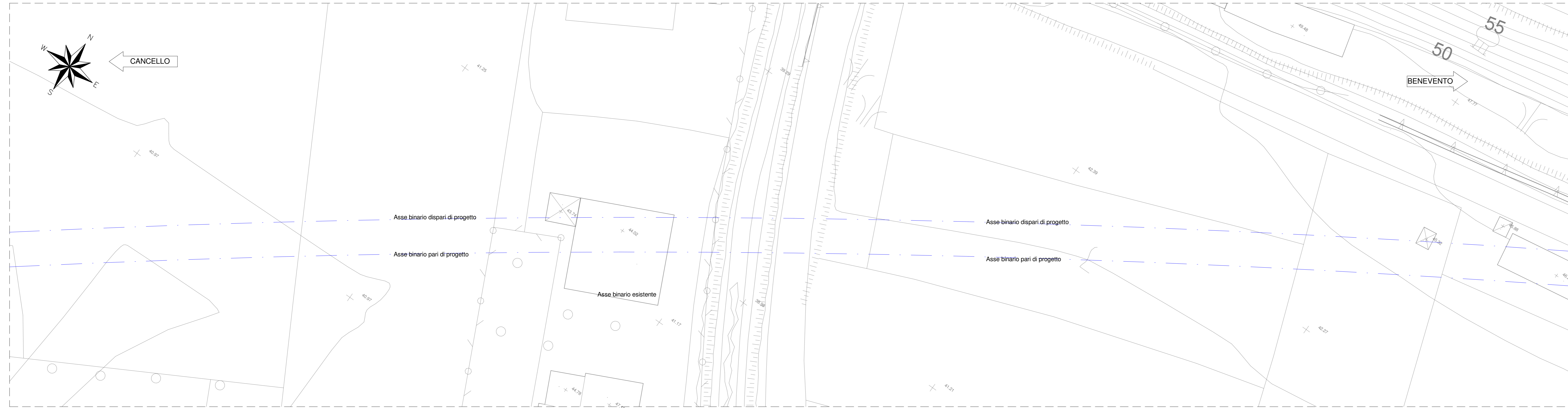
1 Planimetria Ante Operam