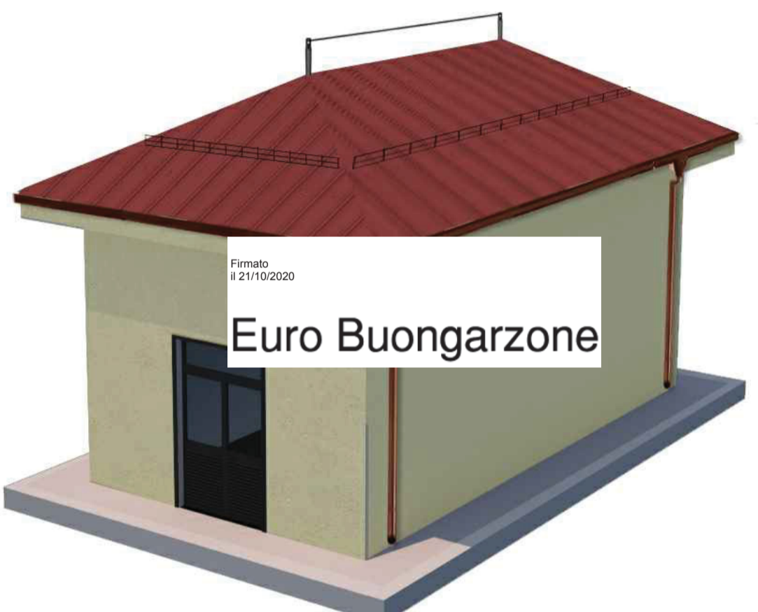
RENDER N°3 - FABBRICATO MEDIA TENSIONE (rif. 55) Vedere Elaborato: FABBRICATO MEDIA TENSIONE - ARCHITETTONICI PIANTE, PROSPETTI E SEZIONI (00-CC-A-12023)