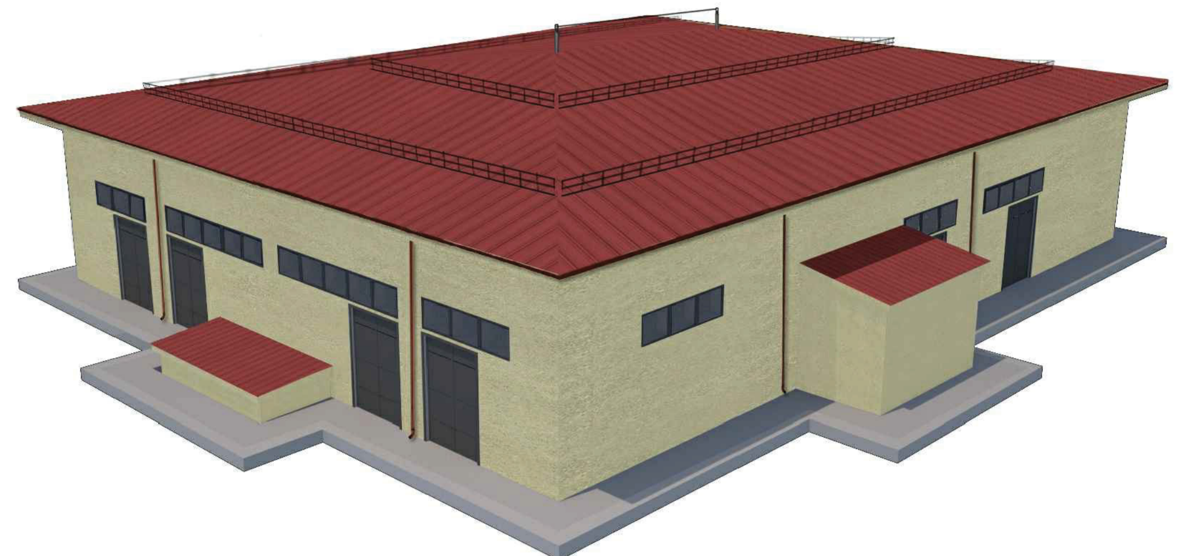
RENDER N°5 - FABBRICATO SOTTOSTAZIONE ELCO (rif.53) Vedere Elaborato: FABBRICATO SOTTOSTAZIONE ELCO ARCHITETTONICO - PIANTE PIANO INTERRATO, TERRA, COPERTURA E DETTAGLI (00-CC-A-12020)