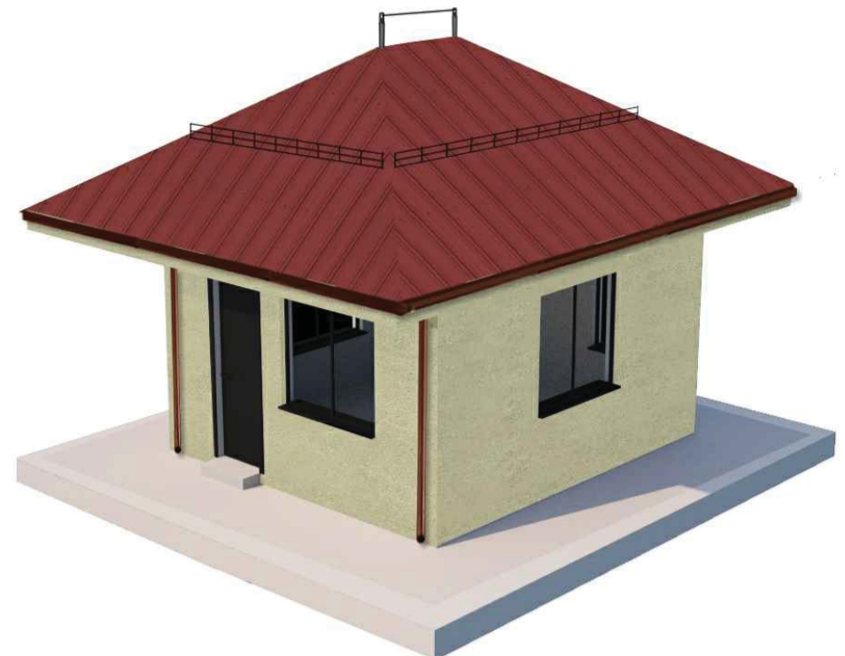
RENDER N°6 - GUARDIOLA (rif.51) Vedere Elaborato: GUARDIOLA ARCHITETTONICO PIANTE PROSPETTI E SEZIONI (00-CC-A-12035)