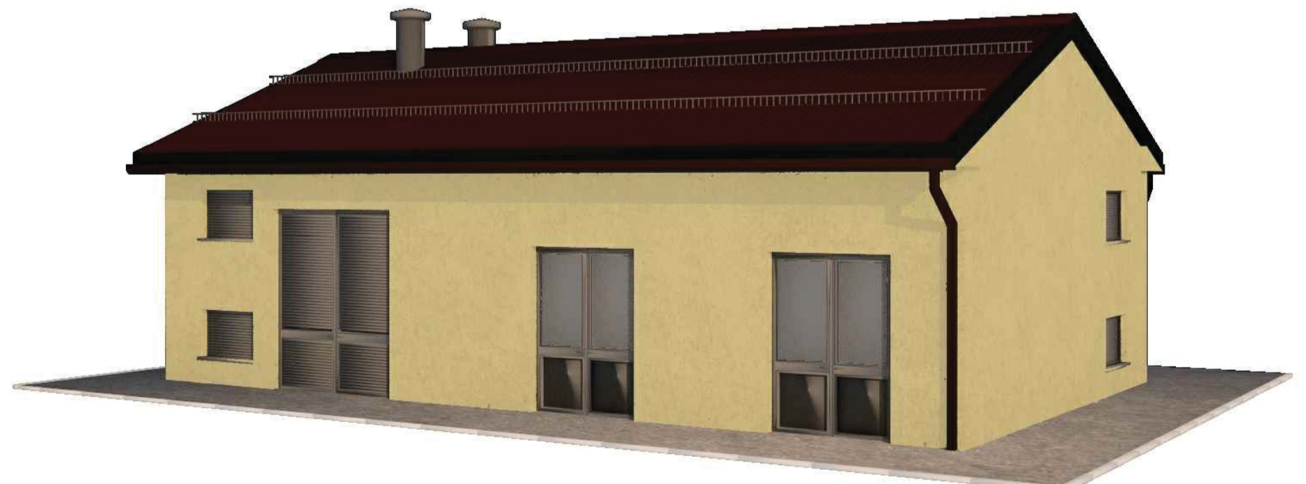
RENDER N°2 - FABBRICATO MISURE FISCALI (rif.48) Vedere Elaborato: FABBRICATO MISURE FISCALI - ARCHITETTONICI - PIANTE, PROSPETTI E SEZIONI (00-CC-B-12030)