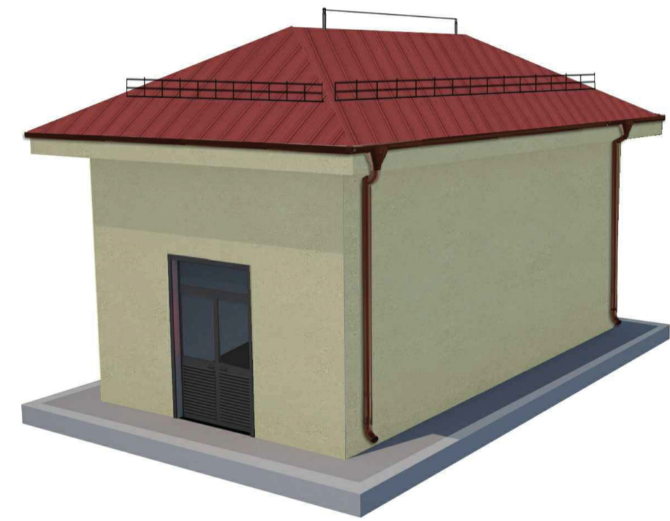
RENDER N°4 - SOTTOSTAZIONE HVAC PER COMPRESSORE ELCO (rif.58) Vedere Elaborato: FABBRICATO HVAC PER SOTTOSTAZIONE ELCO - ARCHITETTONICI - PIANTE, PROSPETTI, SEZIONI (00-CC-A-12037)