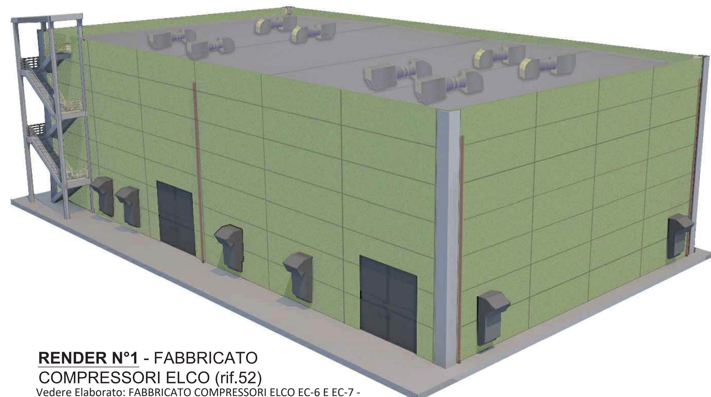
RENDER N°1 - FABBRICATO COMPRESSORI ELCO (rif.52) Vedere Elaborato: FABBRICATO COMPRESSORI ELCO EC-6 E EC-7 - ARCHITETTONICO, PIANTE (00-CC-A-12016)

Euro Buongarzone Digitally signed by Euro Buongarzone Date: 2020.11.27 15:04:10 +01'00'