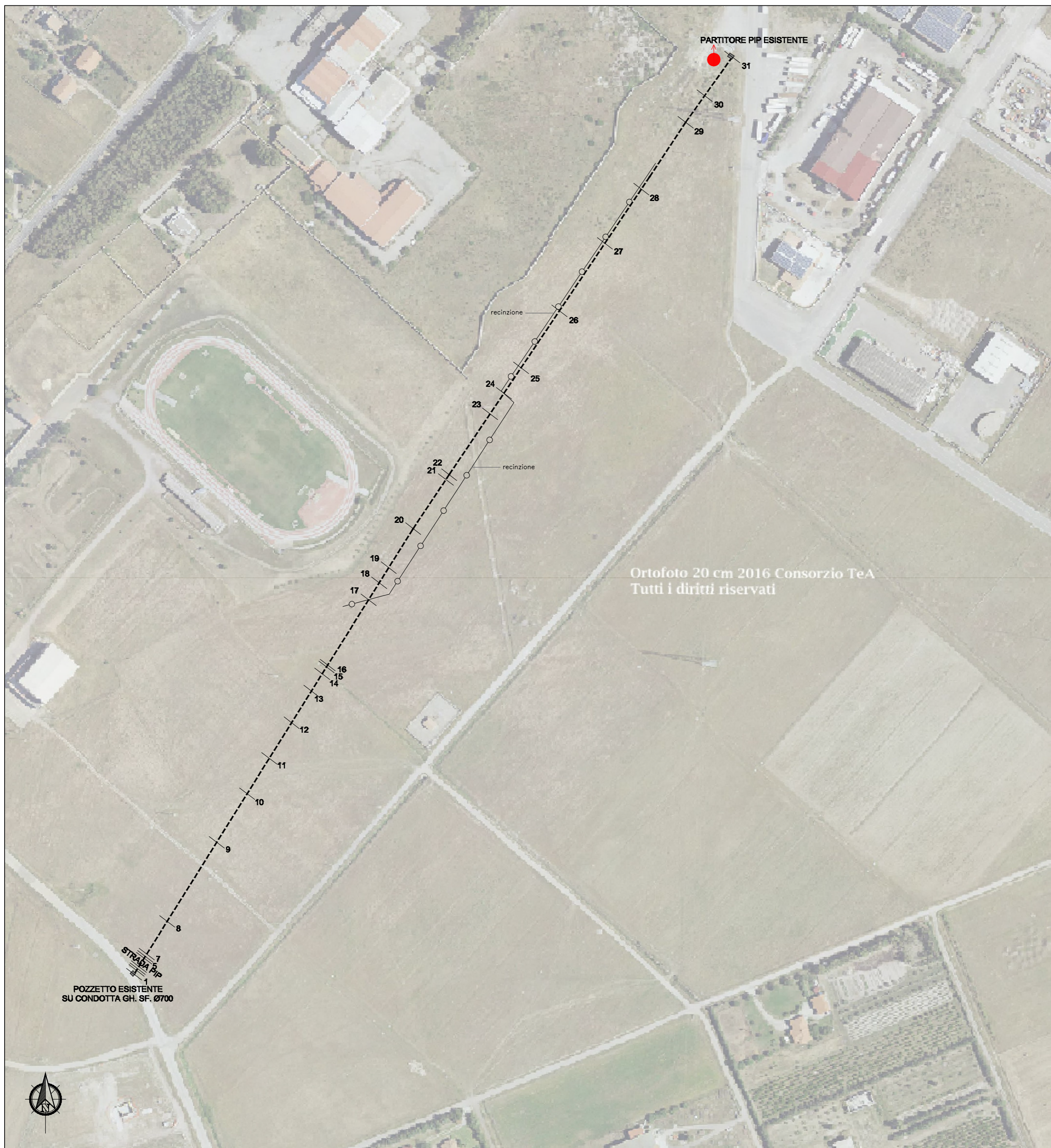
Ortofoto 20 cm 2016