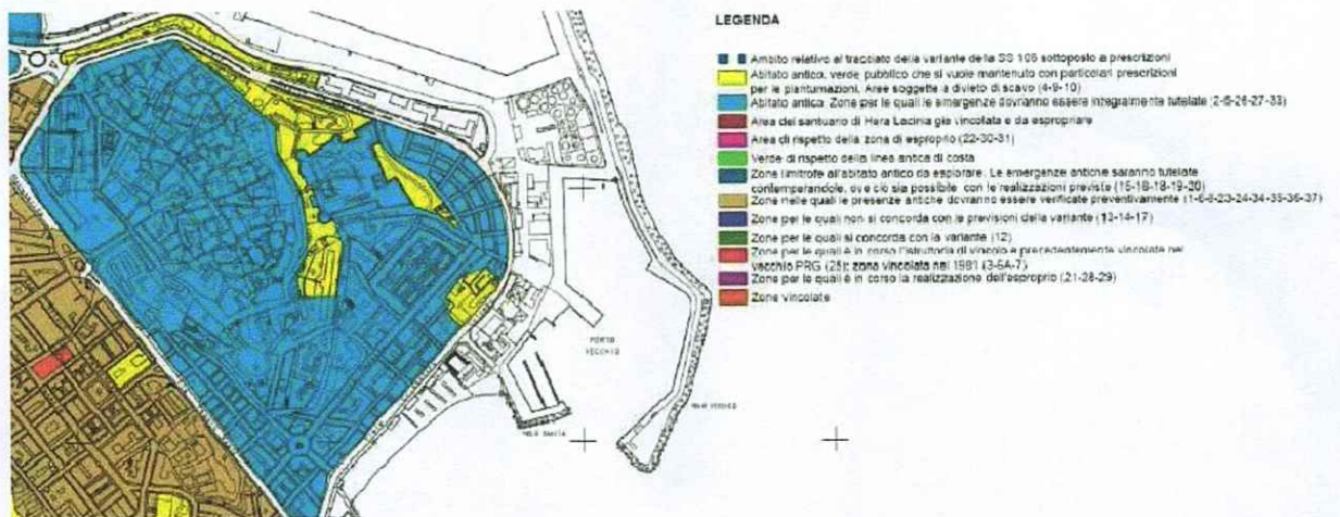
La tavola A.1 "Archeologica" del PRG di Crotona, sopra riportata, evidenzia l'assenza di elementi d'interesse