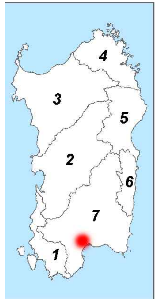
Sub bacino 7: Flumensosa - Campidano - Cixerri

Sanas GRUPPO FS ITALIANE Direzione Progettazione e Realizzazione Lavori