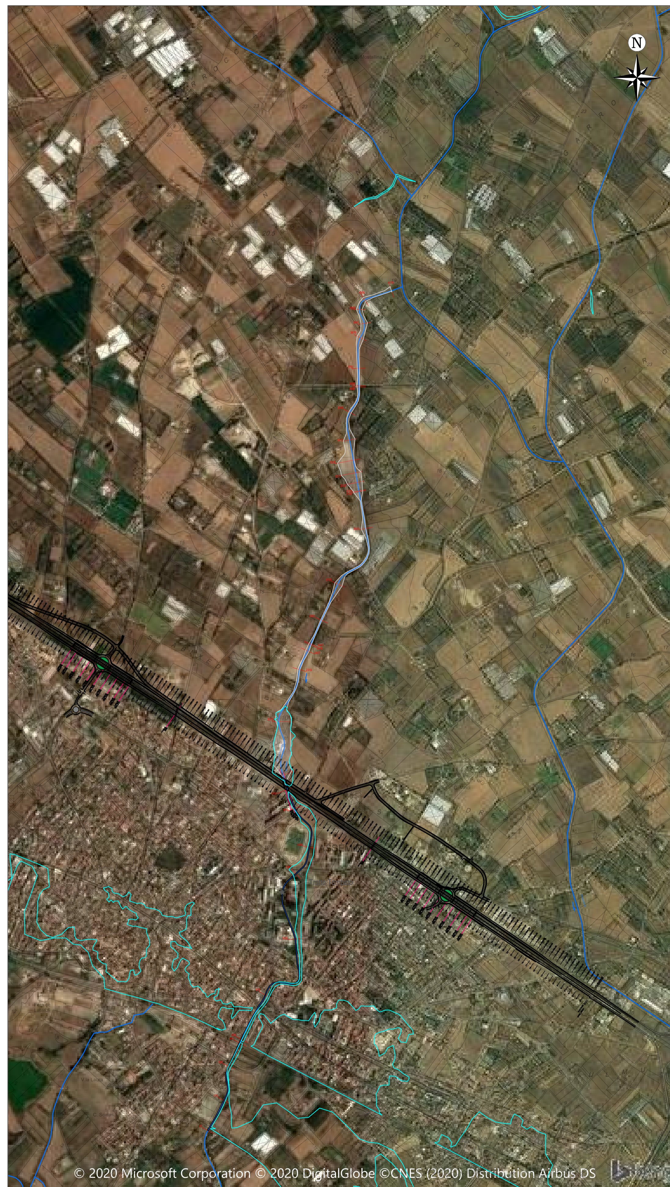
Planimetria delle aree di esondazione su base CTR 1:10.000 Comune di Assemini